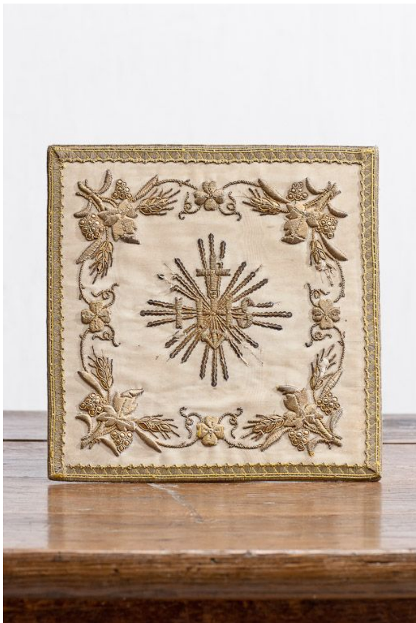
Vue d'ensemble d'une pale.