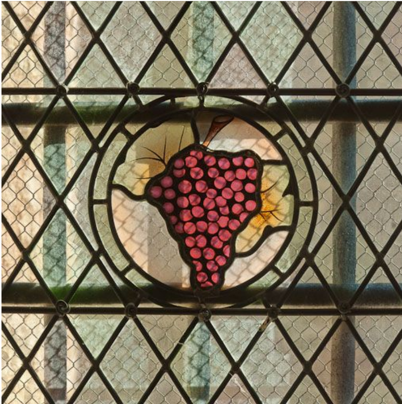
Verrière : détail de la grappe.