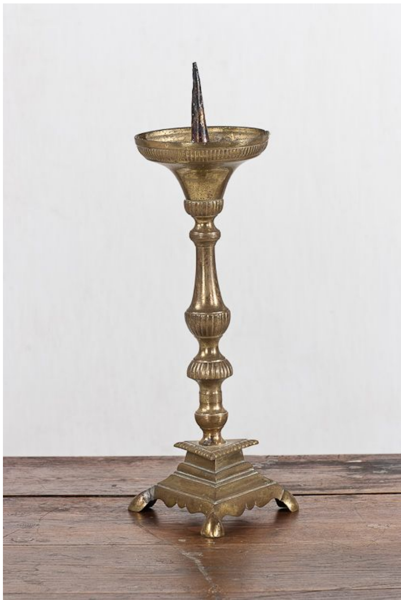
Vue d'ensemble d'un chandelier.