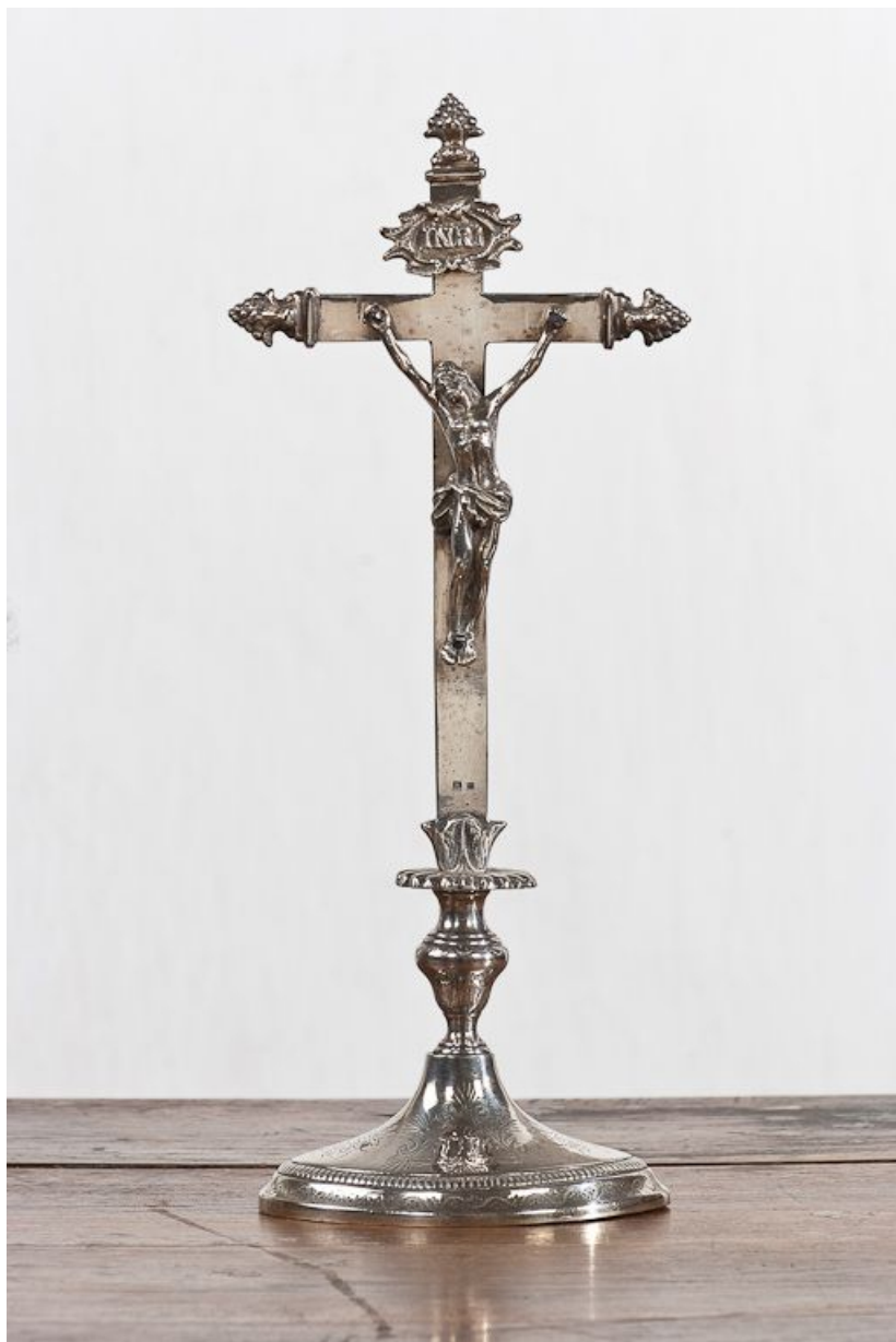
Vue d'ensemble d'une croix d'autel.