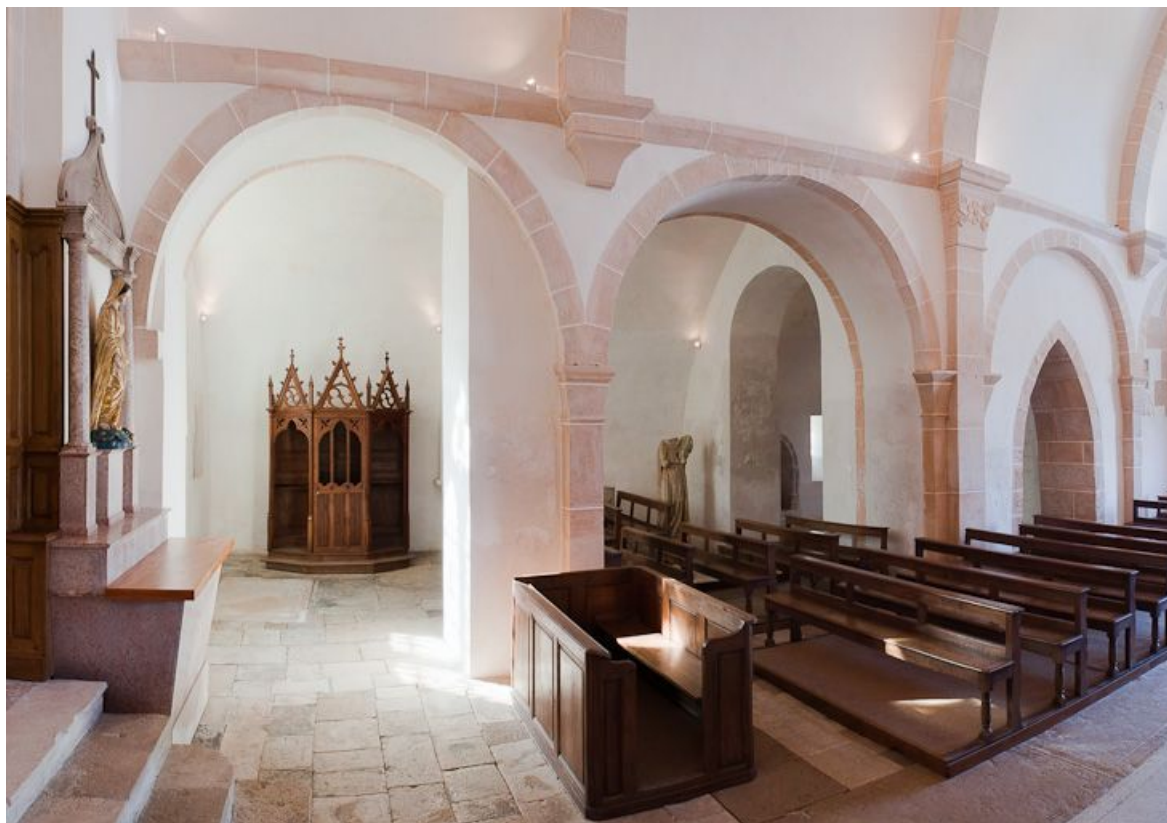
Bas-côté droit et banc de la nef.