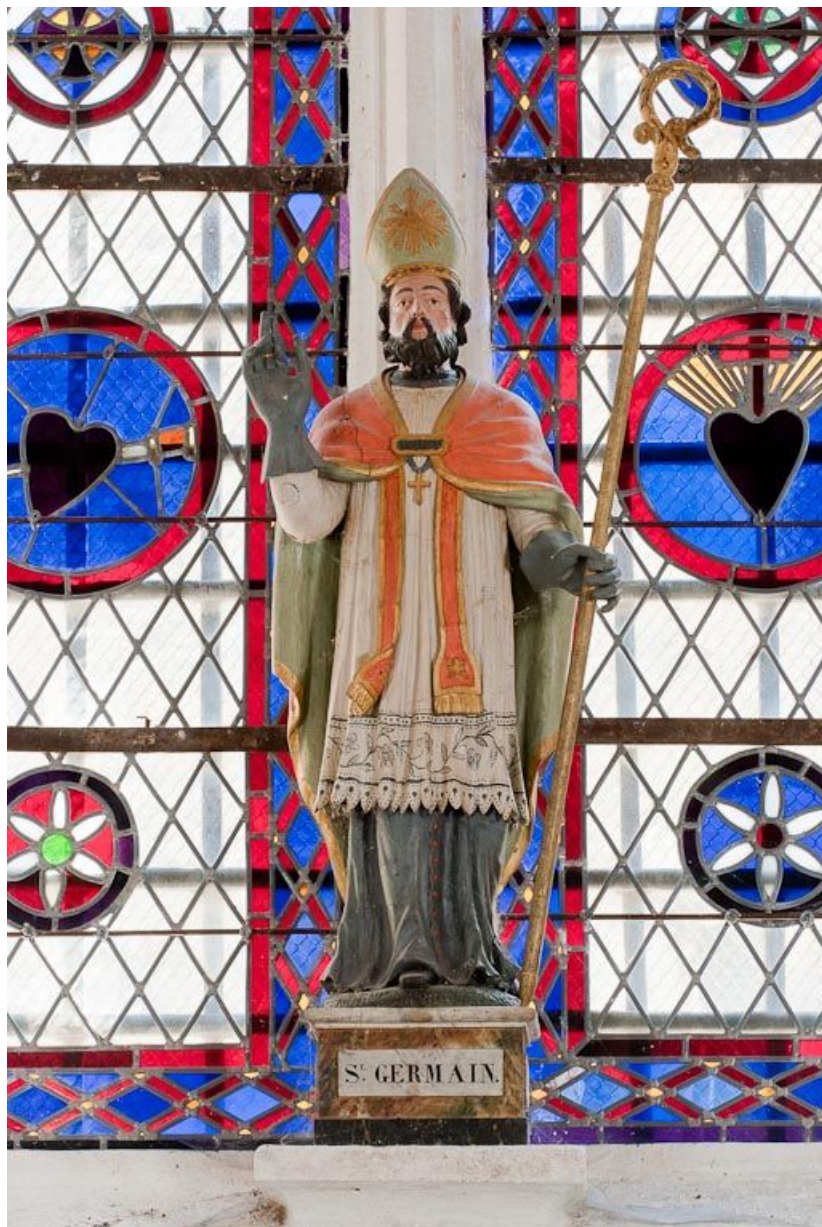
Vue d'ensemble. 21, Montheleie