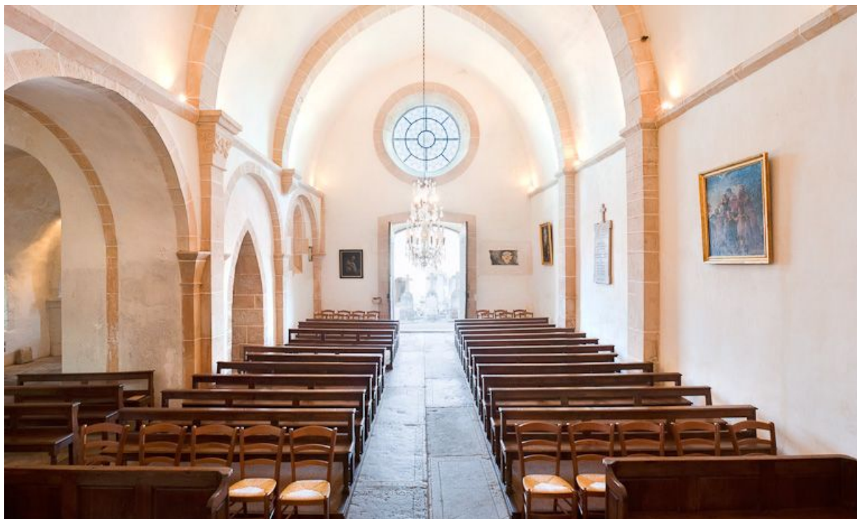
Nef et bas-côté depuis le chœur.