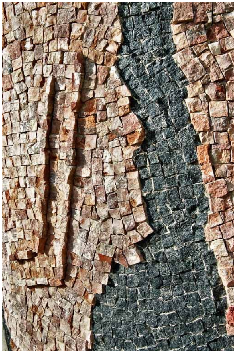
Détail, colonne de gauche.