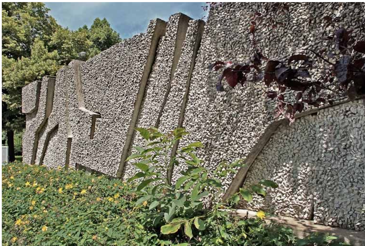
Vue de face, détail.