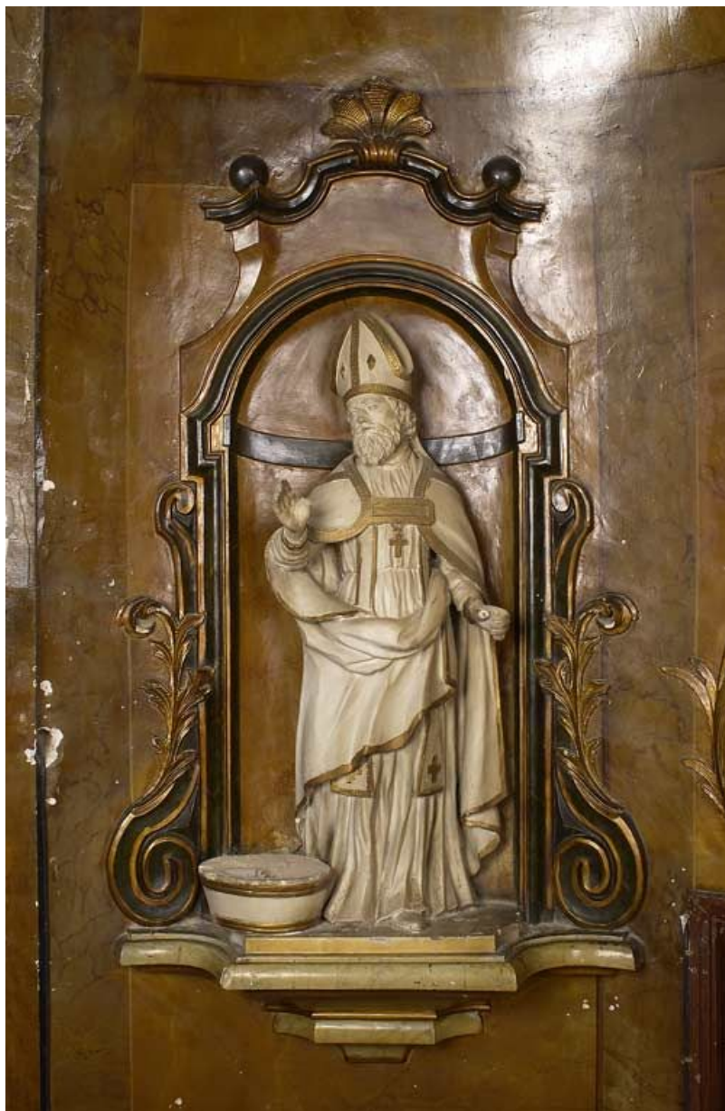
Vue d'ensemble dans la niche du retable