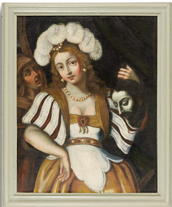
Tableau après restauration.