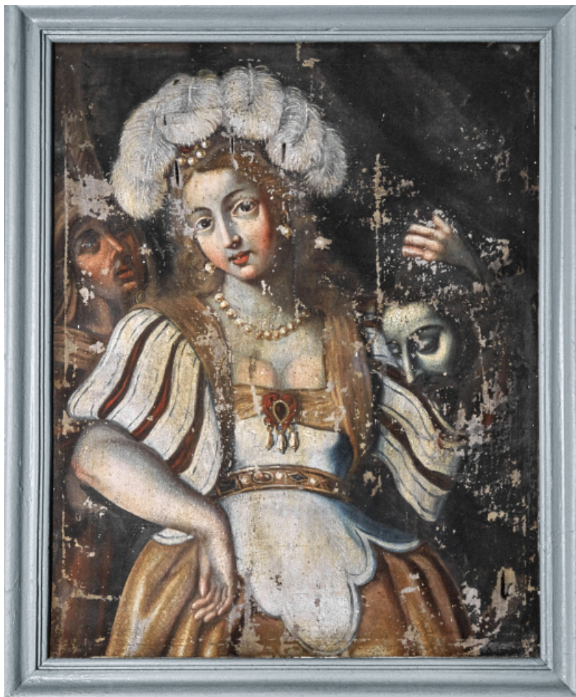
Tableau avant restauration (en 2004). 21, Châteauneuf