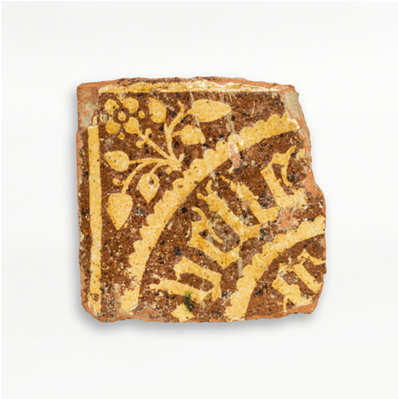
Carreaux de pavement, fragments archéologiques : détail.