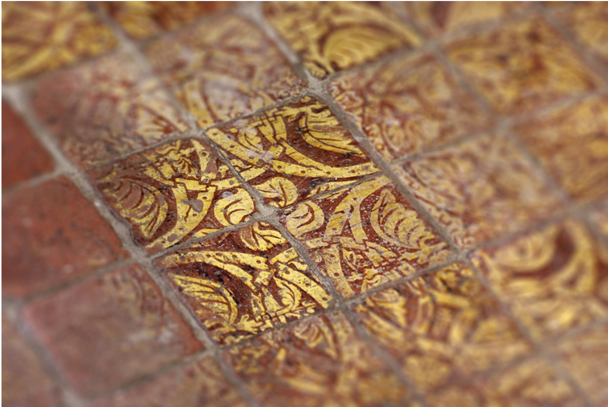
Carreaux de pavement de la chapelle : détail. 21, Châteauneuf