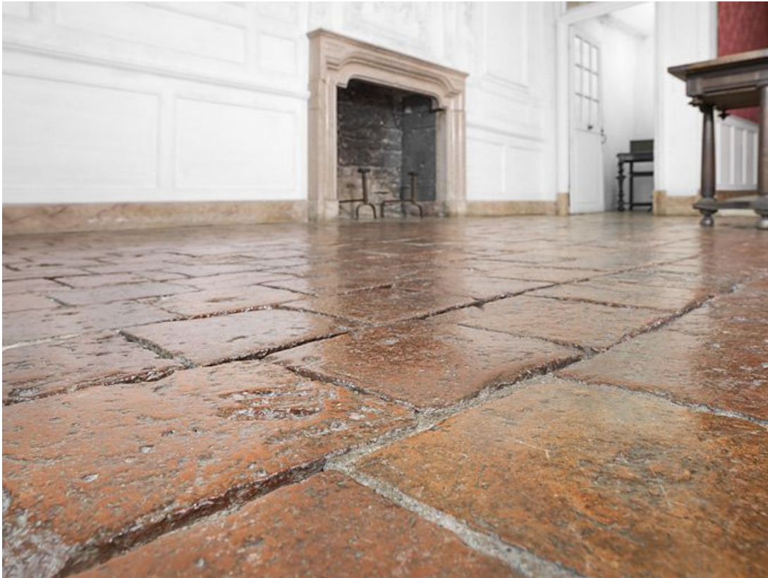
Carreaux de pavement de la chambre de Vienne : détail.