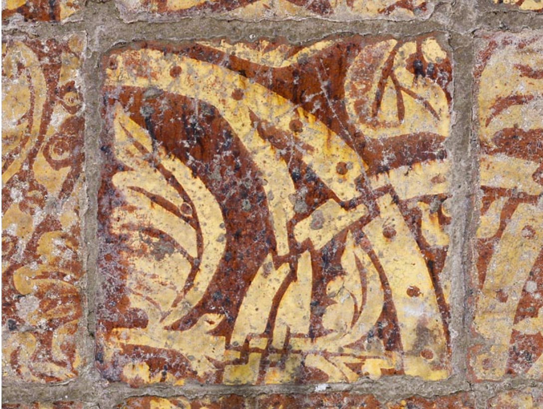
Carreaux de pavement de la chapelle : détail.