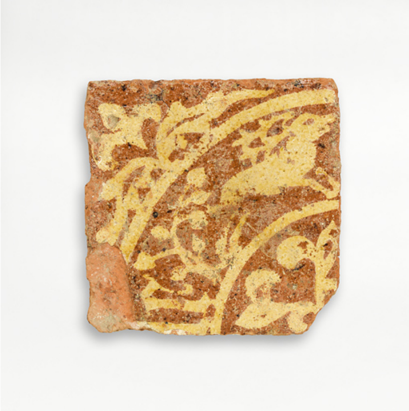
Carreaux de pavement, fragments archéologiques : détail.