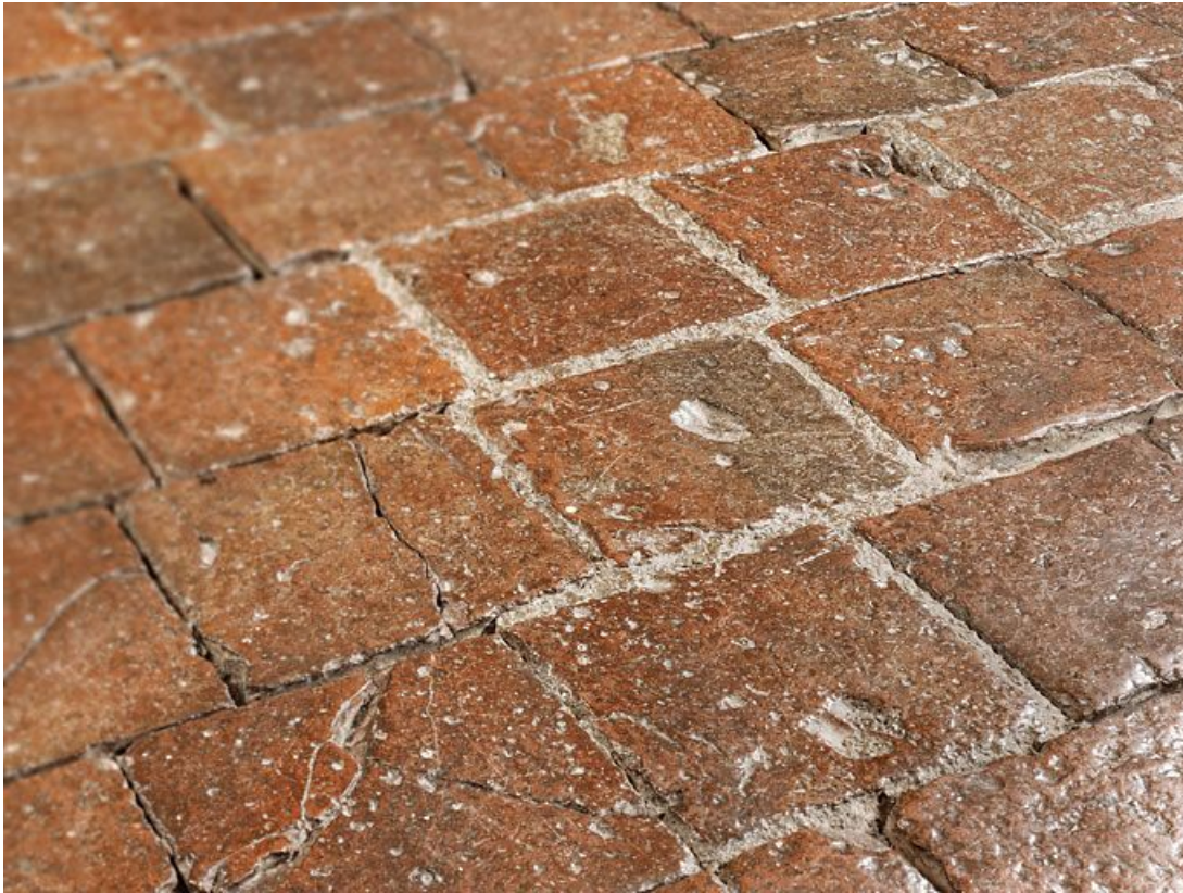
Carreaux de pavement de la chambre de Vienne : détail.