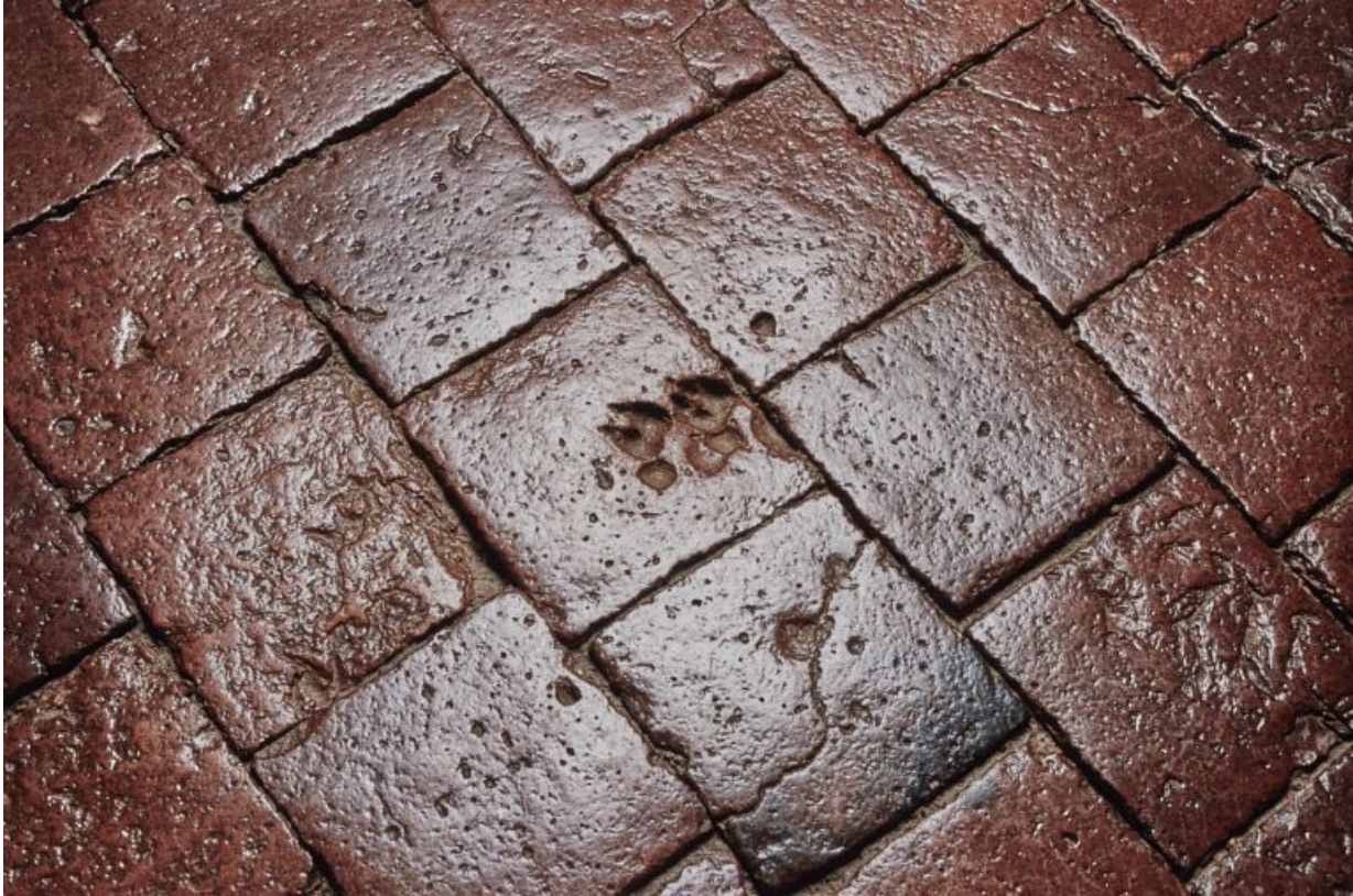
Traces de pattes d'animaux au sol de la chambre de Vienne. 21, Châteauneuf