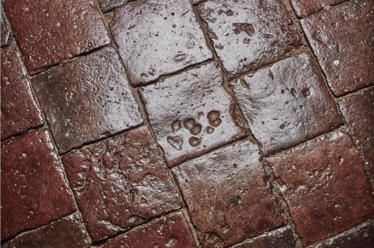
Traces de pattes d'animaux au sol de la chambre de Vienne. 21, Châteauneuf