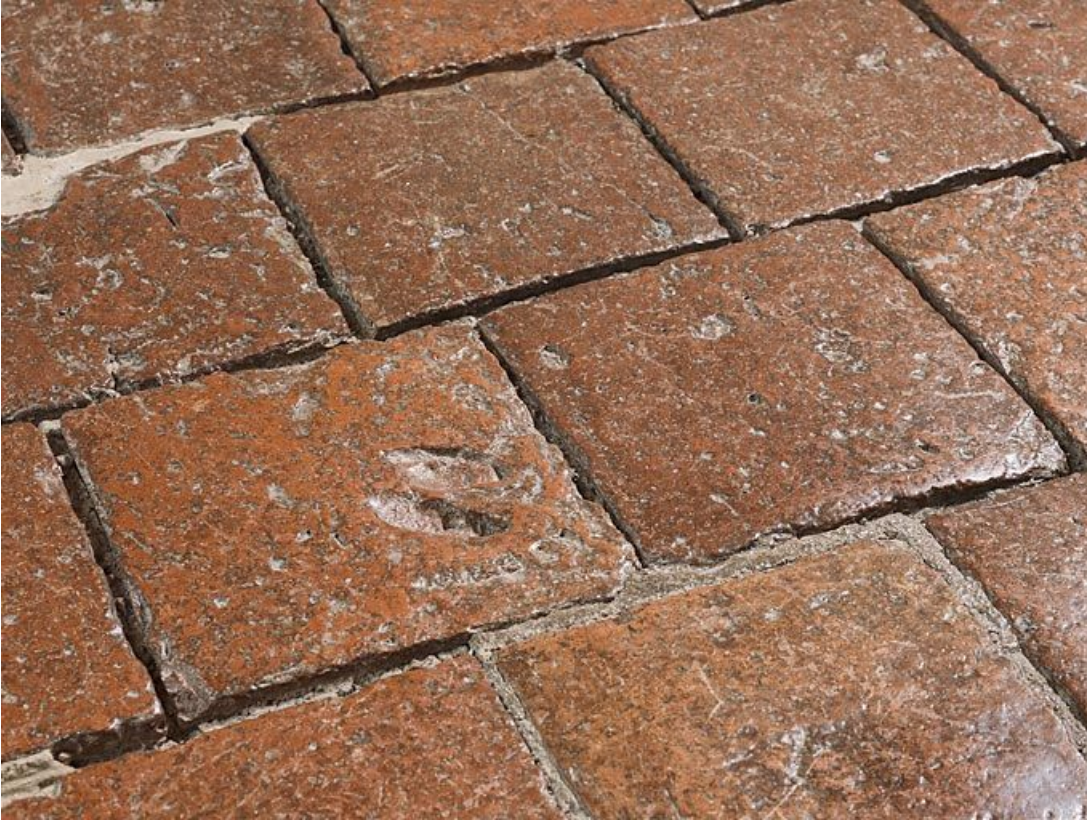
Carreaux de pavement de la chambre de Vienne : détail.