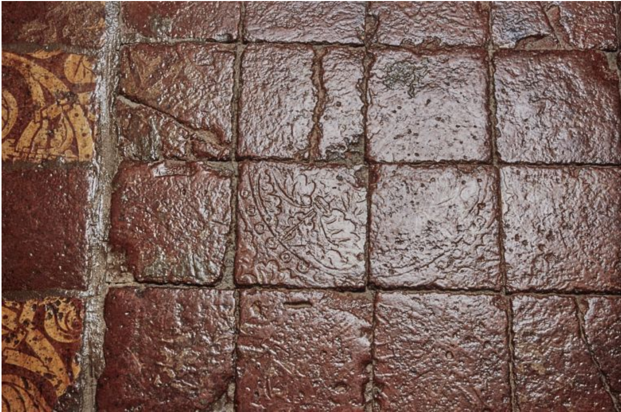
Carreaux de pavement dans l'appartement du 15e siècle. 21, Châteauneuf