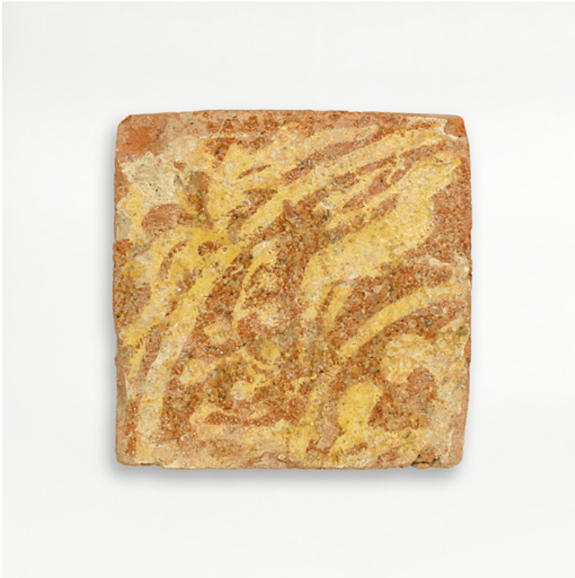
Carreaux de pavement, fragments archéologiques : détail.