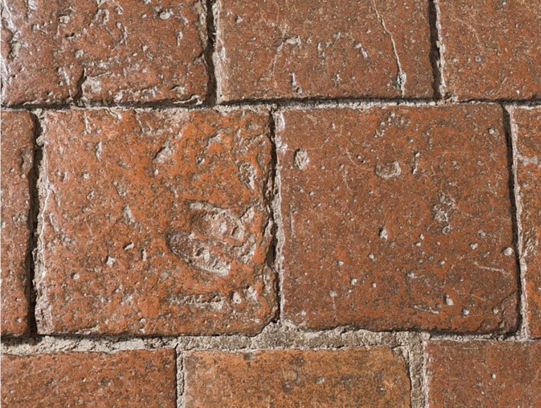
Carreaux de pavement de la chambre de Vienne : détail.