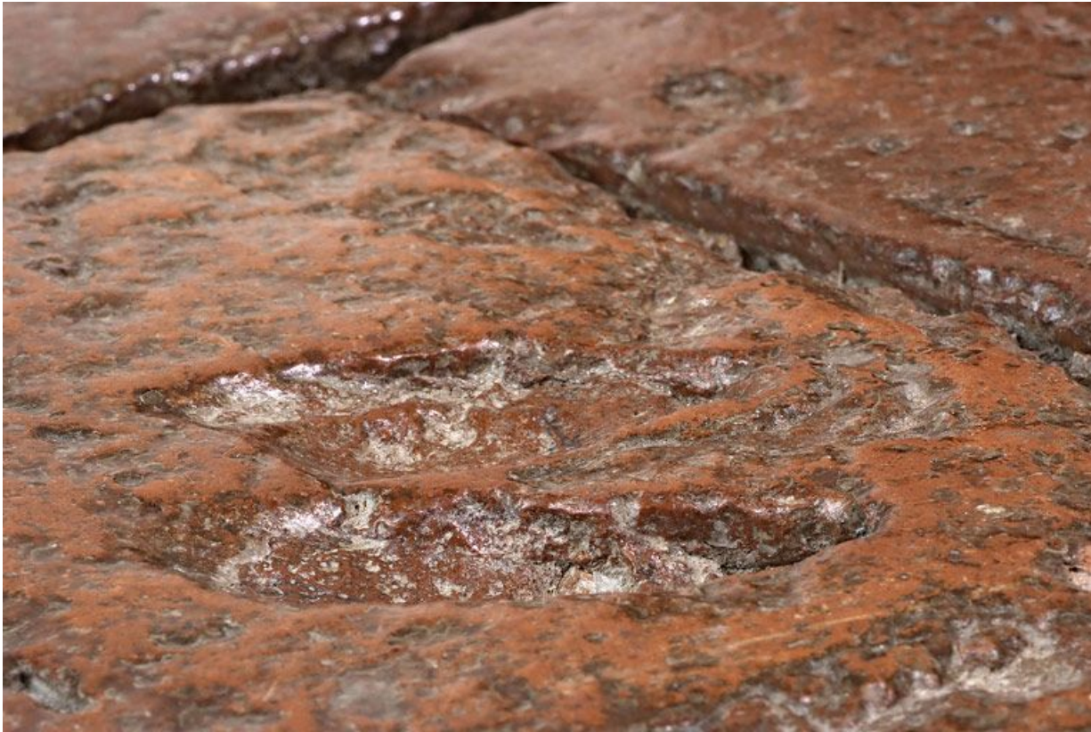
Carreaux de pavement de la chambre de Vienne : détail.