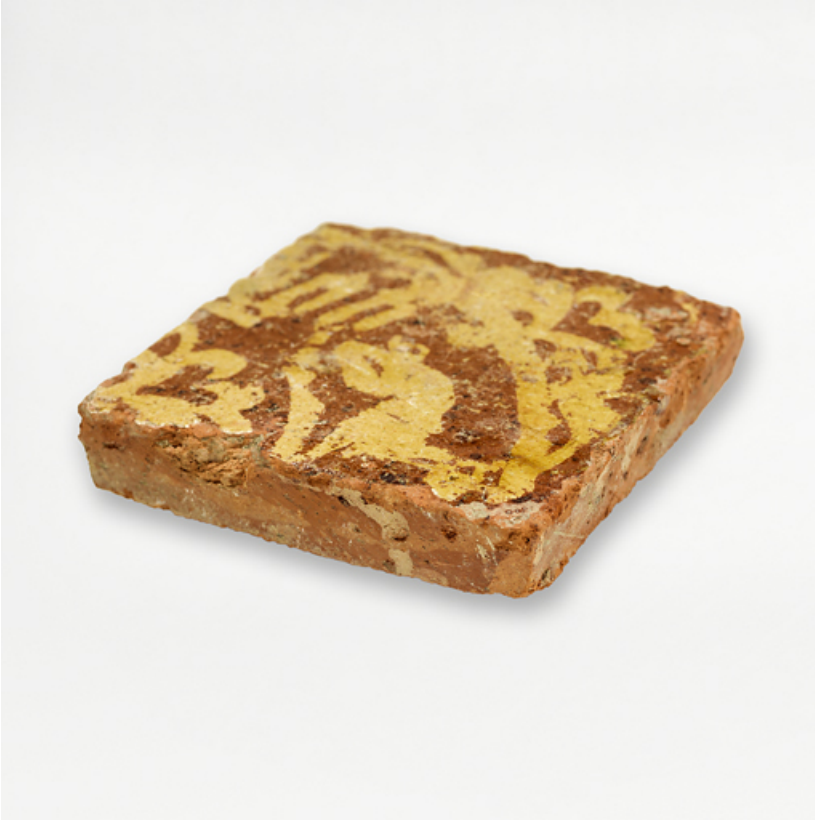
Carreaux de pavement, fragments archéologiques : détail.