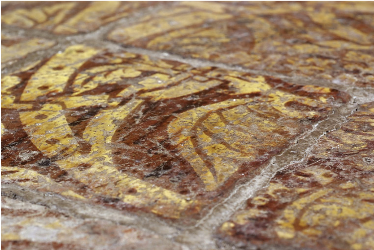
Carreaux de pavement de la chapelle : détail. 21, Châteauneuf