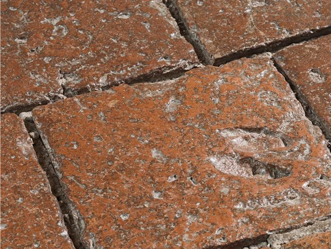
Carreaux de pavement de la chambre de Vienne : détail.