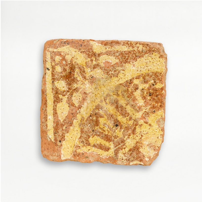
Carreaux de pavement, fragments archéologiques : détail.