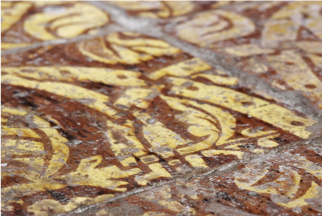
Carreaux de pavement de la chapelle : détail.