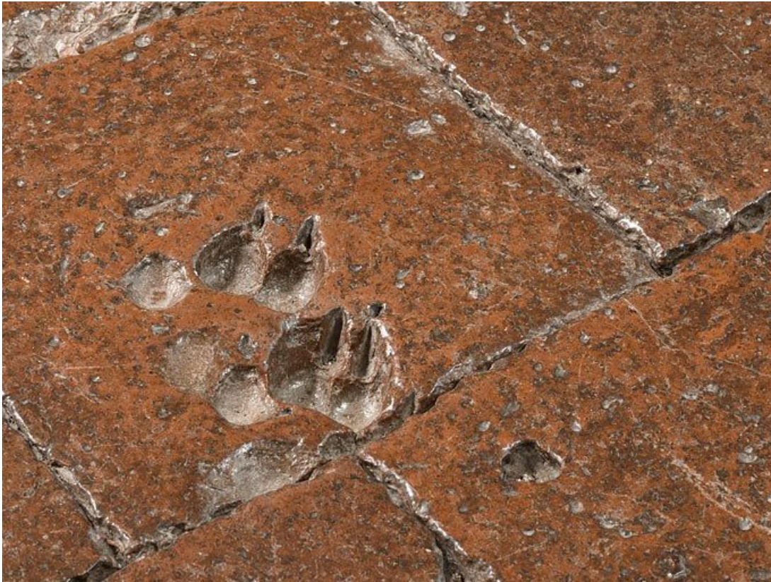
Carreaux de pavement de la chambre de Vienne : détail.