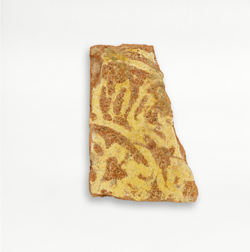
Carreaux de pavement, fragments archéologiques : détail.