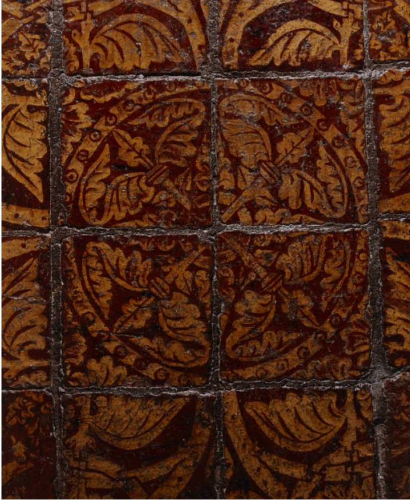
Décor complet de 4 carreaux de pavement, au sol du château. 21, Châteauneuf