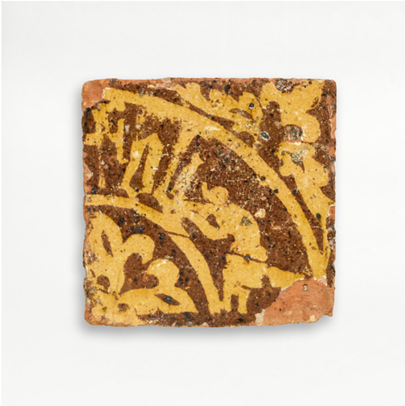
Carreaux de pavement, fragments archéologiques : détail.