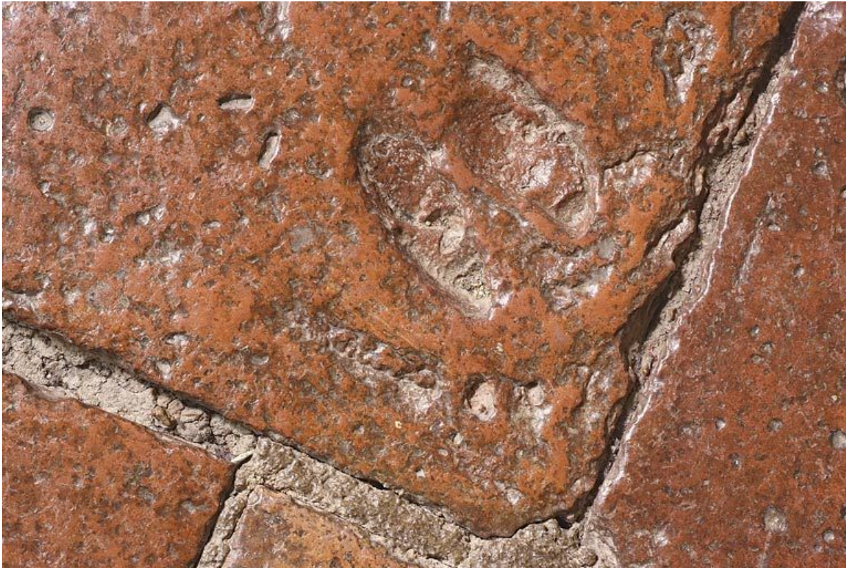
Carreaux de pavement de la chambre de Vienne : détail.