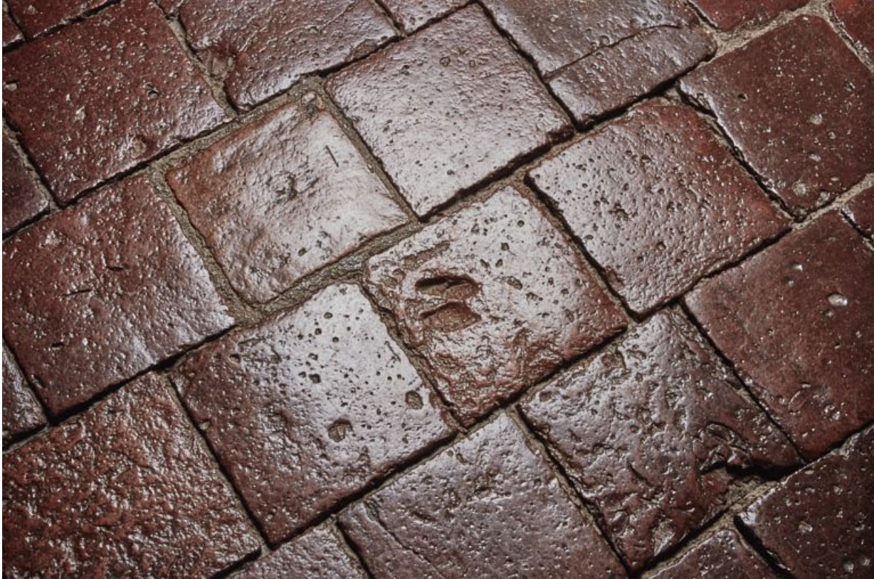
Traces de pattes d'animaux au sol de la chambre de Vienne. 21, Châteauneuf