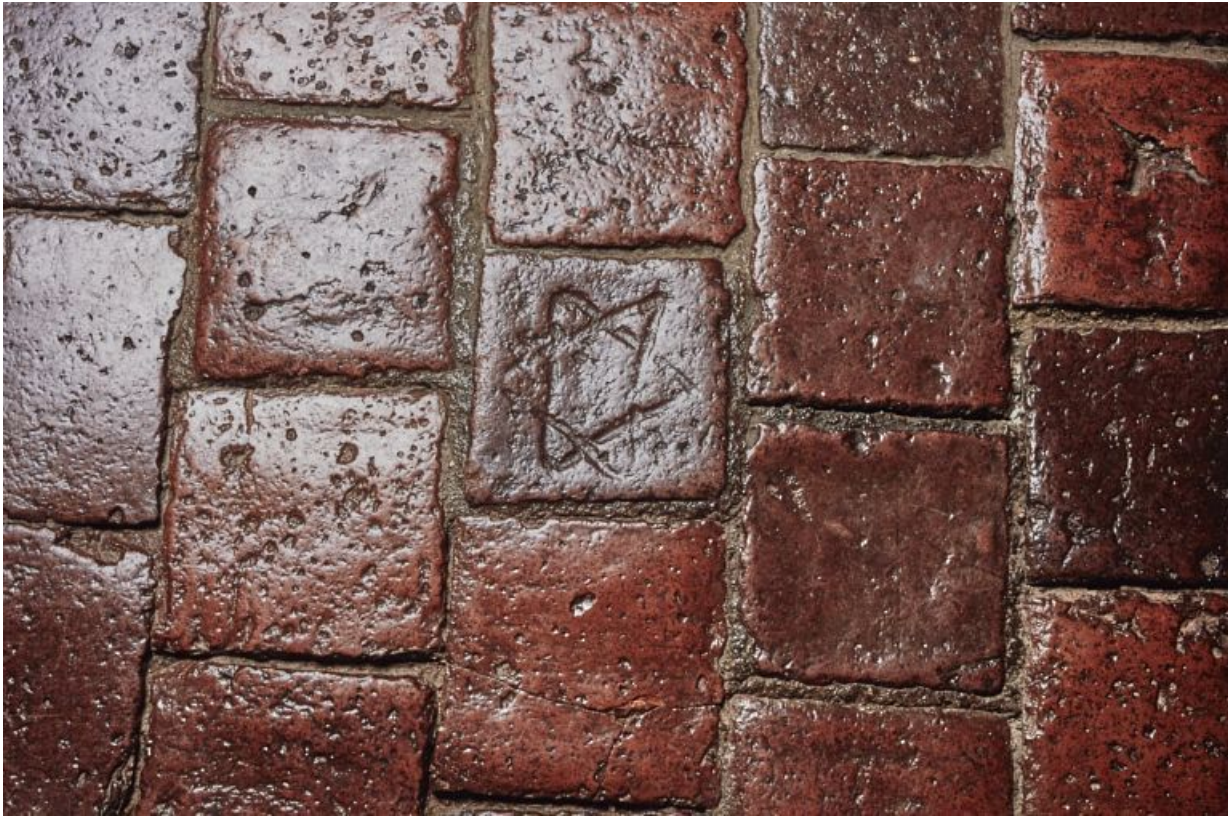
Etoile gravée sur un carreau de la chambre de Vienne. 21, Châteauneuf