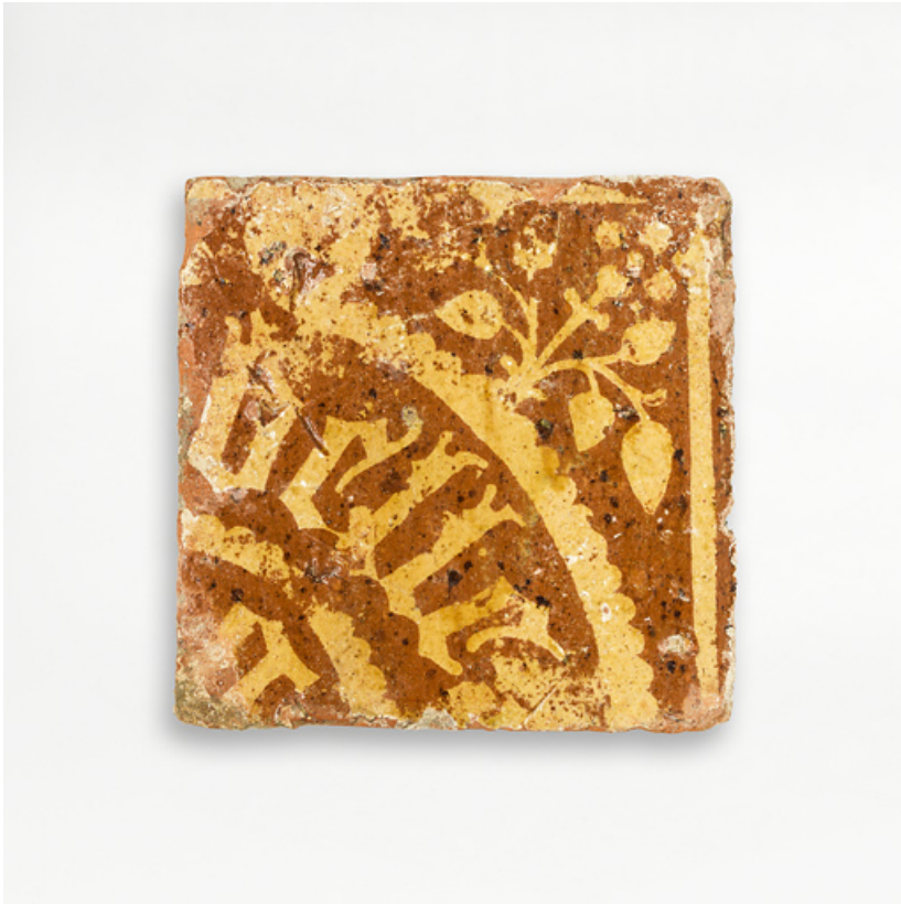
Carreaux de pavement, fragments archéologiques : détail.