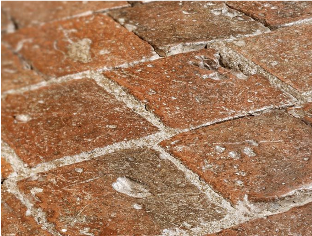
Carreaux de pavement de la chambre de Vienne : détail.