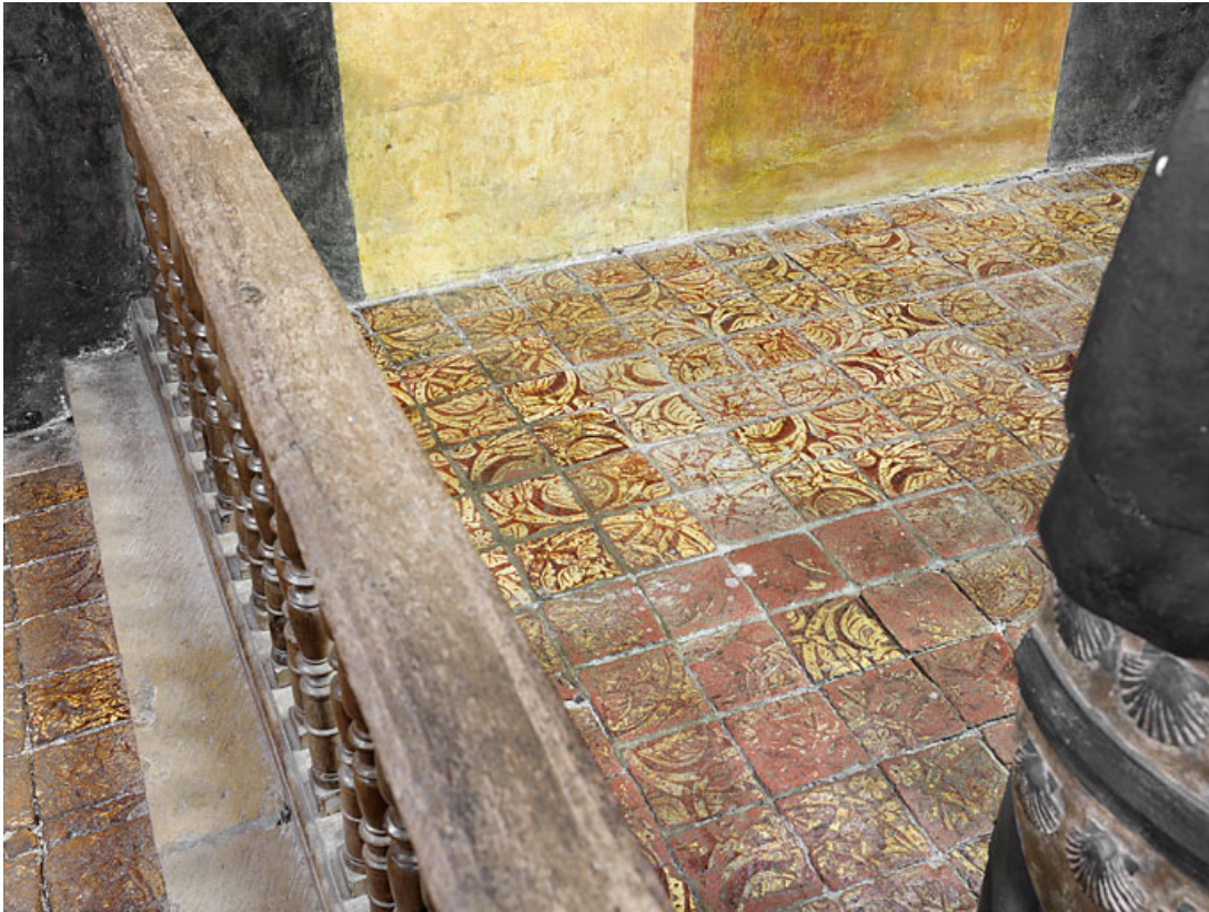
Vue d'ensemble des tapis de carreaux de pavement de la chapelle. 21, Châteauneuf