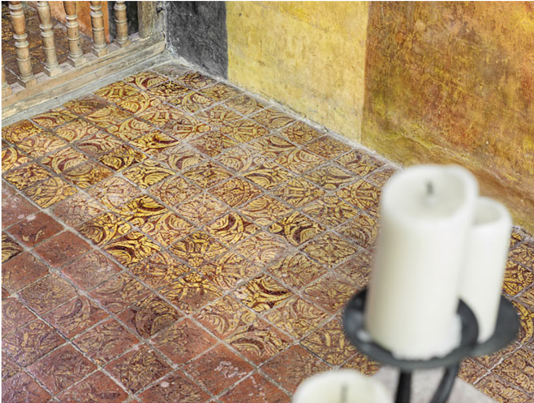
Vue d'ensemble des tapis de sol de carreaux de la chapelle. 21, Châteauneuf