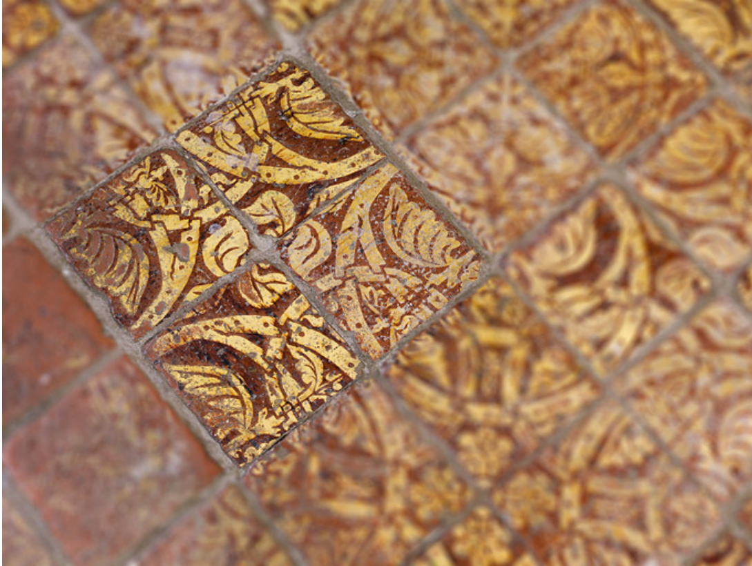
Carreaux de pavement de la chapelle : détail. 21, Châteauneuf