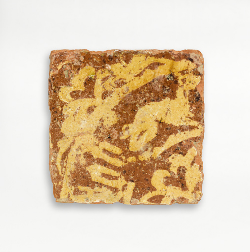
Carreaux de pavement, fragments archéologiques : détail.