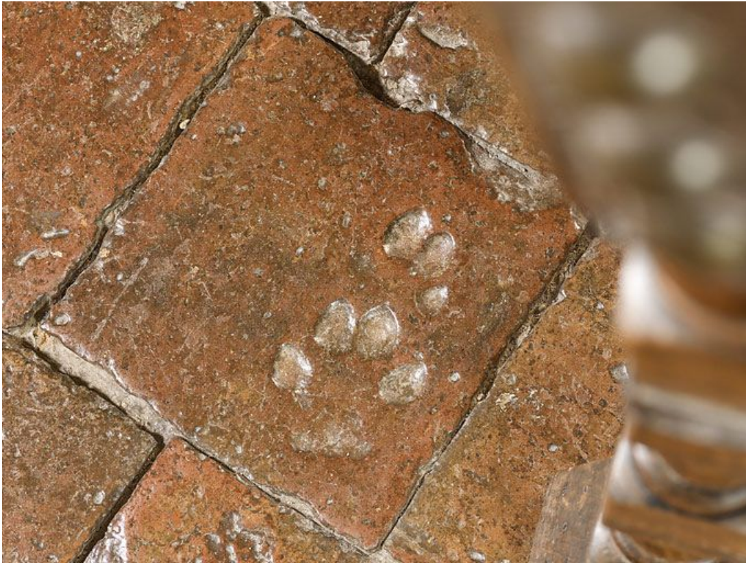
Carreaux de pavement de la chambre de Vienne : détail. 21, Châteauneuf