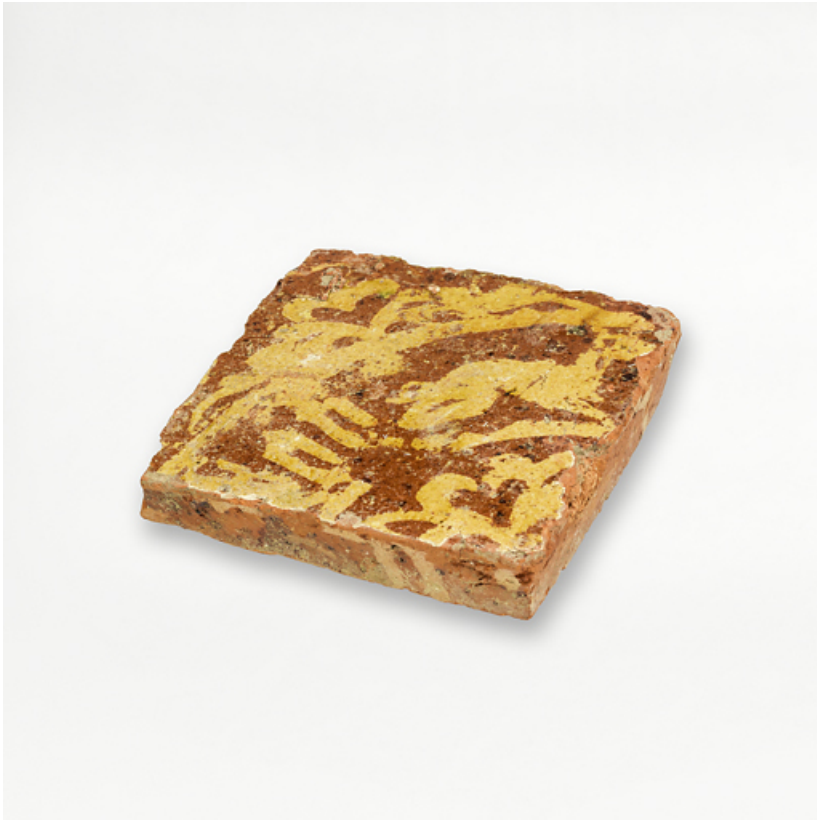
Carreaux de pavement, fragments archéologiques : détail.