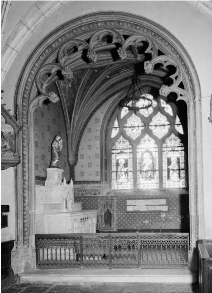
Chapelle antérieure droite (peintures murales).