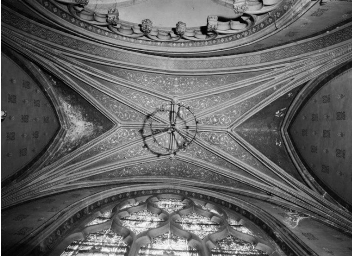
Voûte de la chapelle antérieure droite (peintures murales).