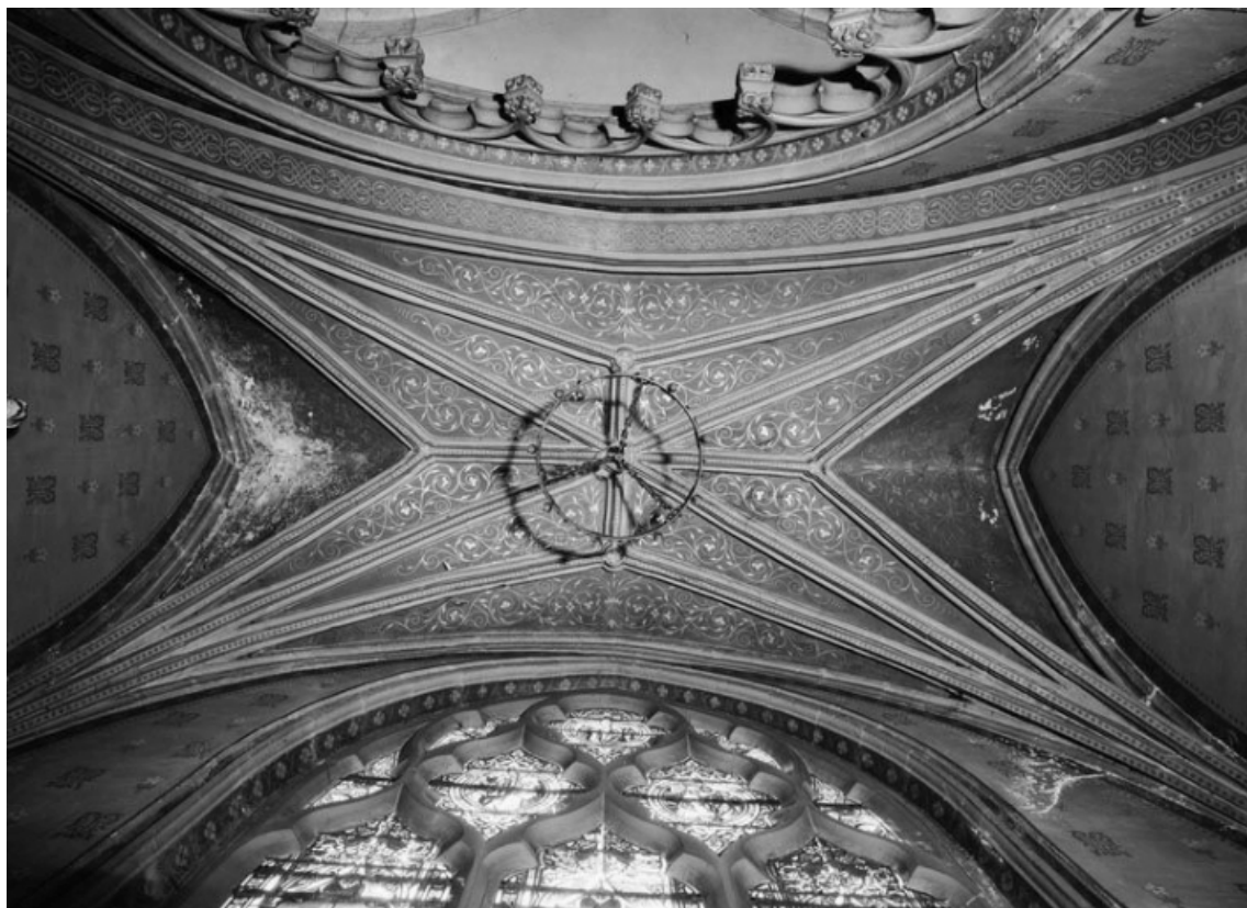
Voûte de la chapelle antérieure droite (peintures murales). 21, Nolay