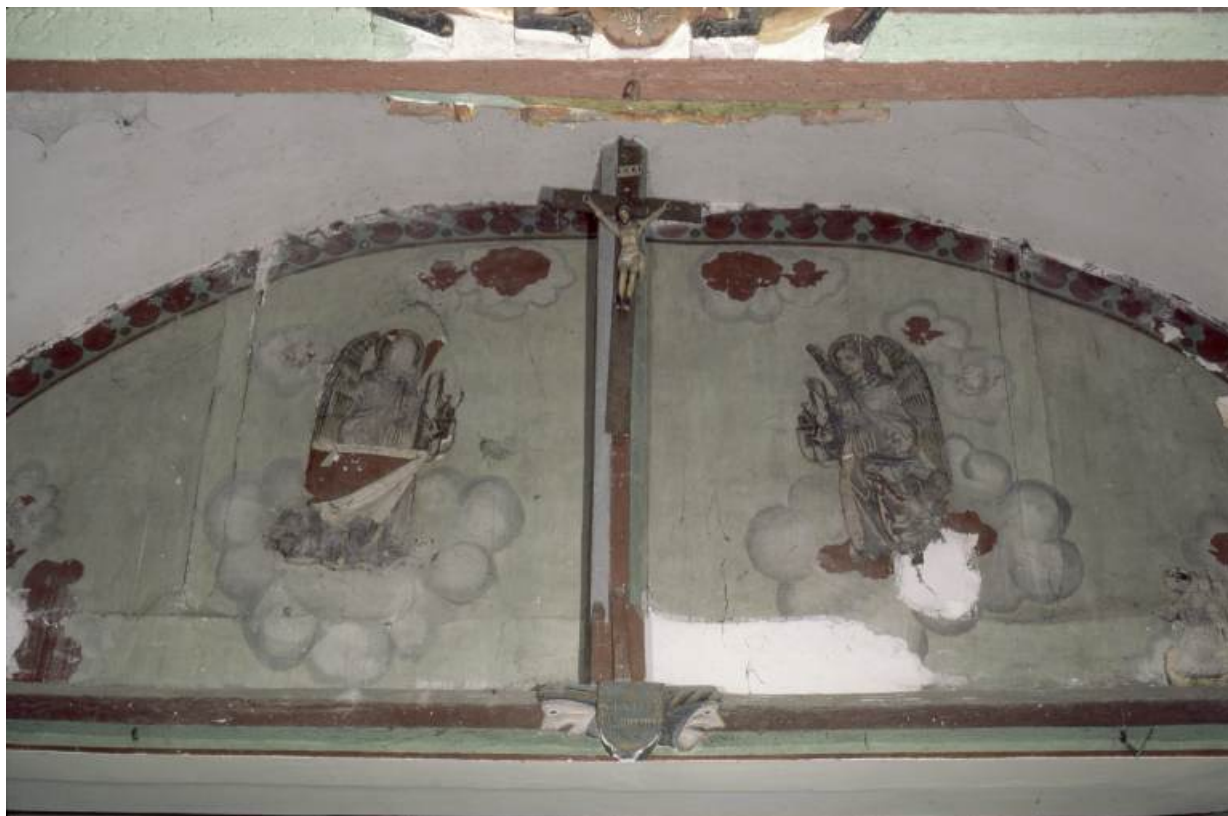
Deux anges thuriféraires de part et d'autre du Christ en croix de la poutre de gloire 21, Chivres