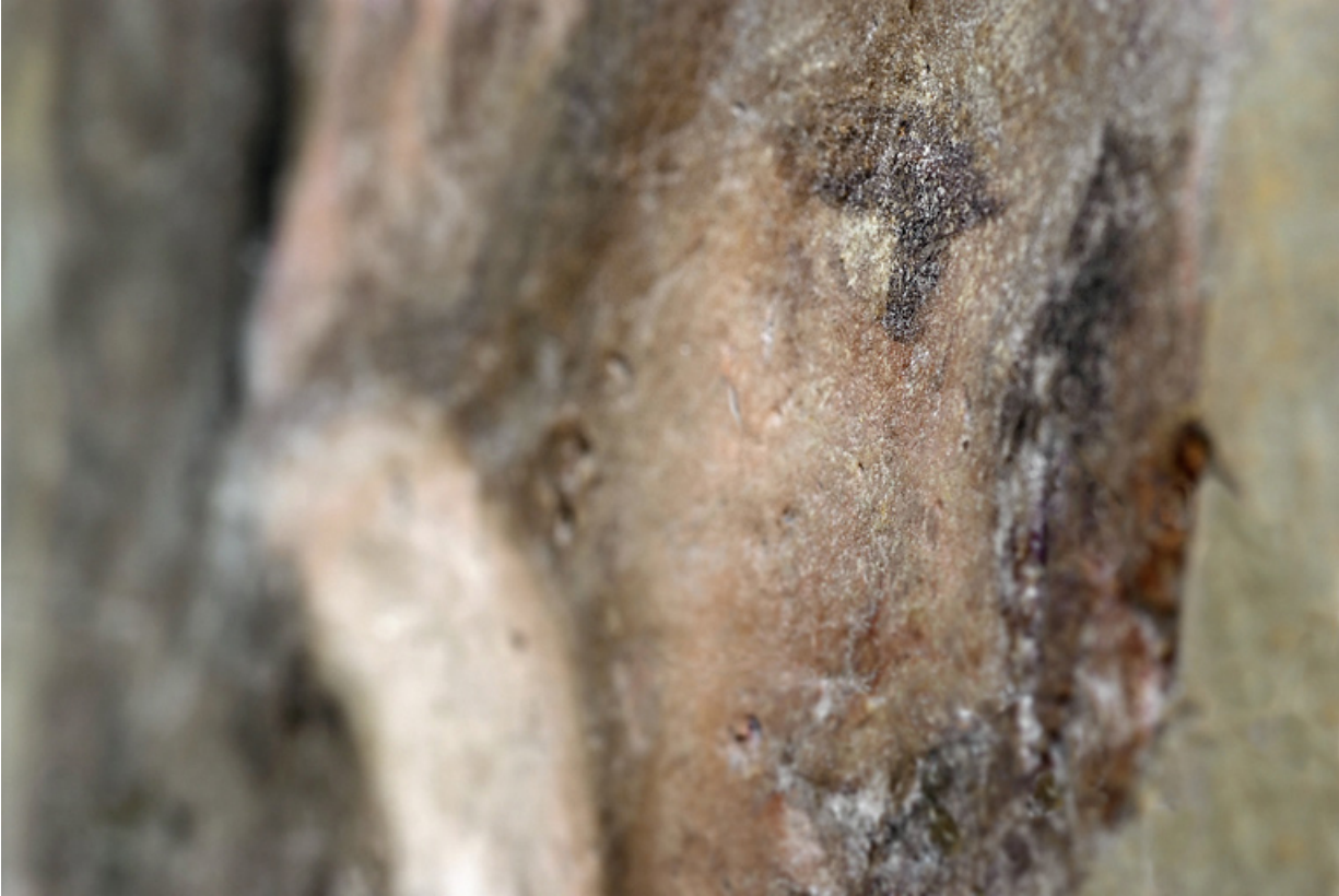
Peinture de l'embrasure de la porte : détail.