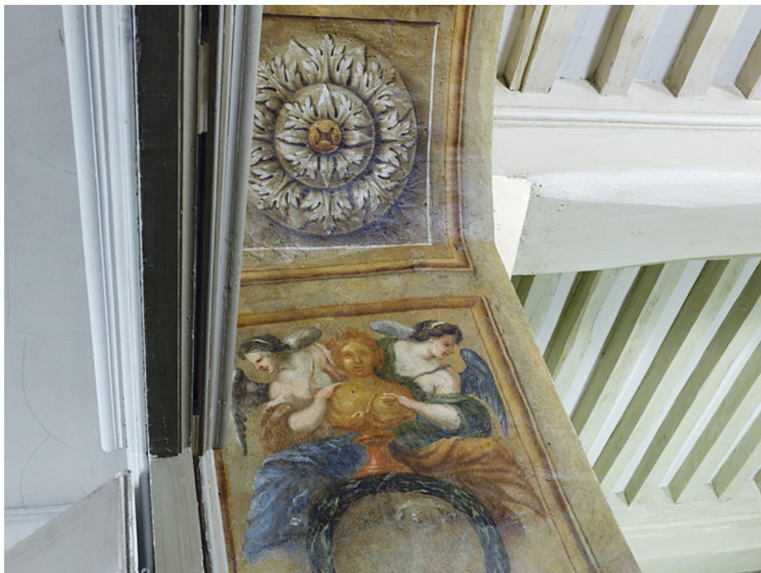
Peinture de l'embrasure de la porte : détail.