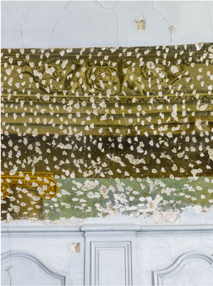
Peinture du petit salon : blason de Jeanne-Marguerite Bernard.