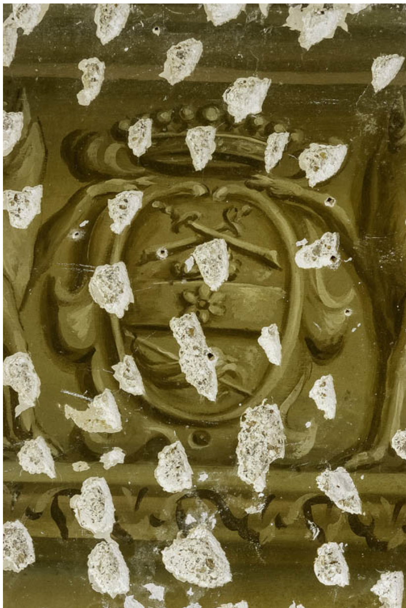
Peinture du petit salon : blason de Jeanne-Marguerite Bernard. 21, Châteauneuf château fort