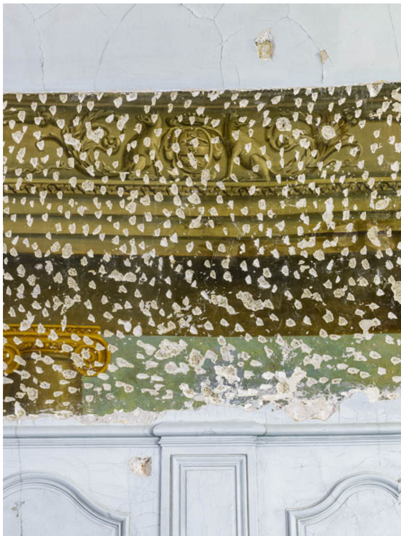
Peinture du petit salon : blason de Jeanne-Marguerite Bernard. 21, Châteauneuf château fort