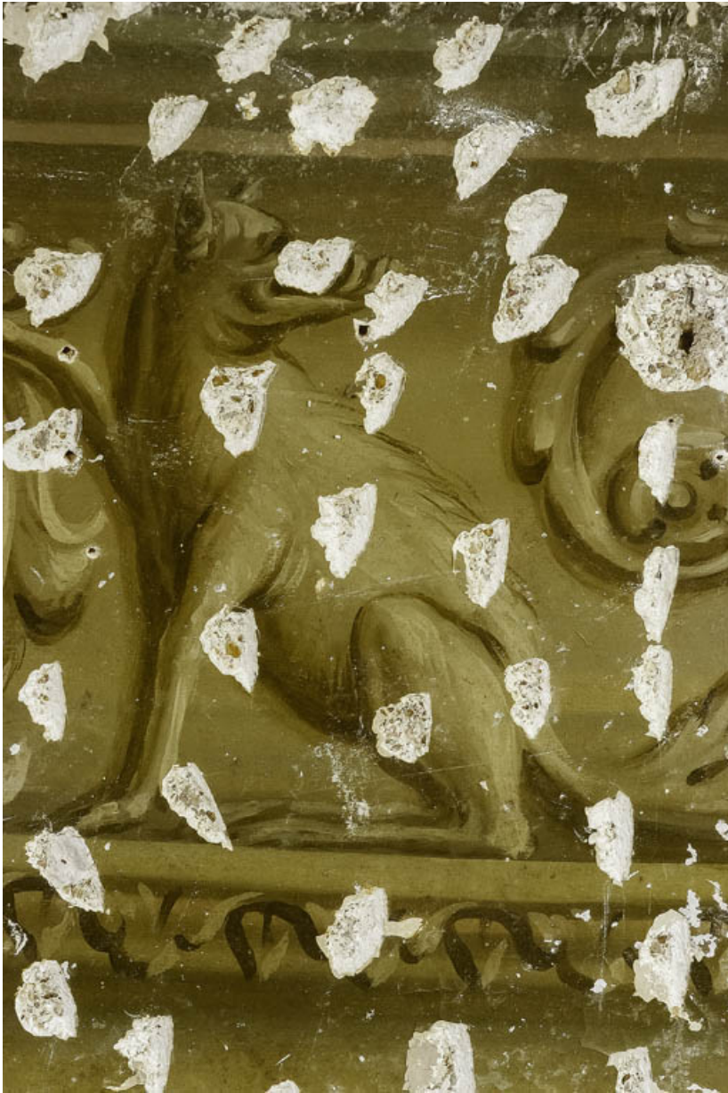
Peinture du petit salon : griffon.