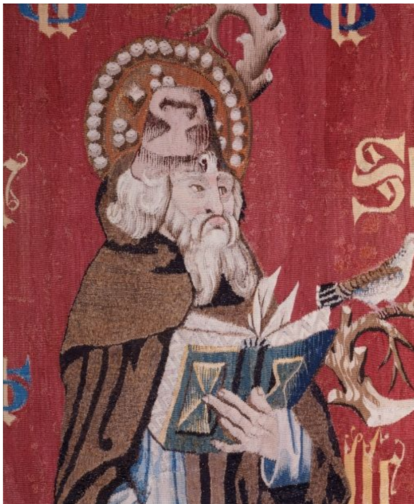
Saint Antoine n. 1, détail