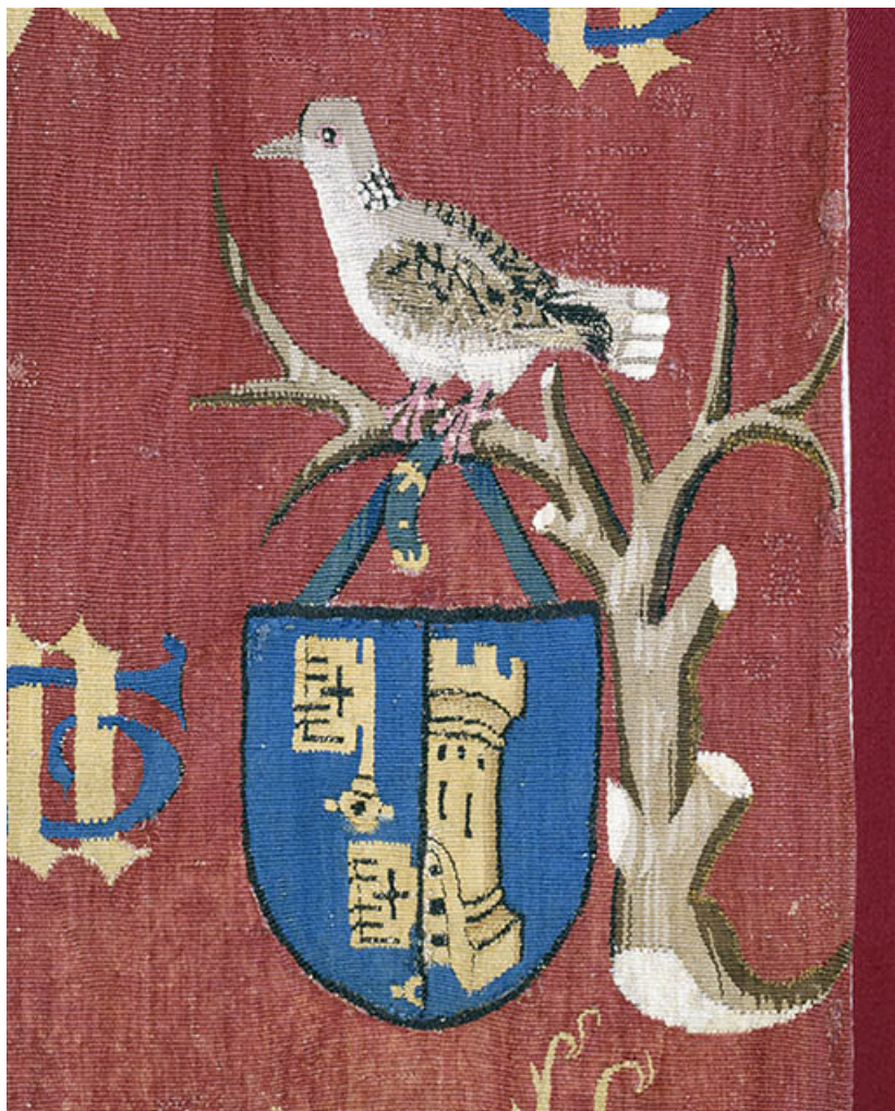
Saint Antoine n. 2, détail