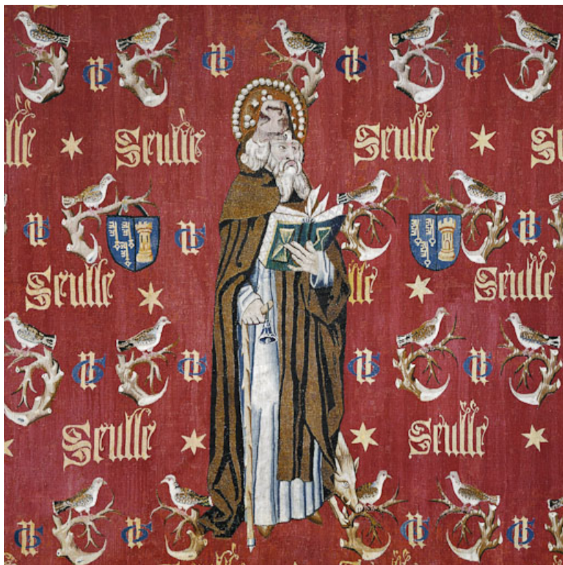
Saint Antoine n. 1