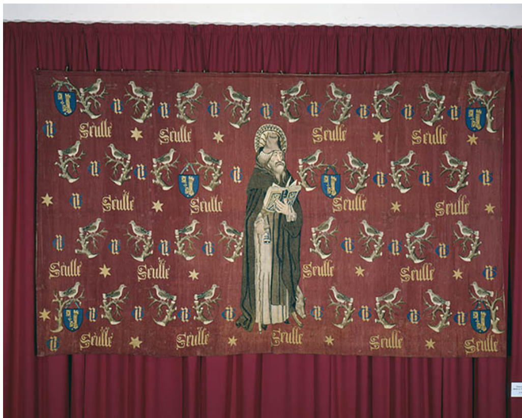
Saint Antoine n. 2