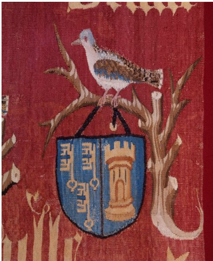
Saint Antoine n. 1, détail.