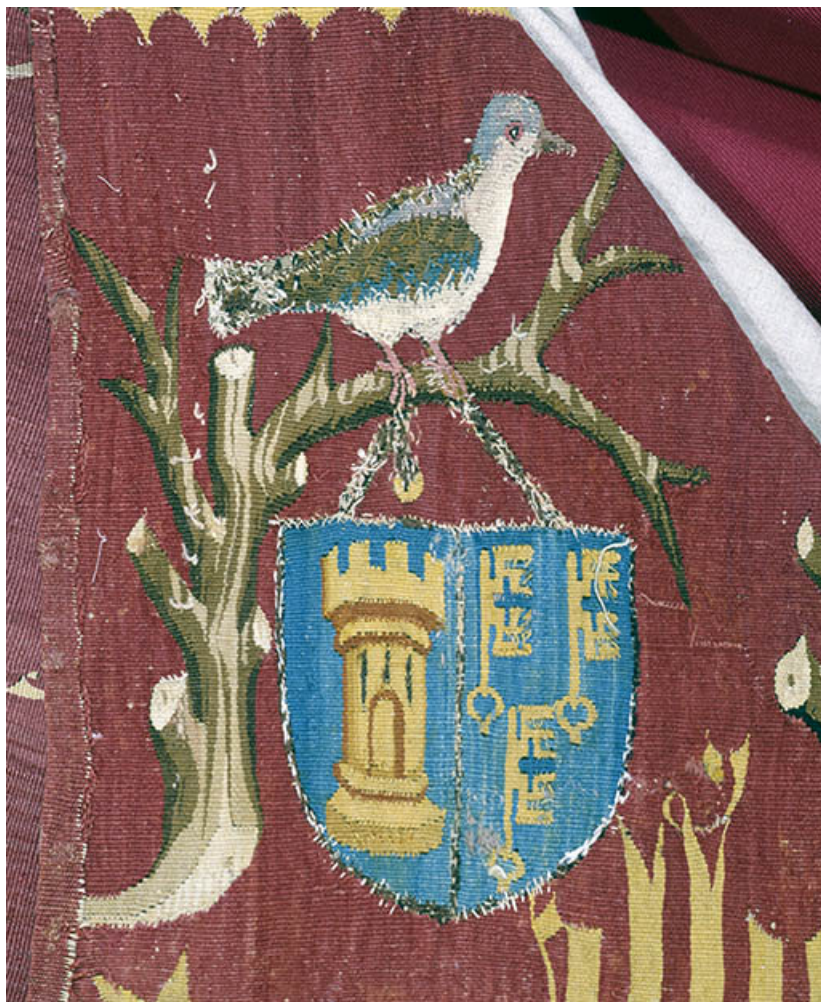
Saint Antoine n. 1, détail