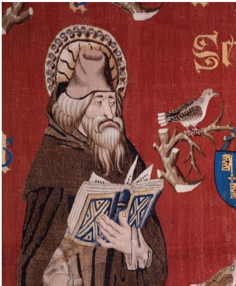
Saint Antoine n. 2, détail