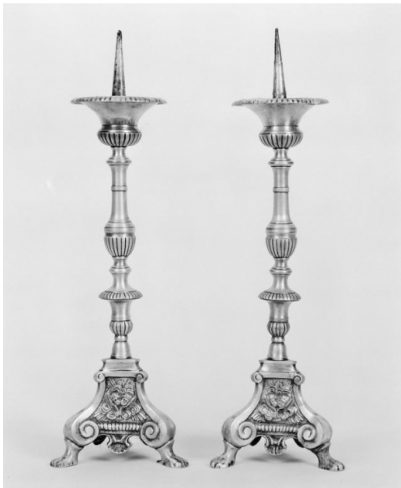
Paire de chandeliers.