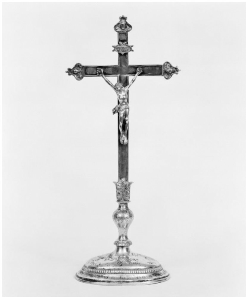
Croix d'autel 2, vue de face.