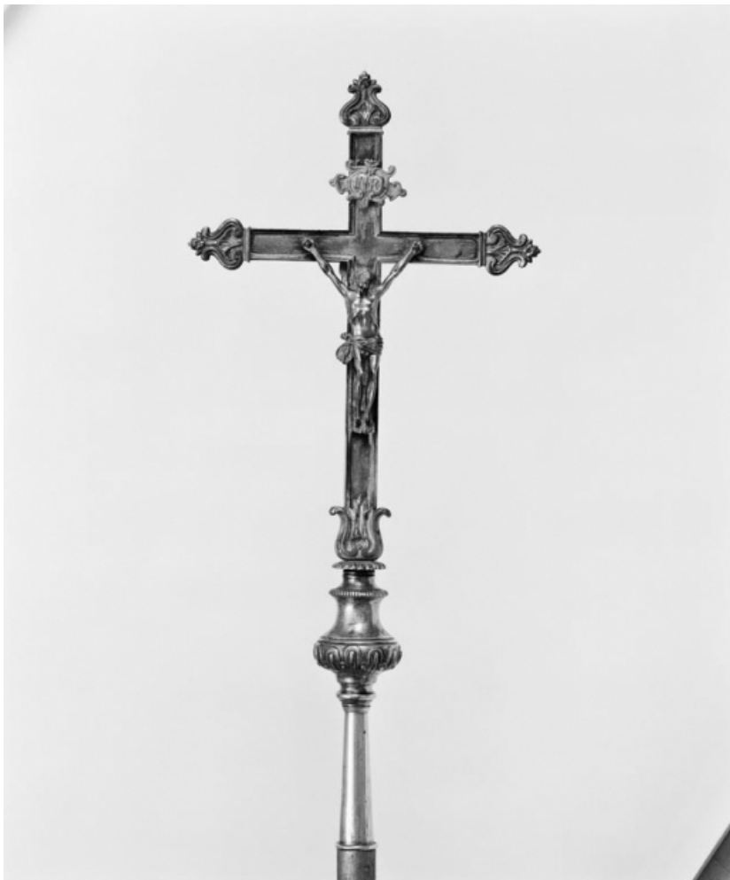
Croix de procession 1, vue de face.