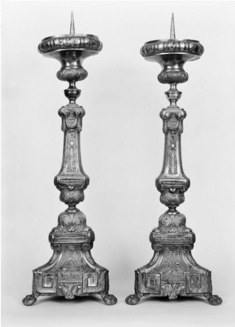
Vue de deux chandeliers.