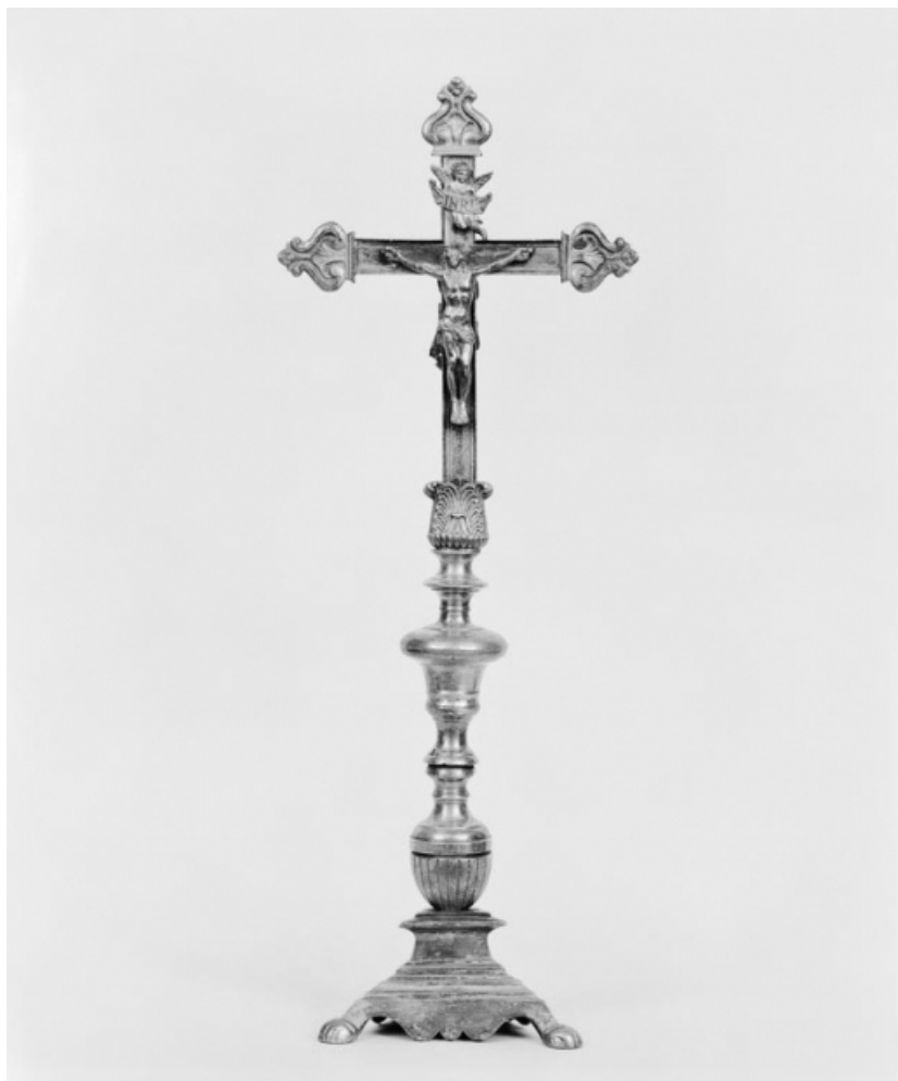
Croix d'autel 1, vue de face.