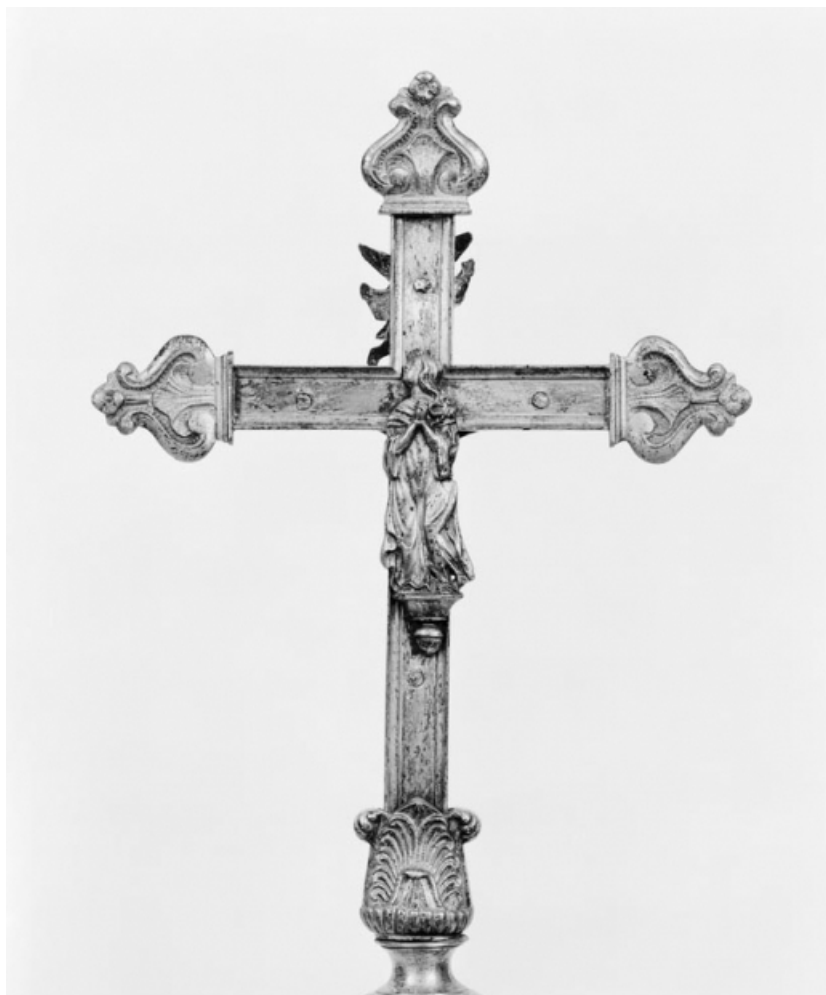
Croix d'autel 1, vue du revers.