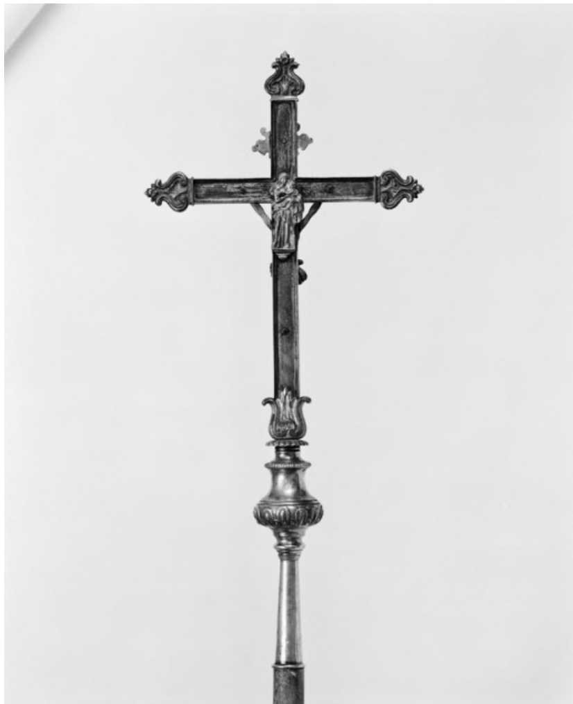
Croix de procession 1, vue du revers.