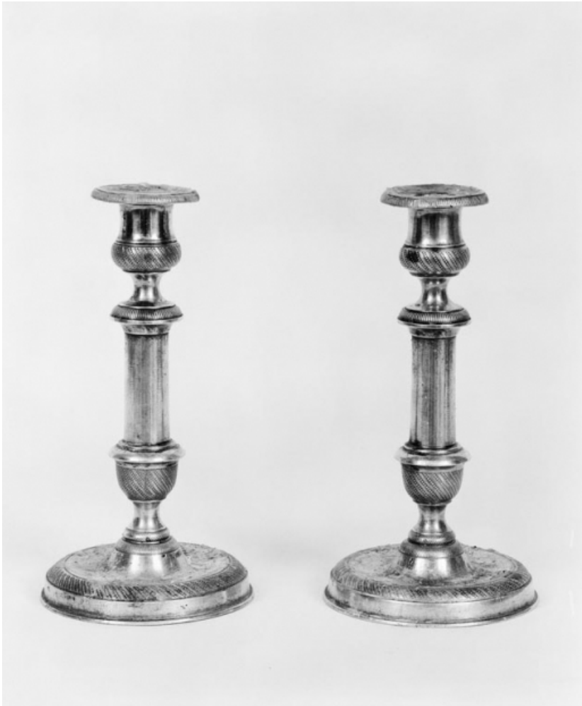
Paire de bougeoirs.