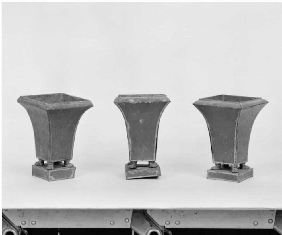
Ensemble de trois cache-pots.