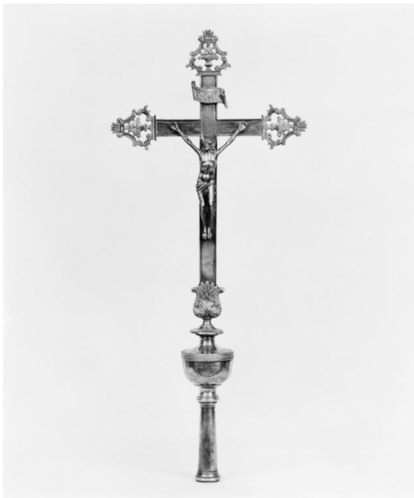
Croix de procession 2, vue d'ensemble.