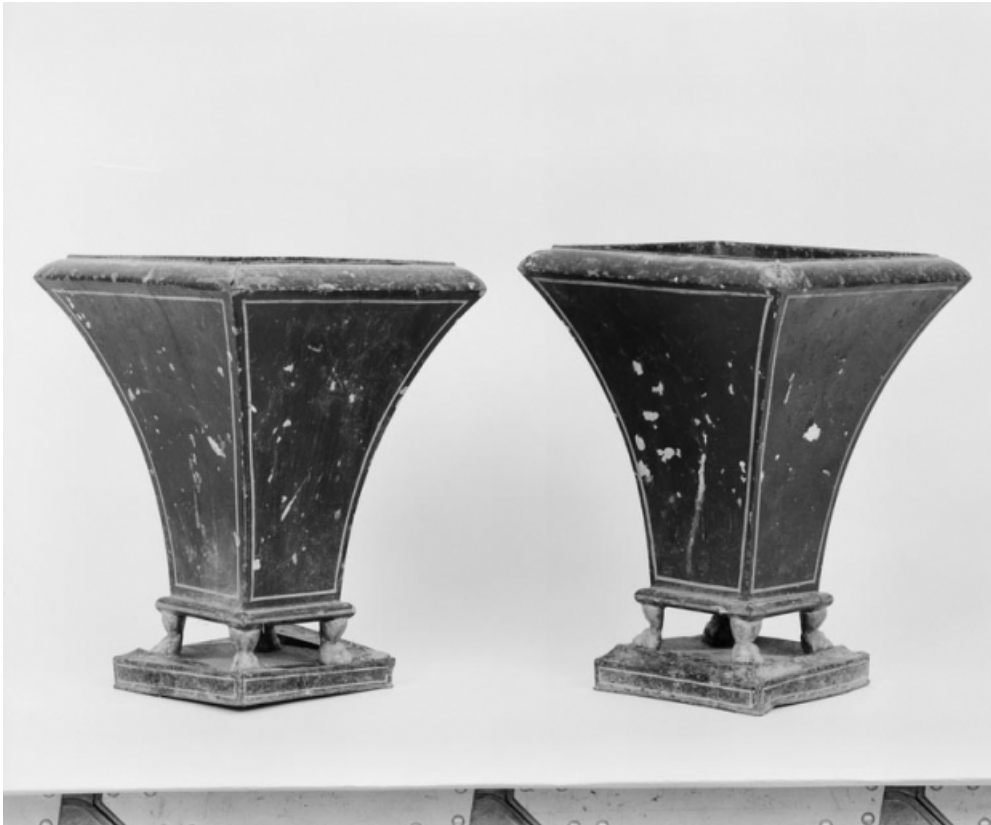
Paire de cache-pots.