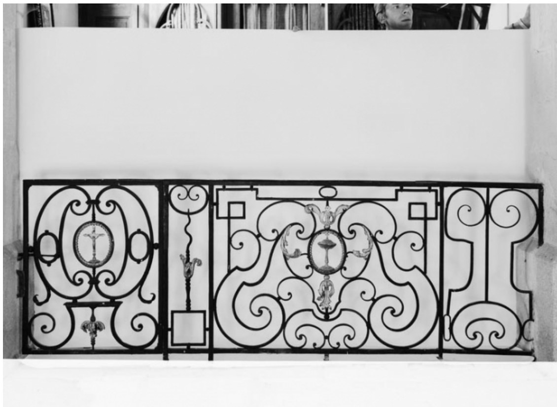
Détail du panneau principal.