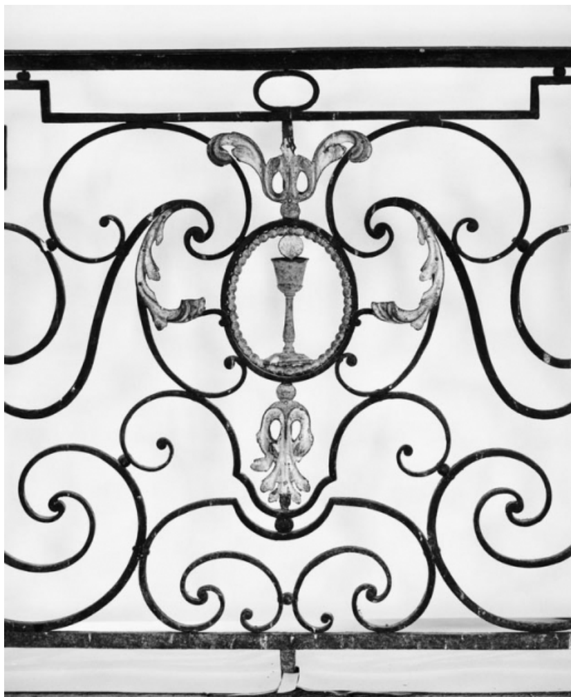
Détail du panneau principal.