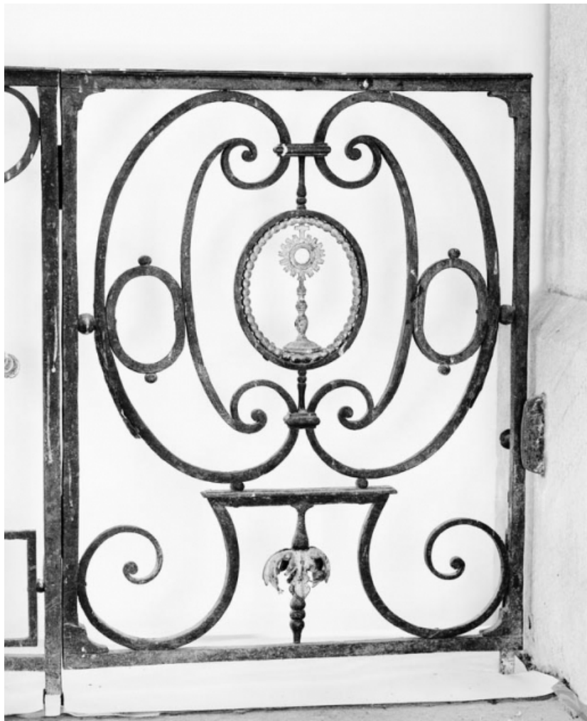
Détail du portillon.