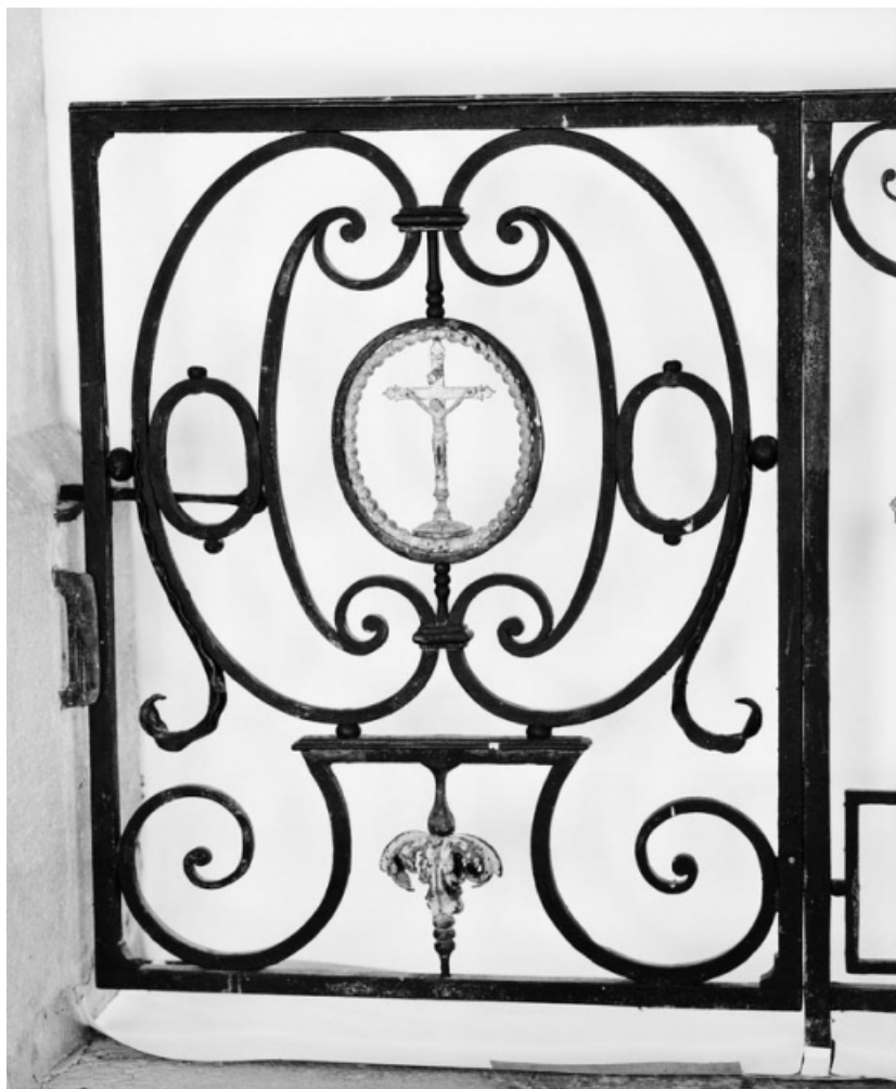
Détail du portillon.