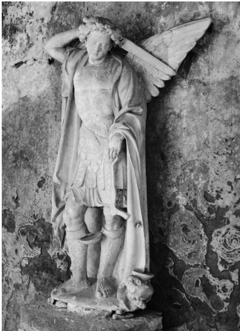
Vue de trois quarts gauche.