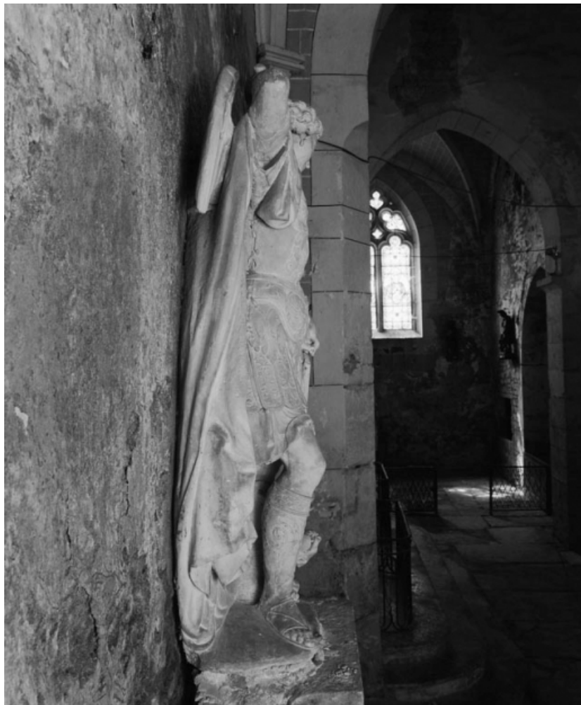
Vue de profil droit.