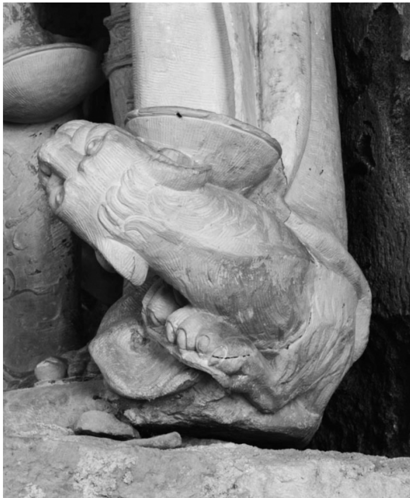
Détail du démon.