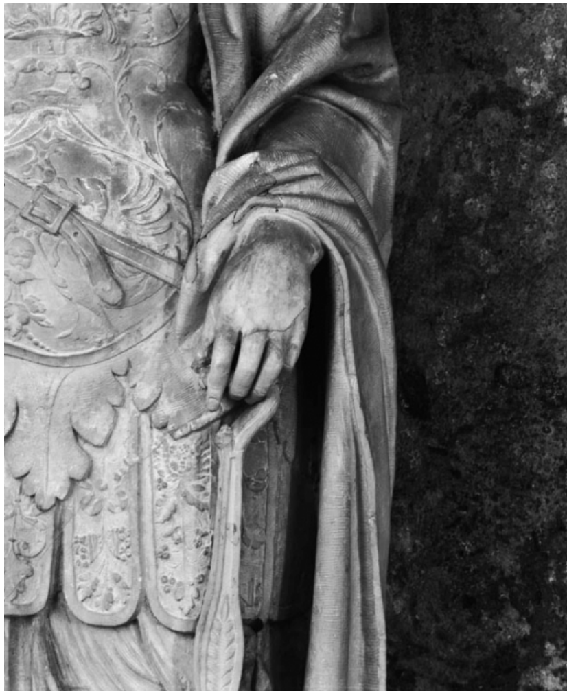
Détail de la main gauche.