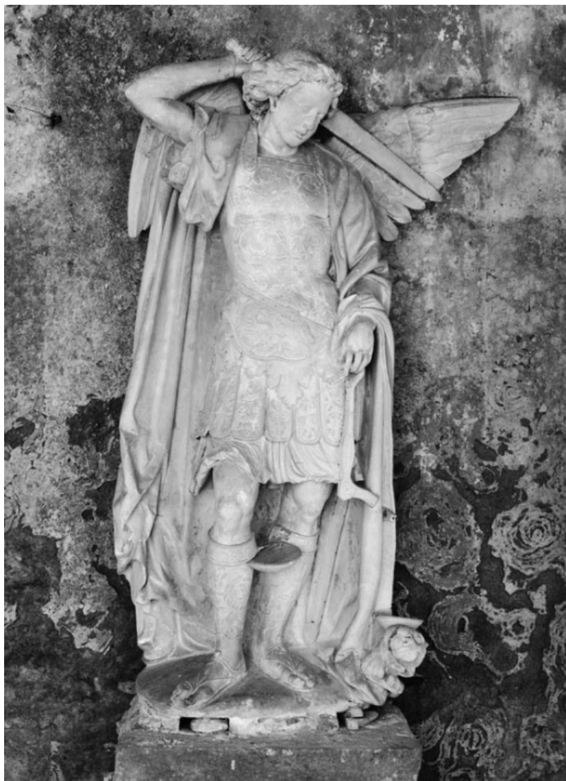
Vue de face.