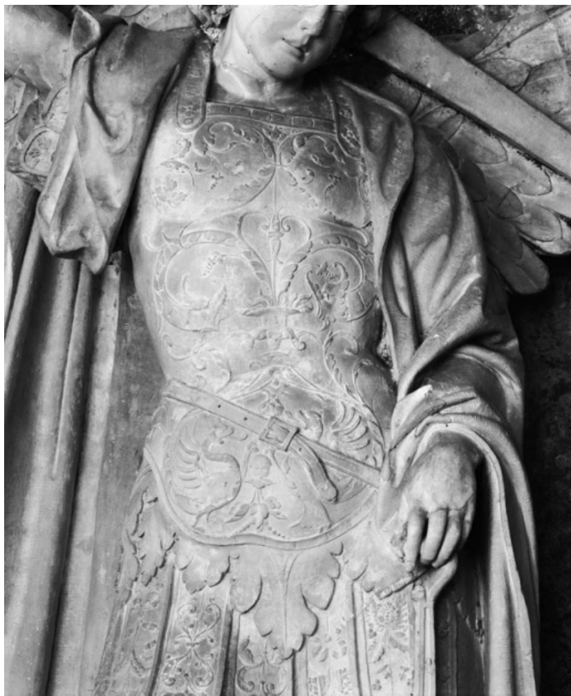
Détail de la cuirasse.