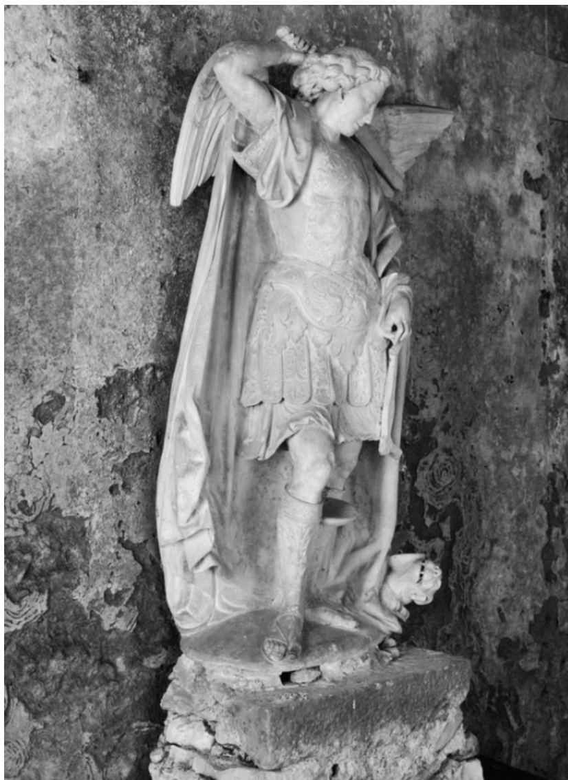
Vue de trois quarts droit.