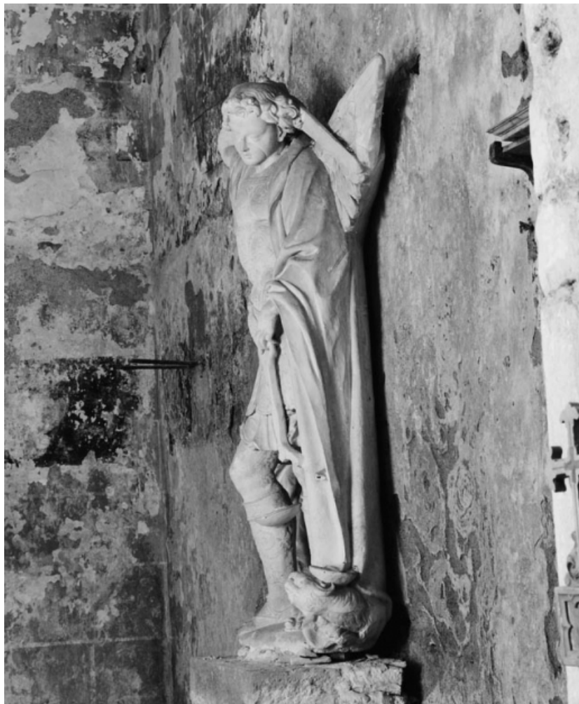
Vue de profil gauche.