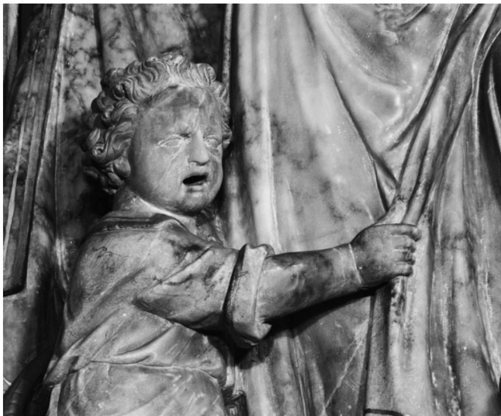
Détail du jeune garçon.