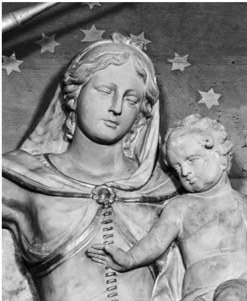
Détail des bustes de la Vierge et de l'Enfant.