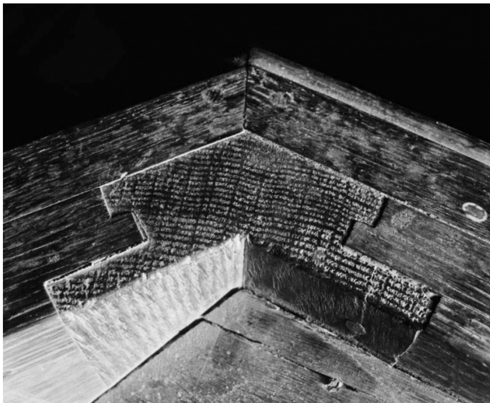
Détail de l'assemblage du bâti de la cuve.