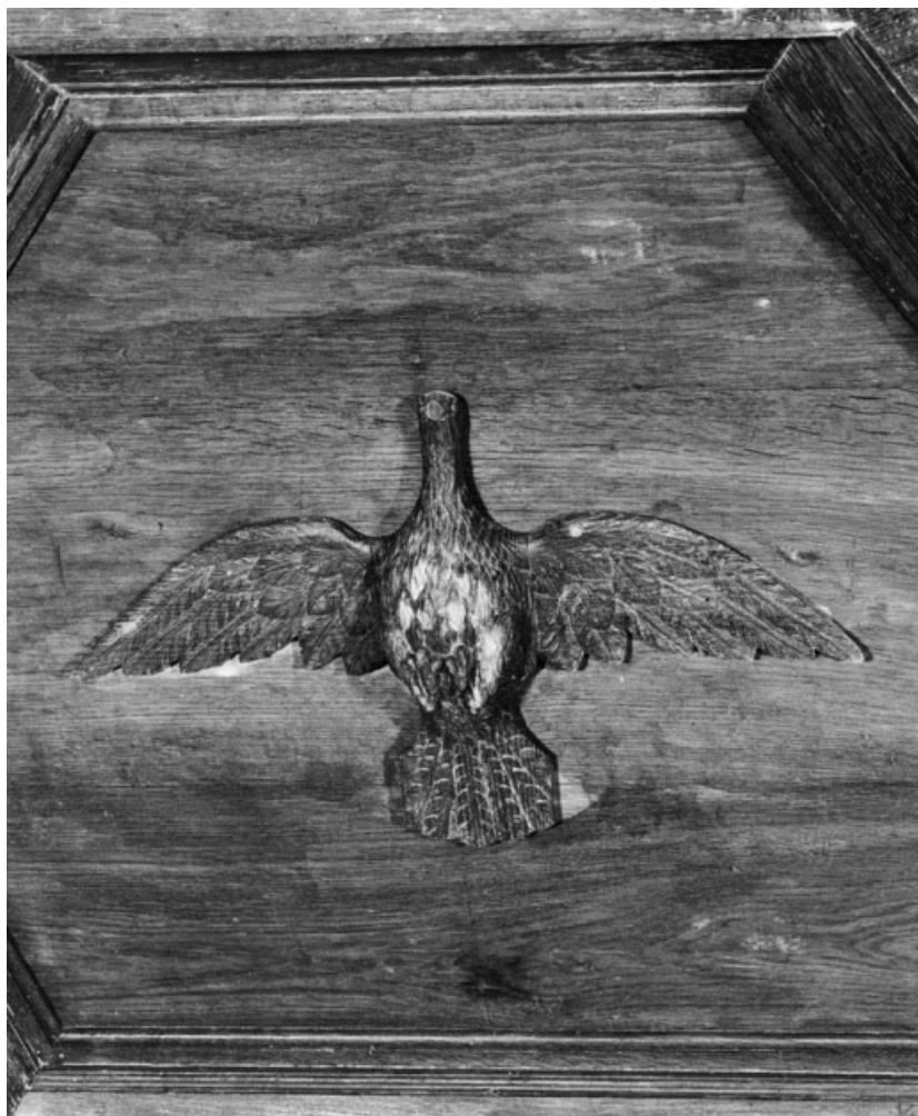
Détail du relief d'applique de l'abat-voix.