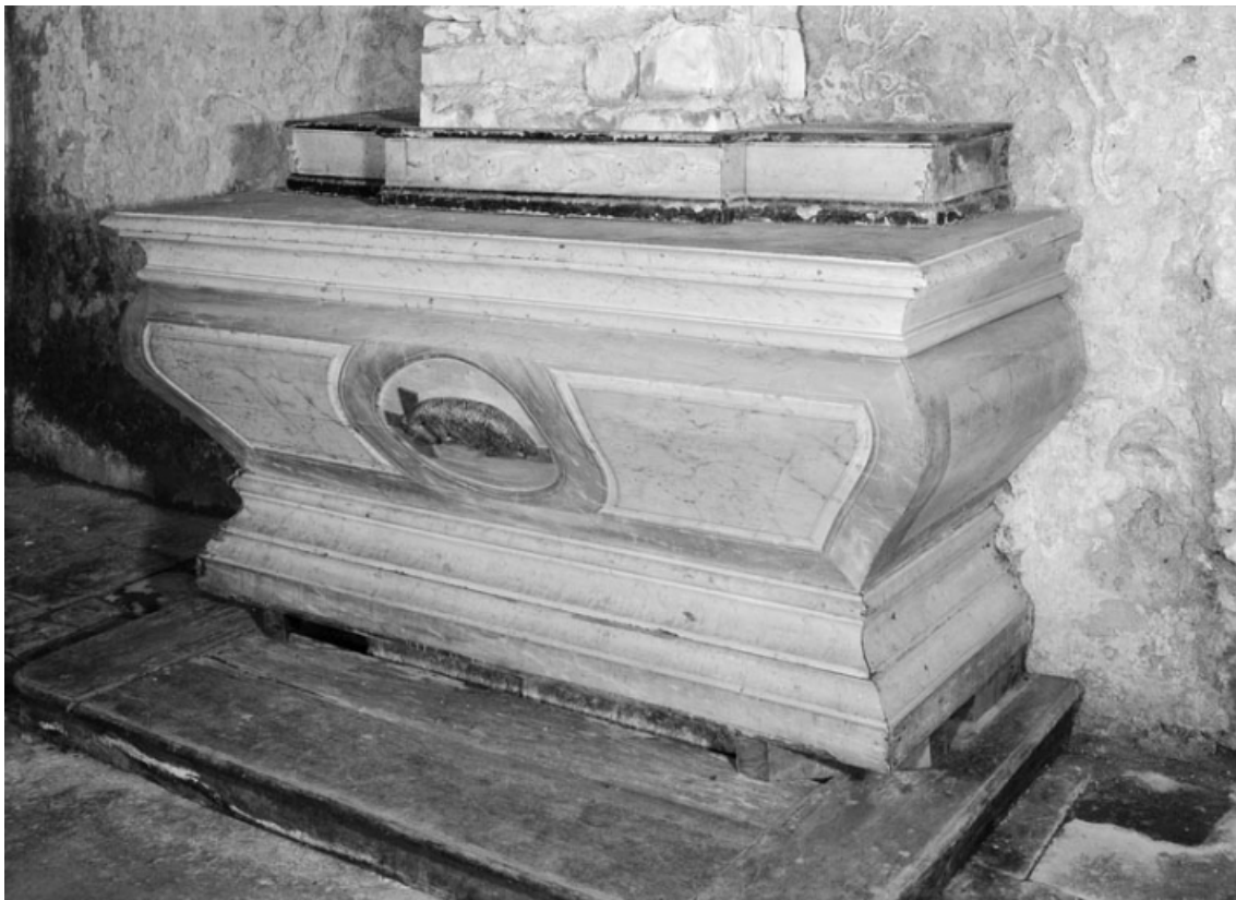
Vue de trois quarts droit.