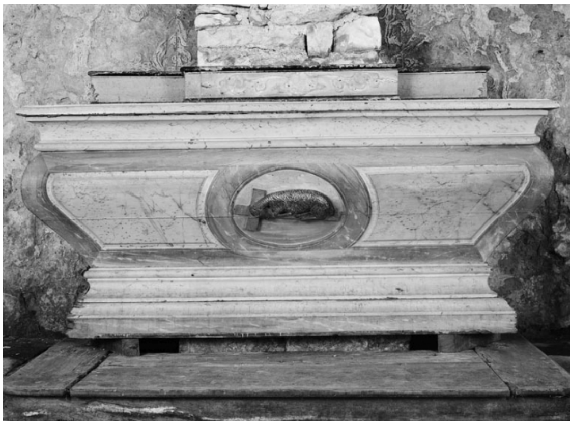
Vue générale de face.