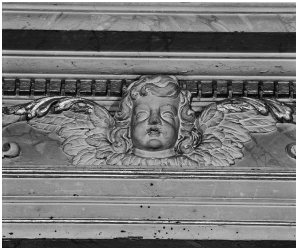
Détail de l'ange de la frise.