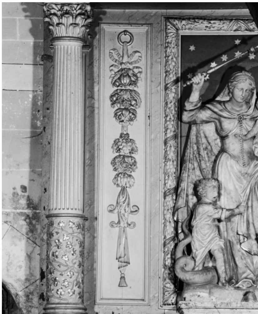
Détail de la chute de fruits sur le retable.