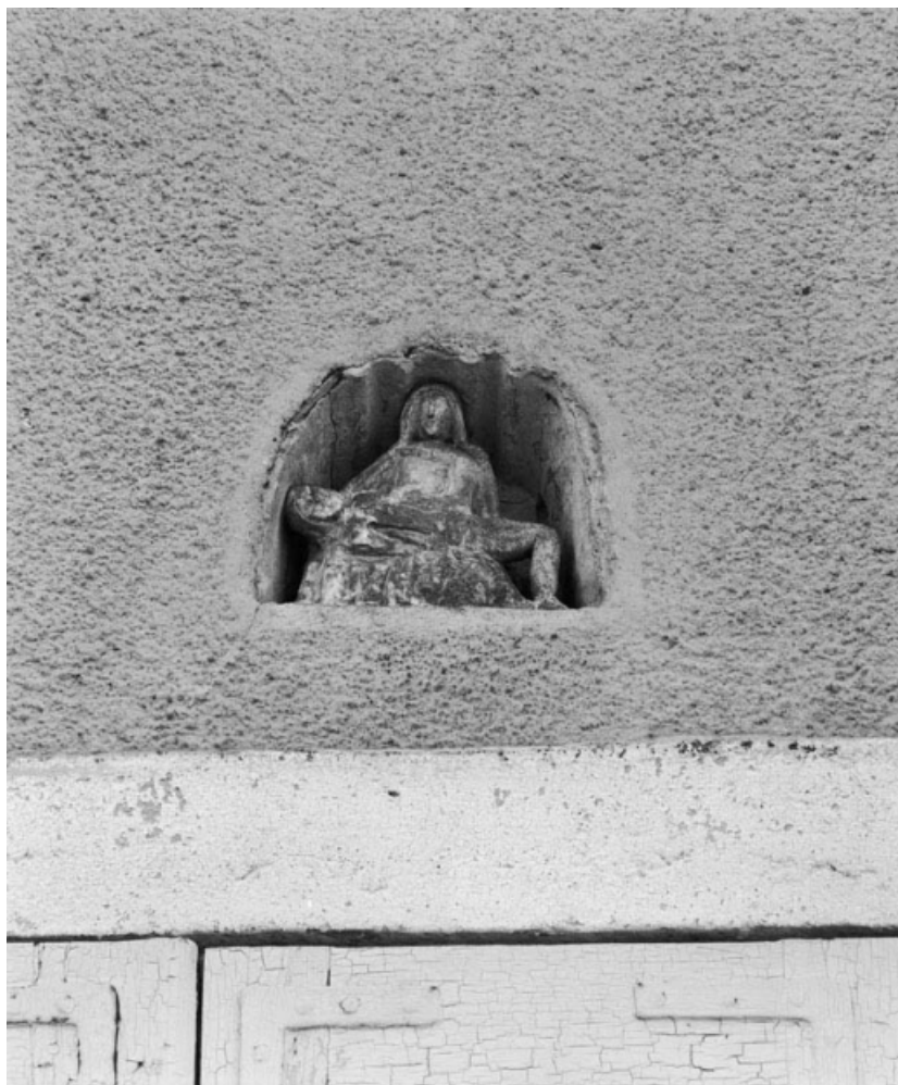
Vue d'ensemble du groupe sculpté dans une niche de la façade de la maison sise parcelle 481, section B4 sur le cadastre de 1967. 21, Santenay maison