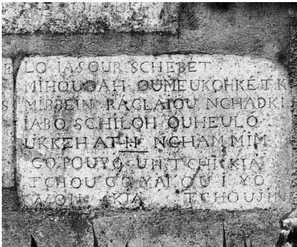
Vue d'ensemble d'une plaque.