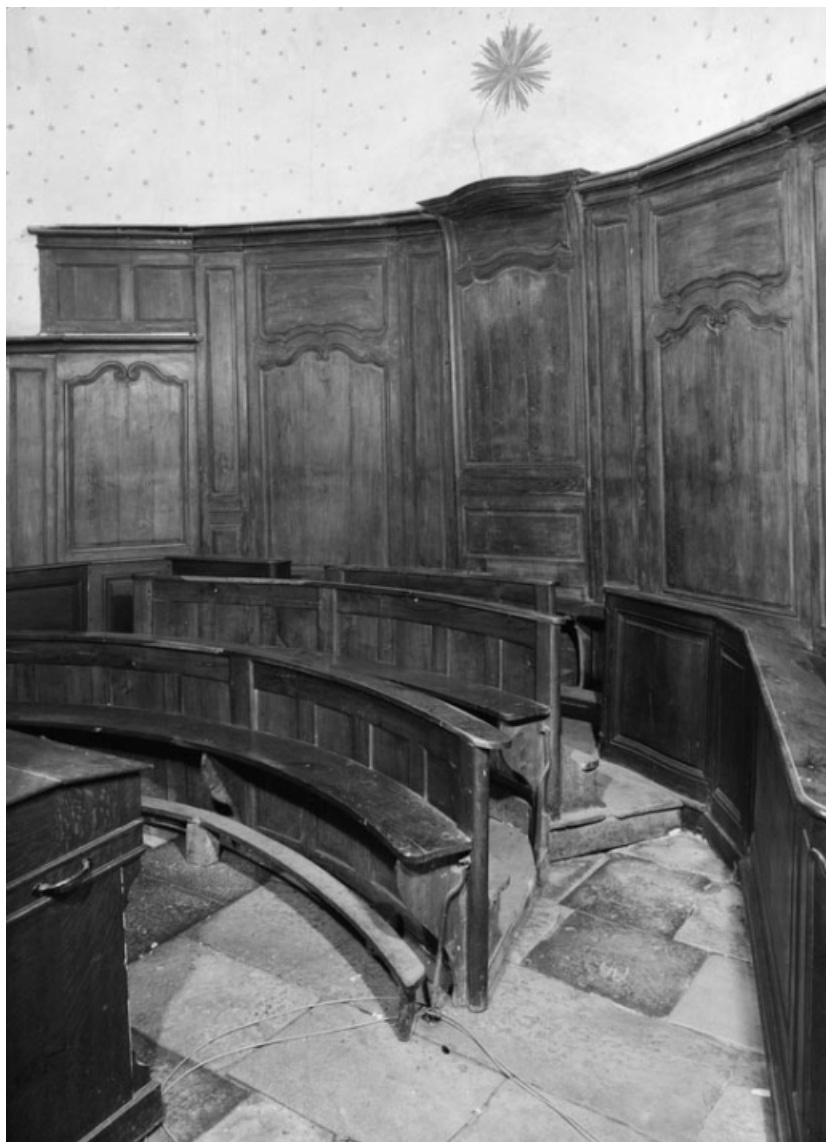
Lambris. 21, Saint-Romain