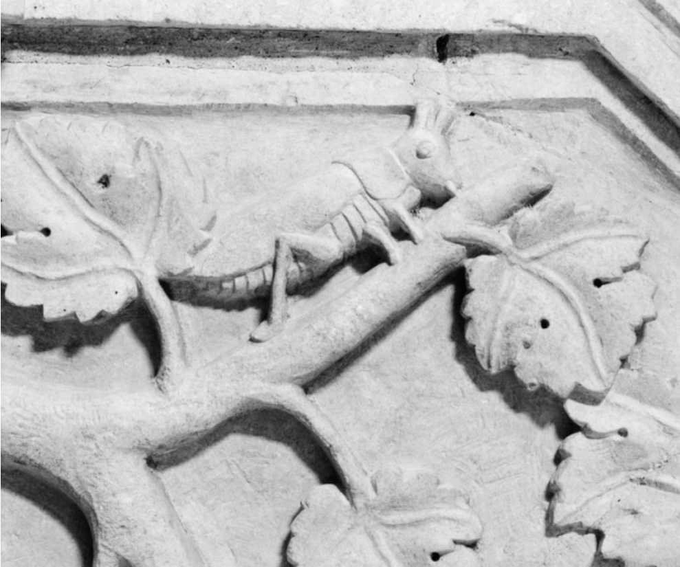
Détail de la rampe : sauterelle.