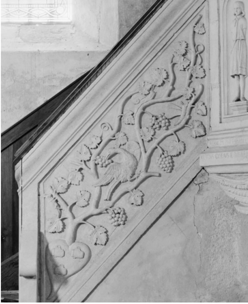
Panneau sculpté formant rampe.