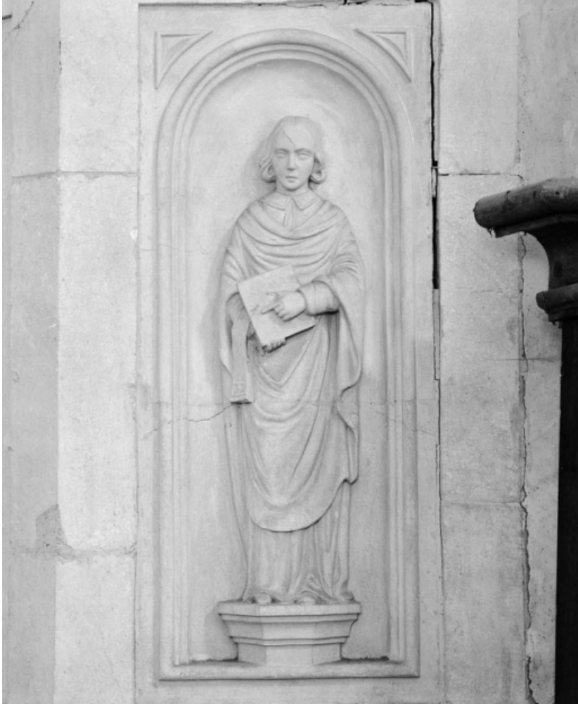
Panneau droit de la cuve.