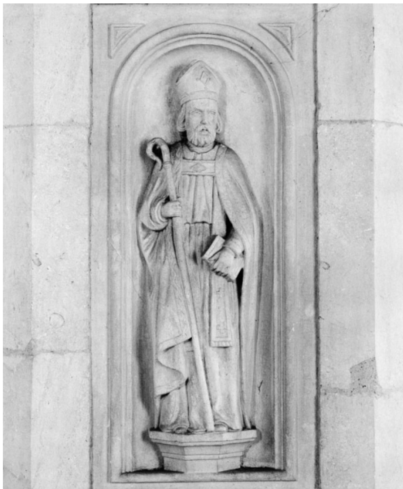
Panneau central de la cuve.