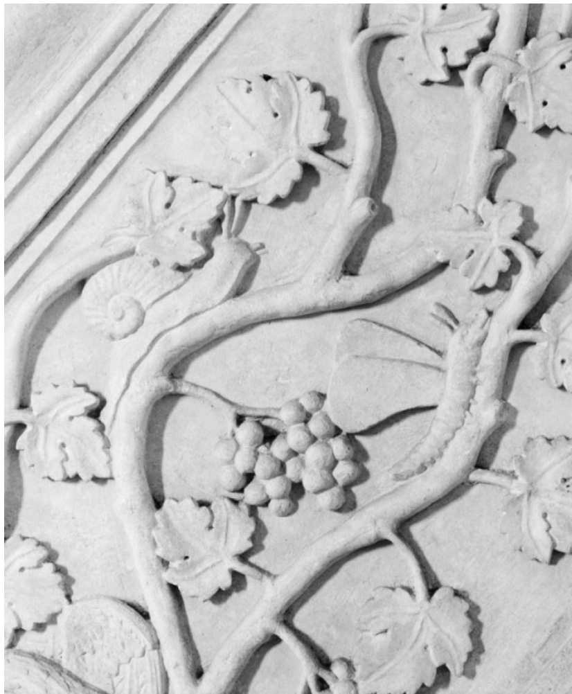
Détail d'escargot et de chenille ailée. 21, Saint-Romain