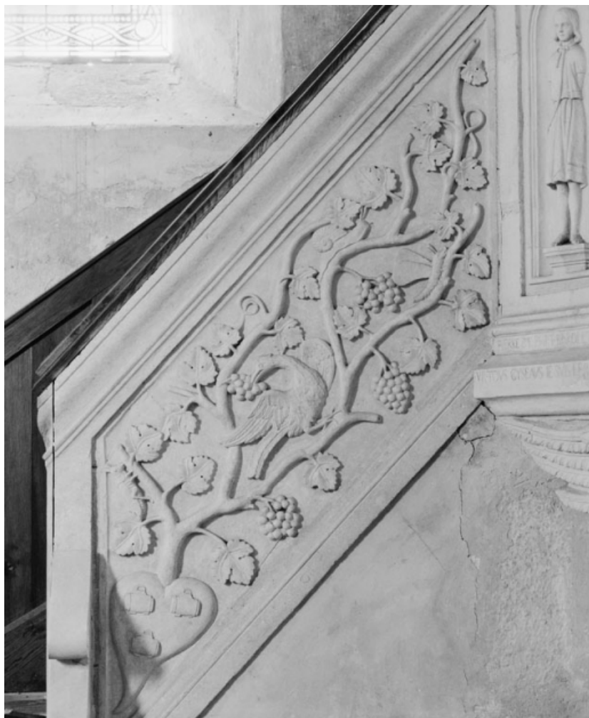
Panneau sculpté formant rampe.