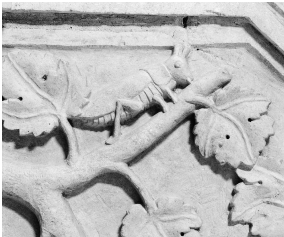
Détail de la rampe : sauterelle.