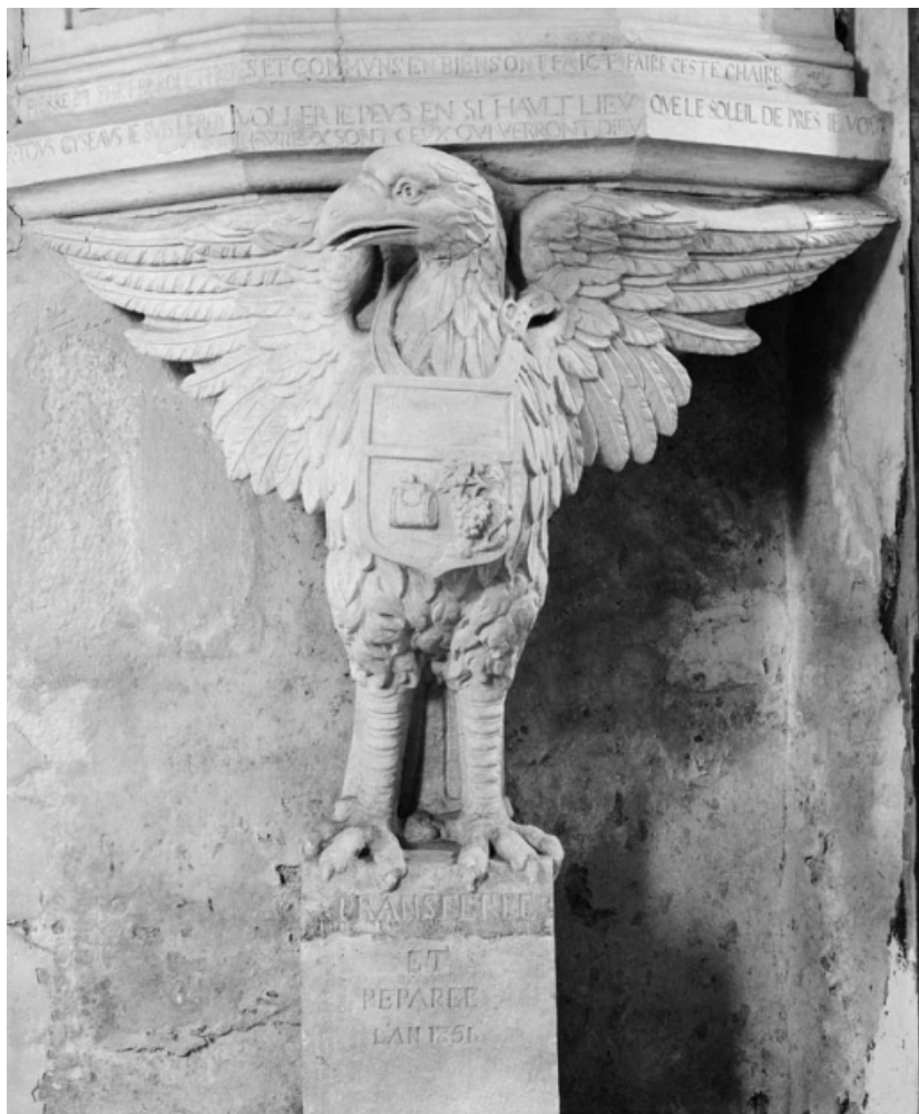
Aigle ornant le pied de la cuve.