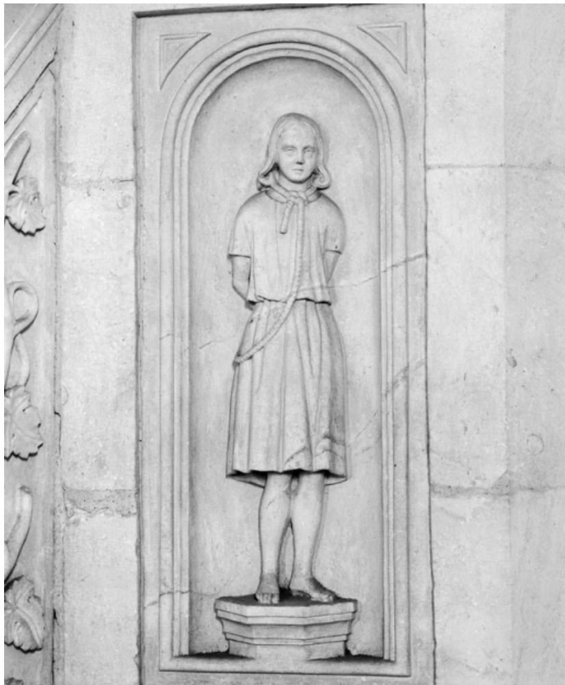
Panneau gauche de la cuve. 21, Saint-Romain