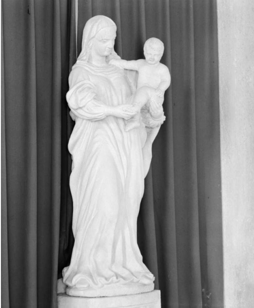
Vue d'ensemble, de trois quarts droit. 21, Saint-Romain