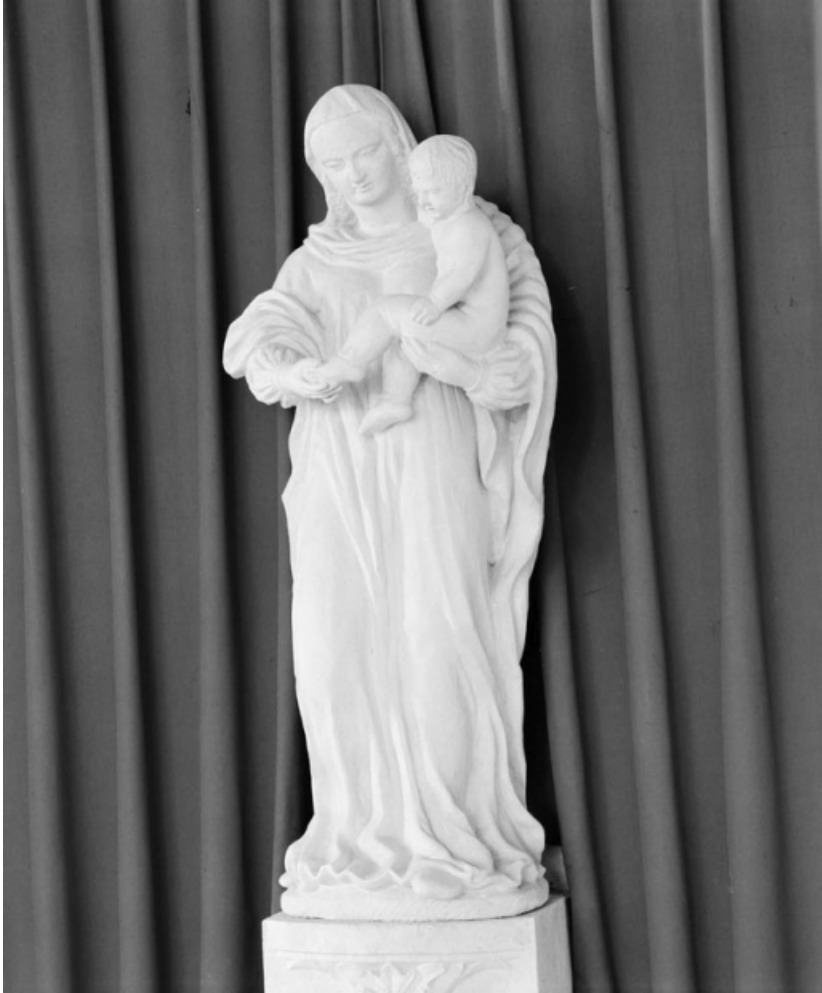
Vue d'ensemble, de trois quarts gauche.