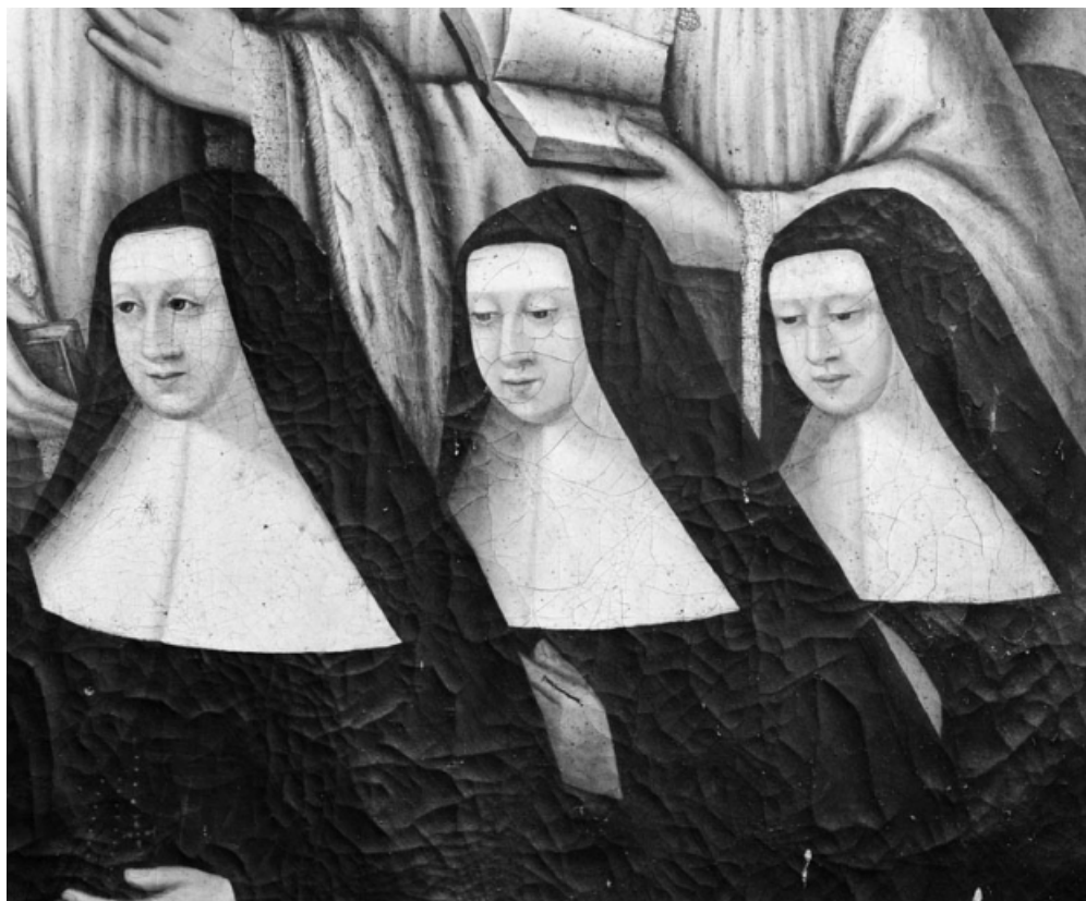
Détail : les Ursulines.