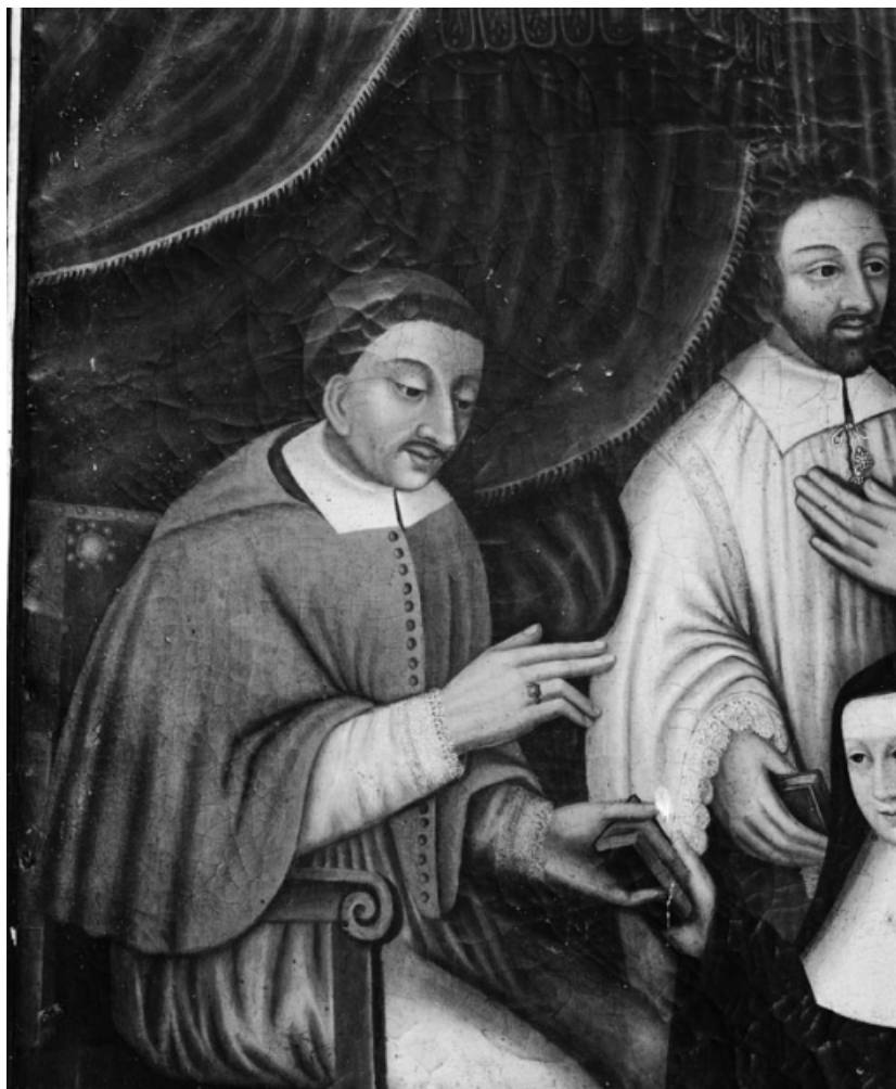
Détail de saint Charles.