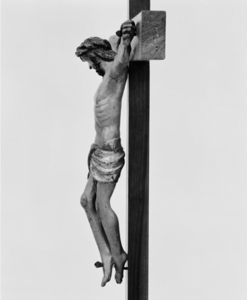
Vue de profil gauche.