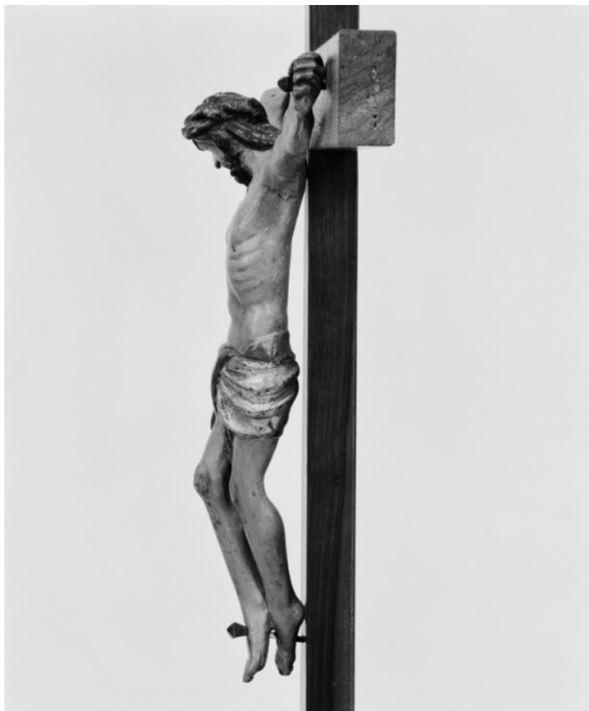
Vue de profil gauche.