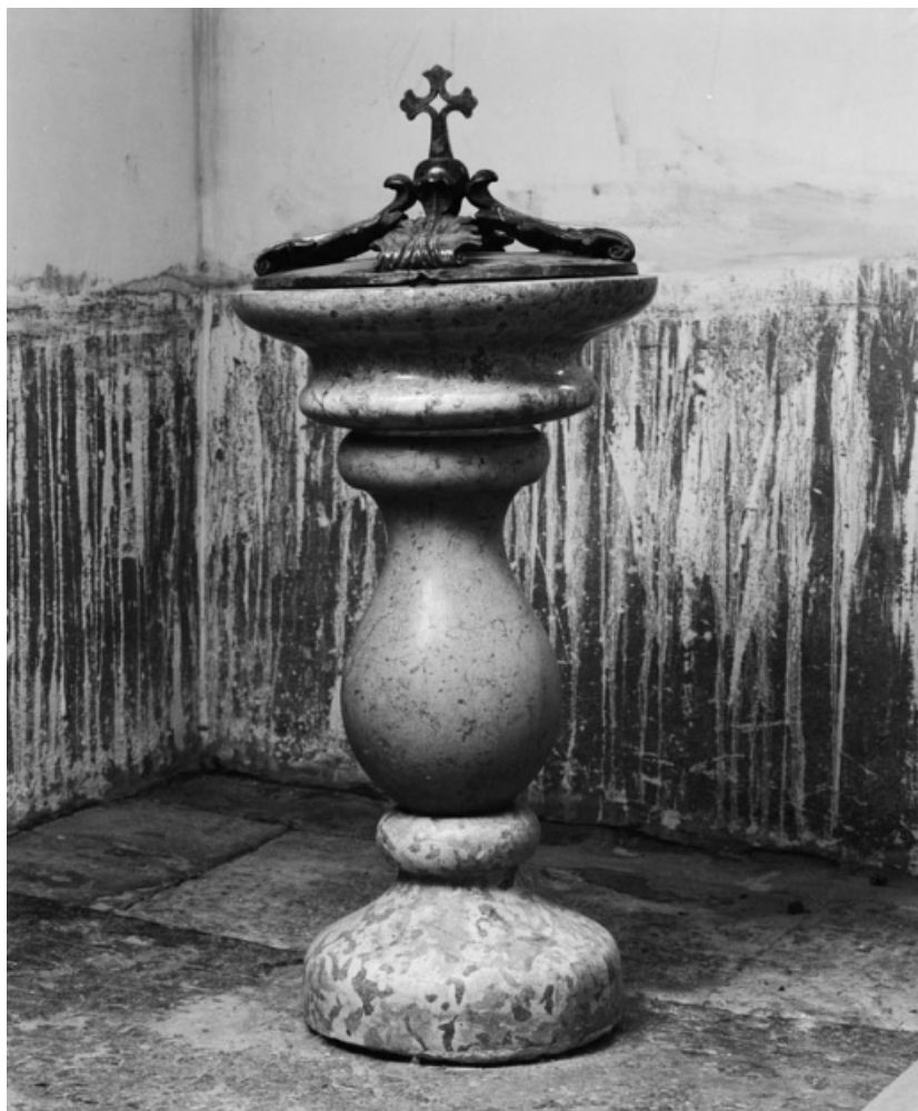
Vue générale. 21, Saint-Aubin