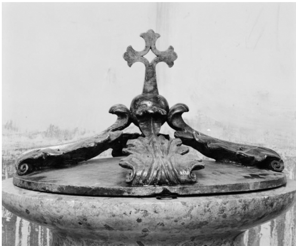
Détail du couvercle.