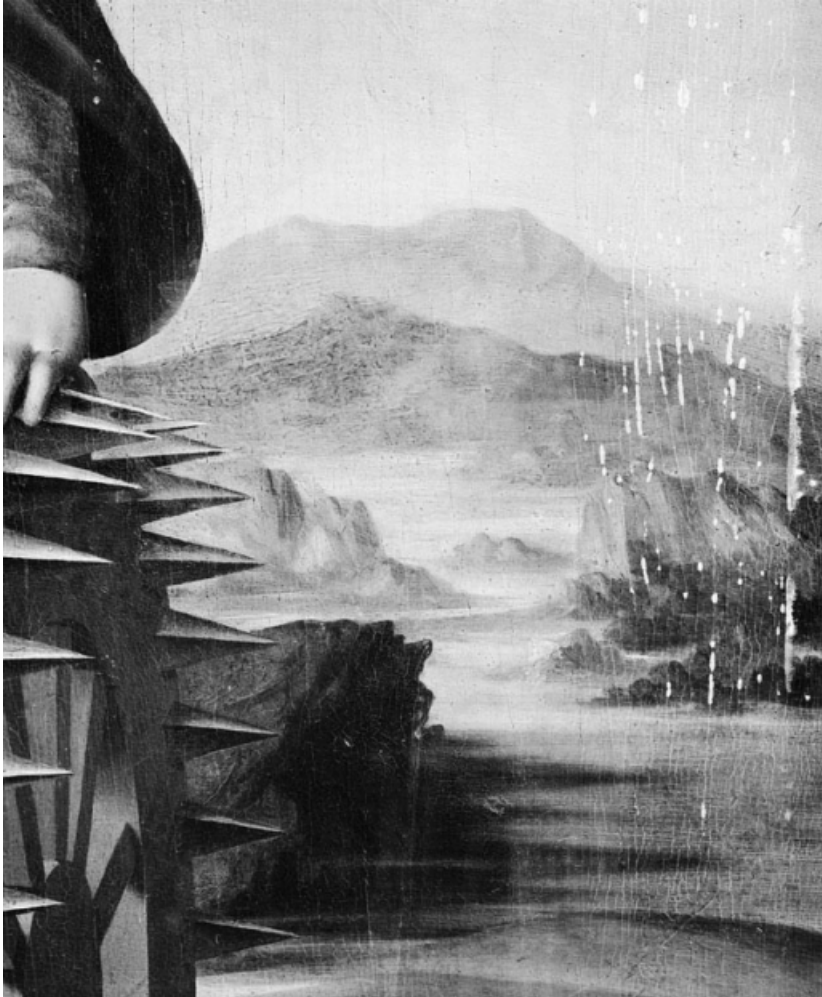
Détail du paysage à droite.