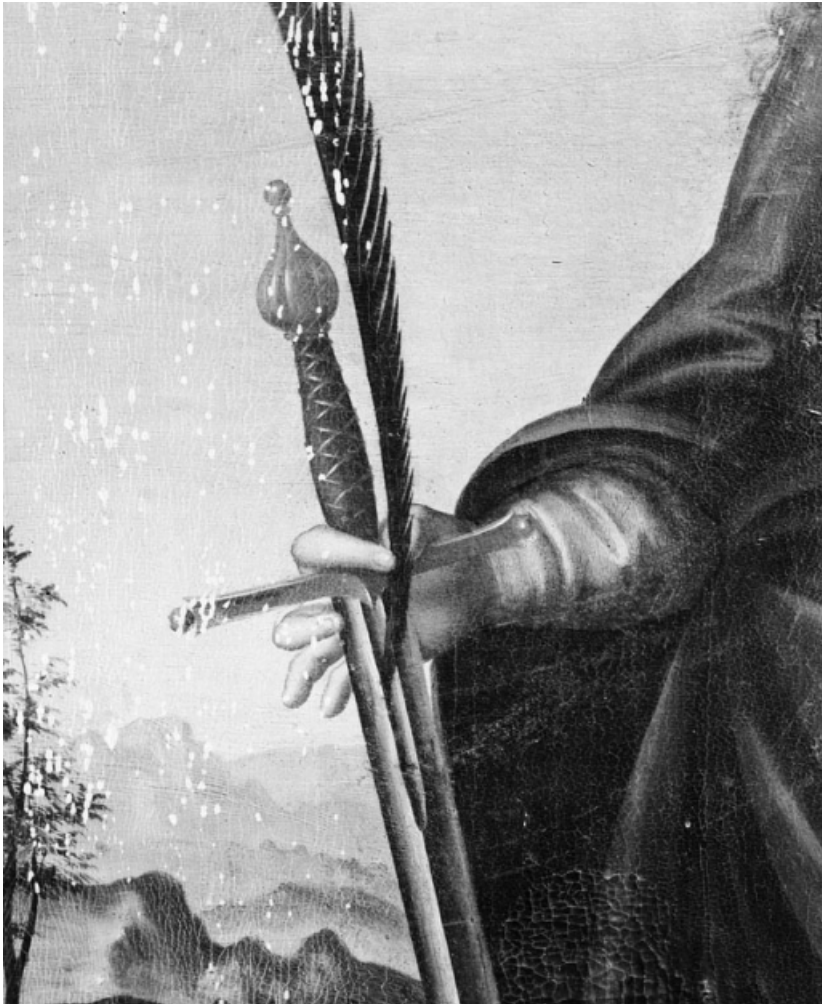
Détail de la main droite.