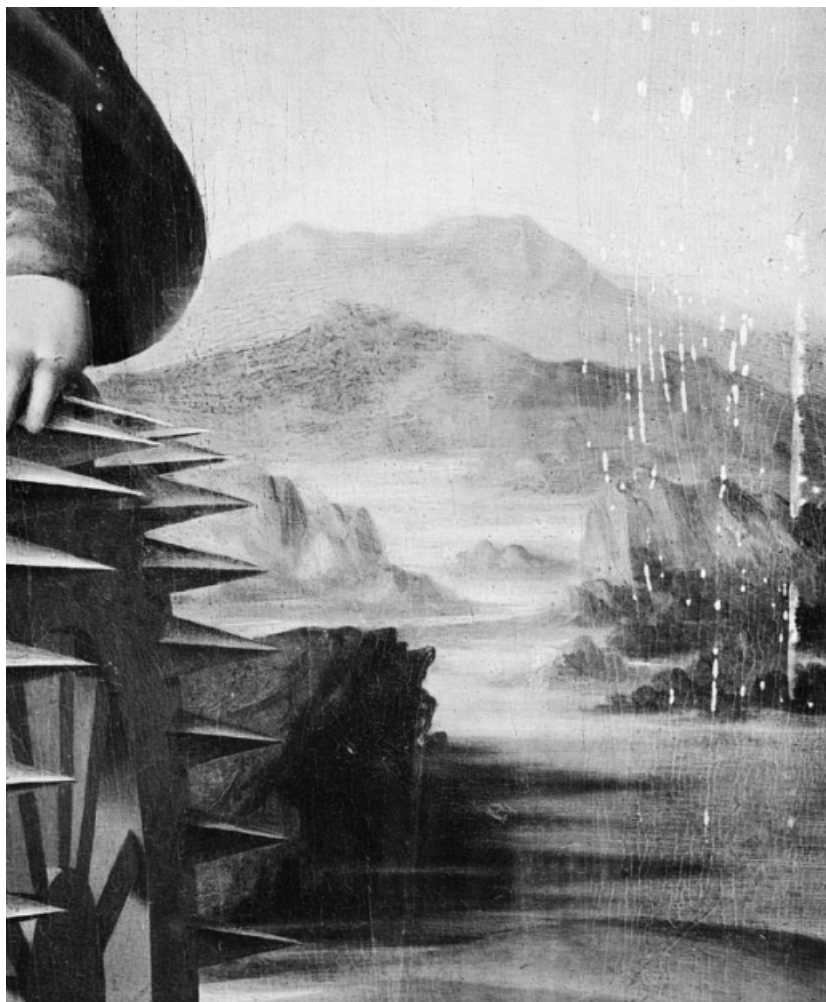
Détail du paysage à droite. 21, La Rochepot