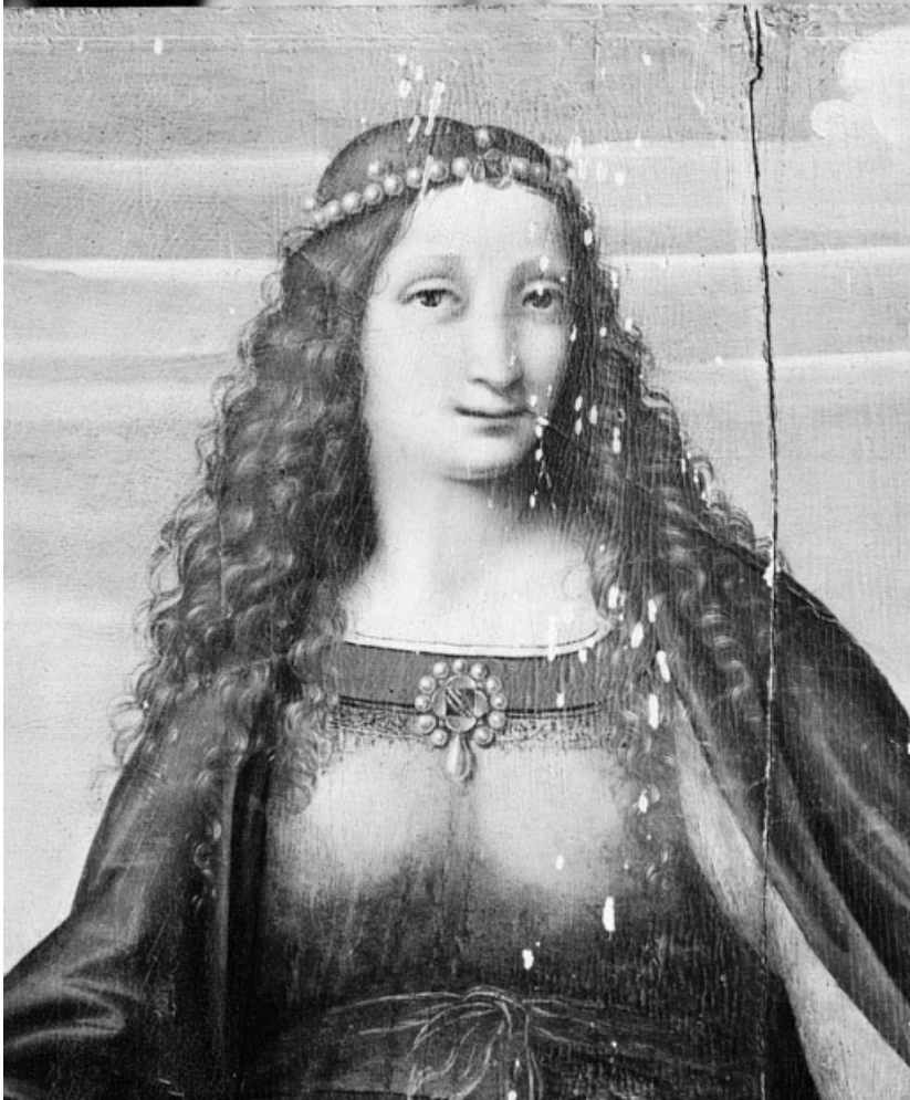
Détail du buste.