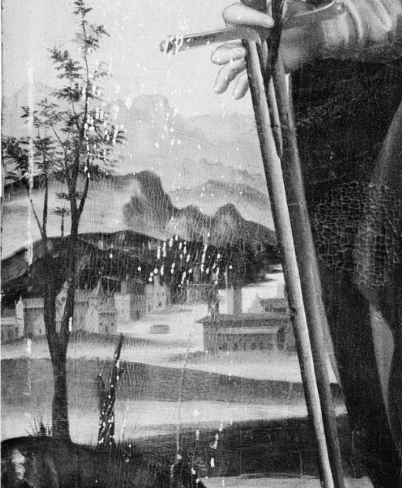
Détail du paysage à gauche.