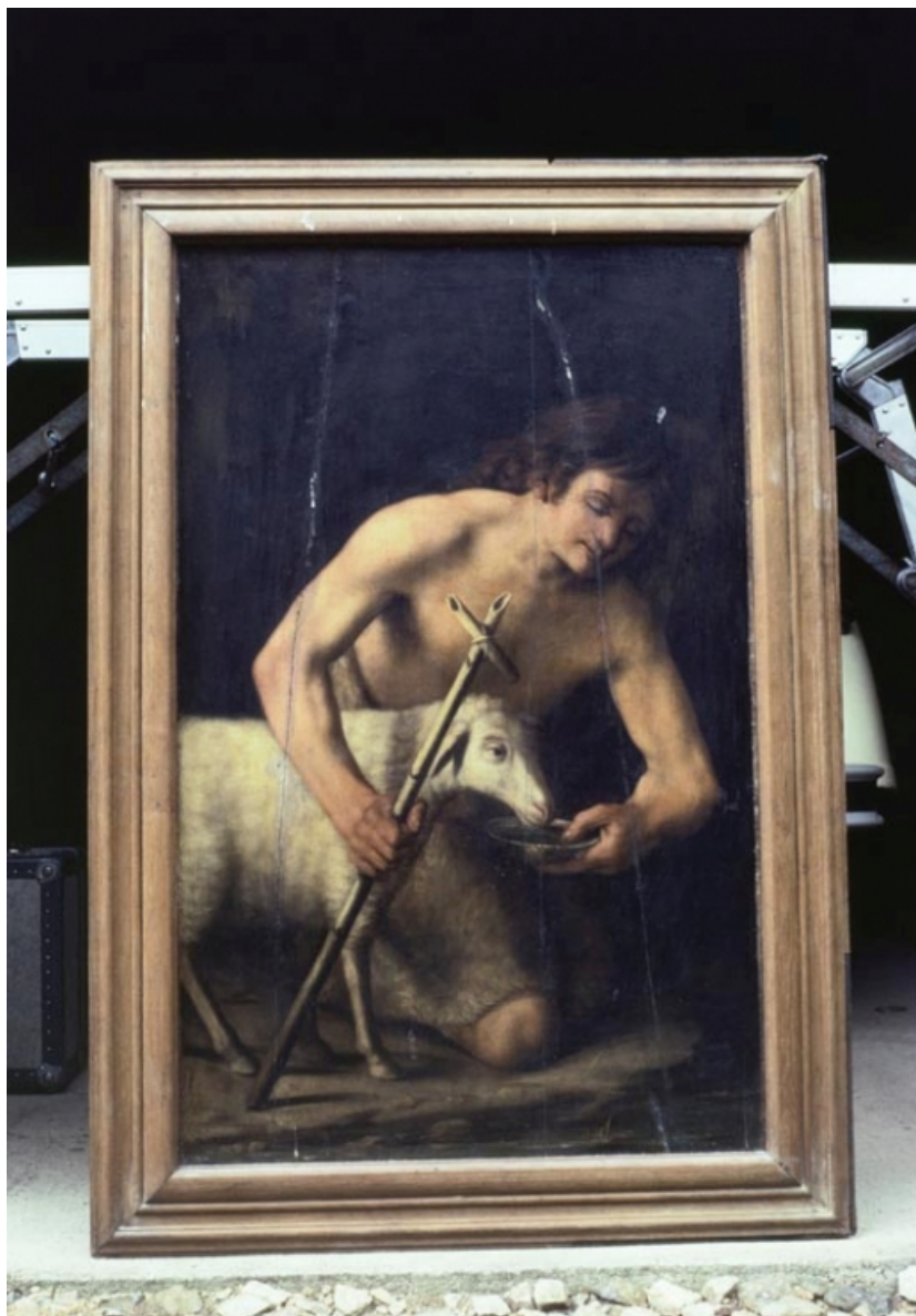
Panneau gauche : Saint-Jean-Baptiste.