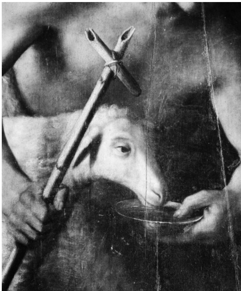
Panneau gauche : détail de l'agneau.