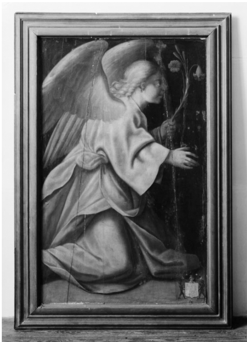
Revers du panneau gauche : Ange de l'Annonciation.