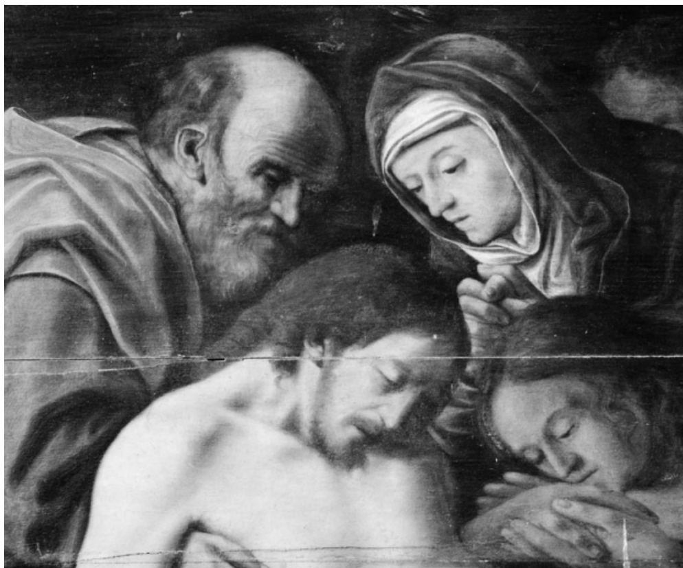
Panneau central : détail des têtes du Christ, de Madeleine, de la Vierge et de Joseph d'Arimathe. 21, La Rochepot