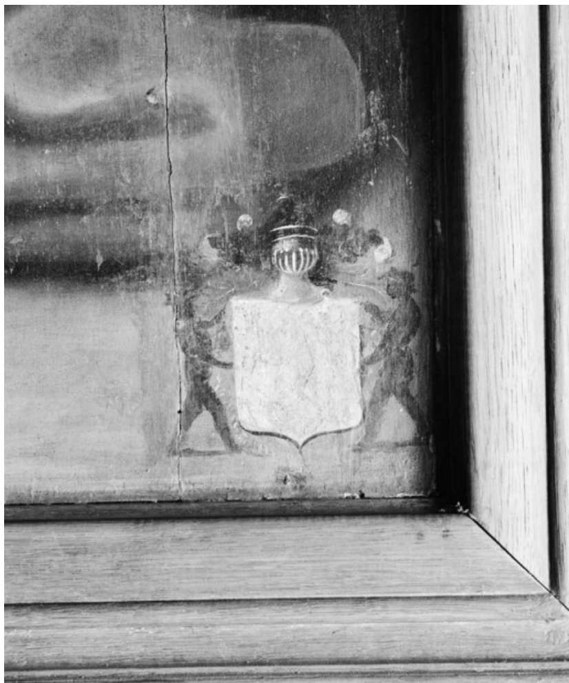
Revers du panneau gauche : détail du blason.