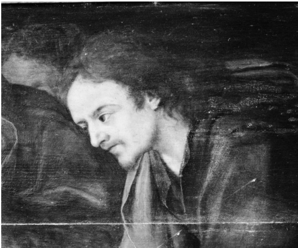
Panneau central : détail de la tête de saint Jean.