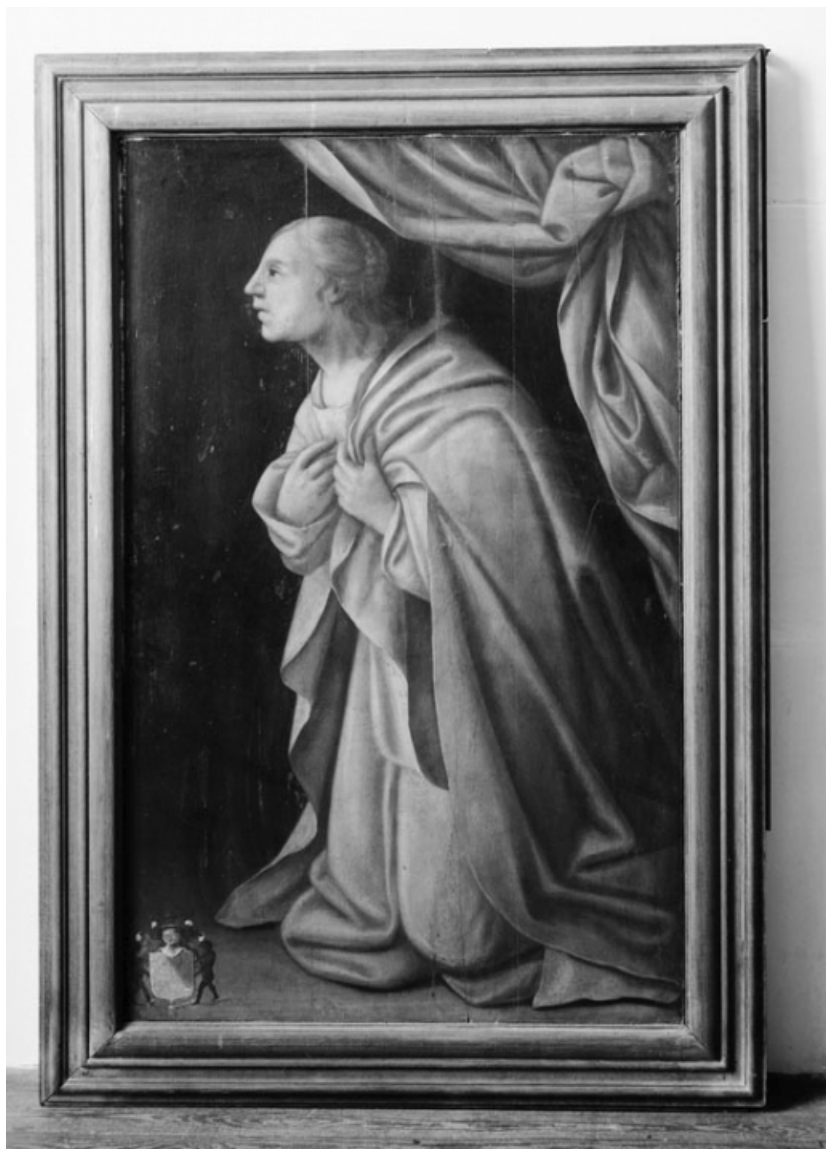
Revers du panneau droit : Vierge de l'Annonciation.