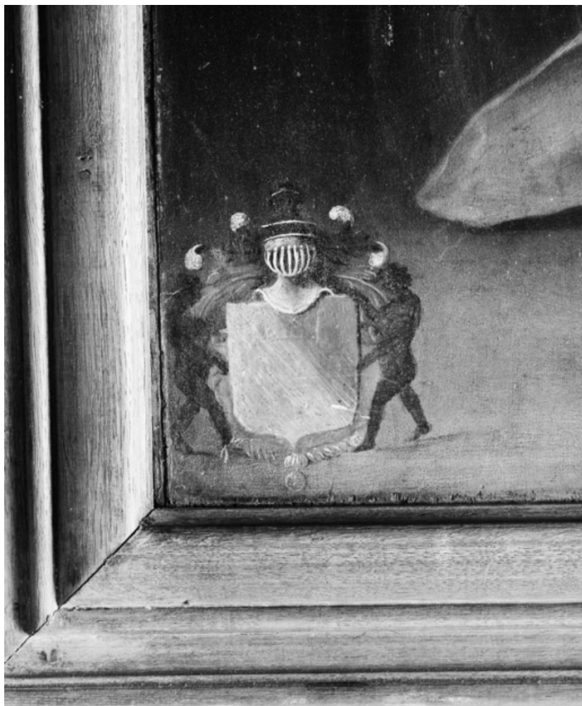
Revers du panneau droit : détail du blason.