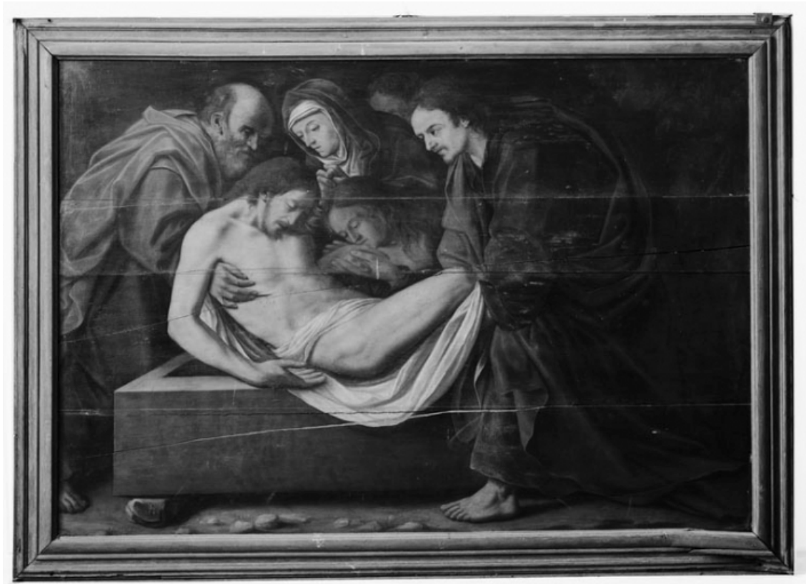
Vue d'ensemble du panneau central.