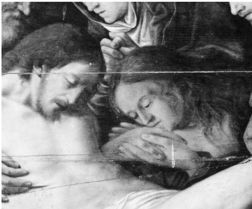
Panneau central : détail des têtes du Christ et de Marie-Madeleine. 21, La Rochepot