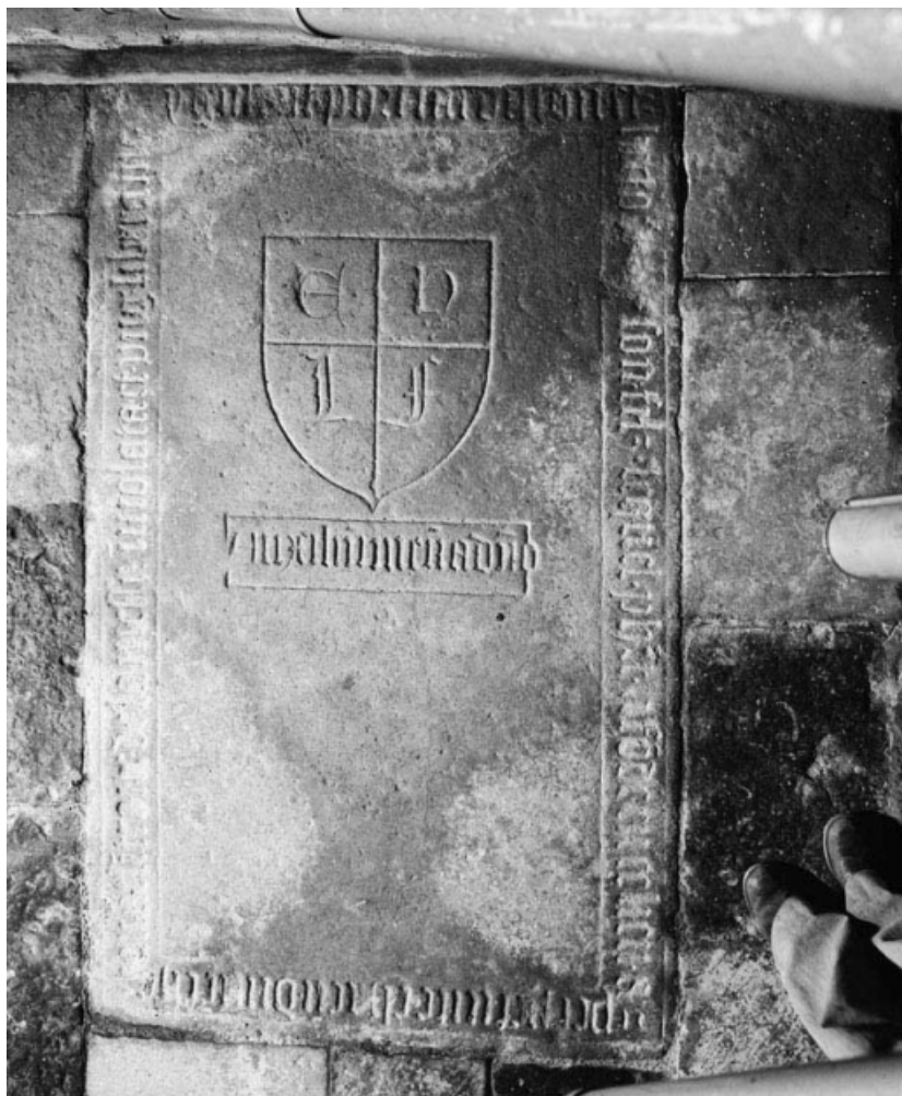
Vue d'ensemble. 21, La Rochepot