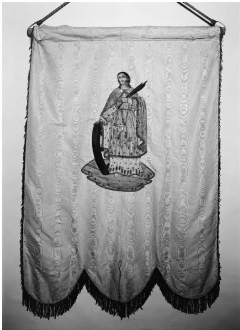
Sainte Catherine, sur le revers. 21, Puligny-Montrachet