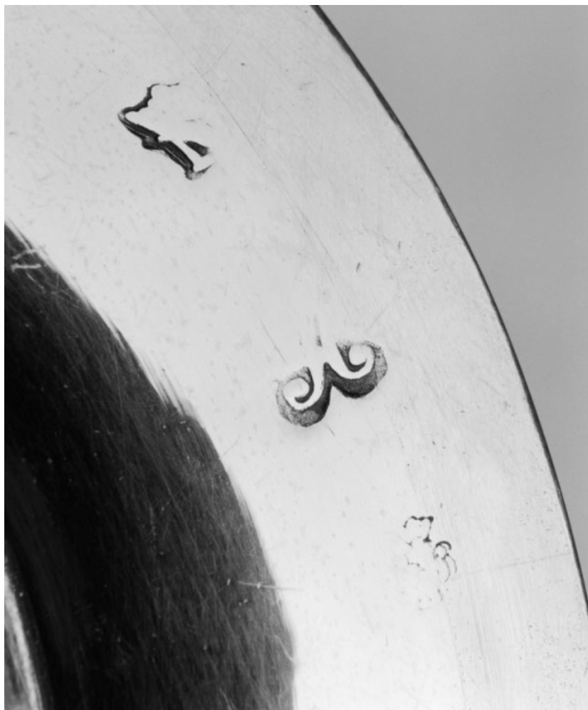
Détail des poinçons. 21, Puligny-Montrachet