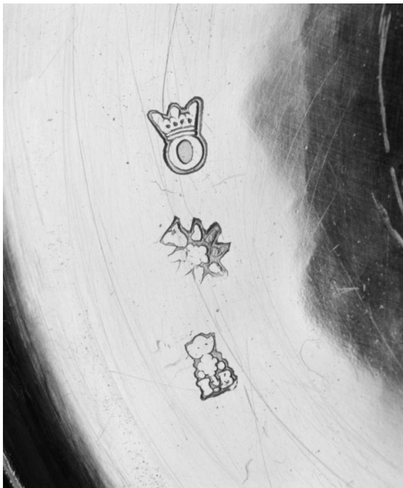
Détail : poinçons au revers du pied.