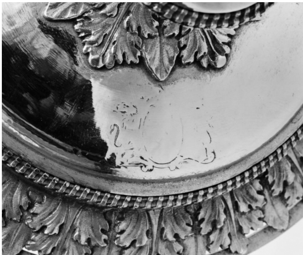
Détail du blason gravé sur le pied.