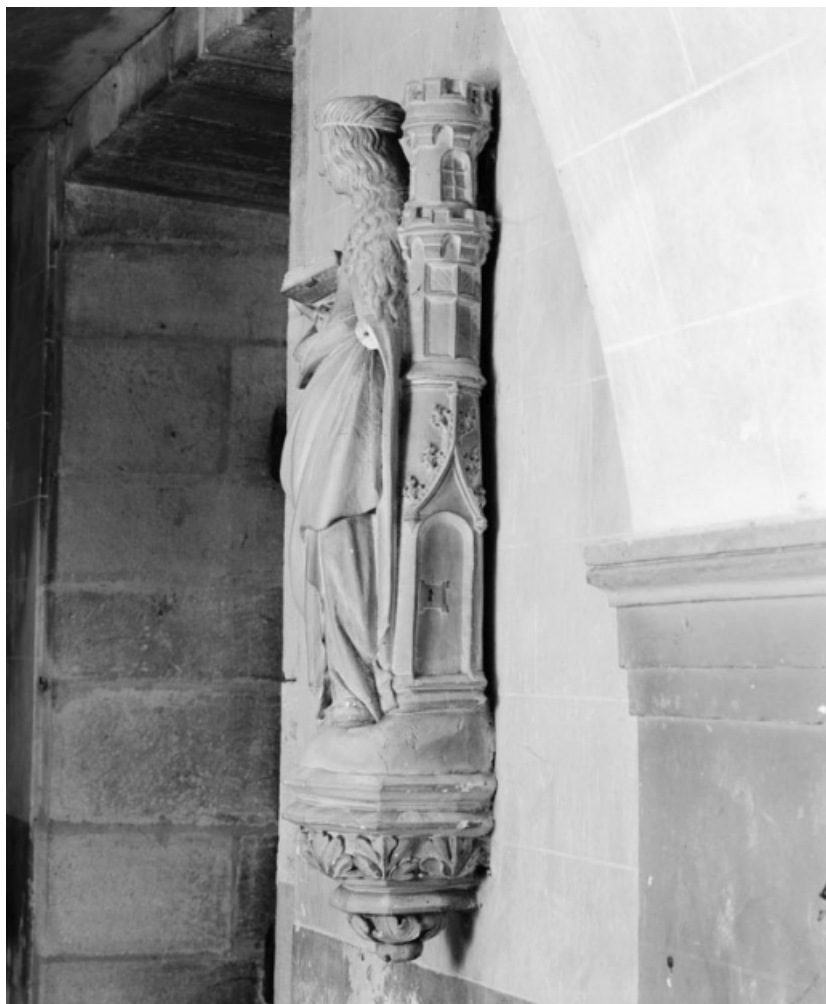
Vue de trois quarts gauche.