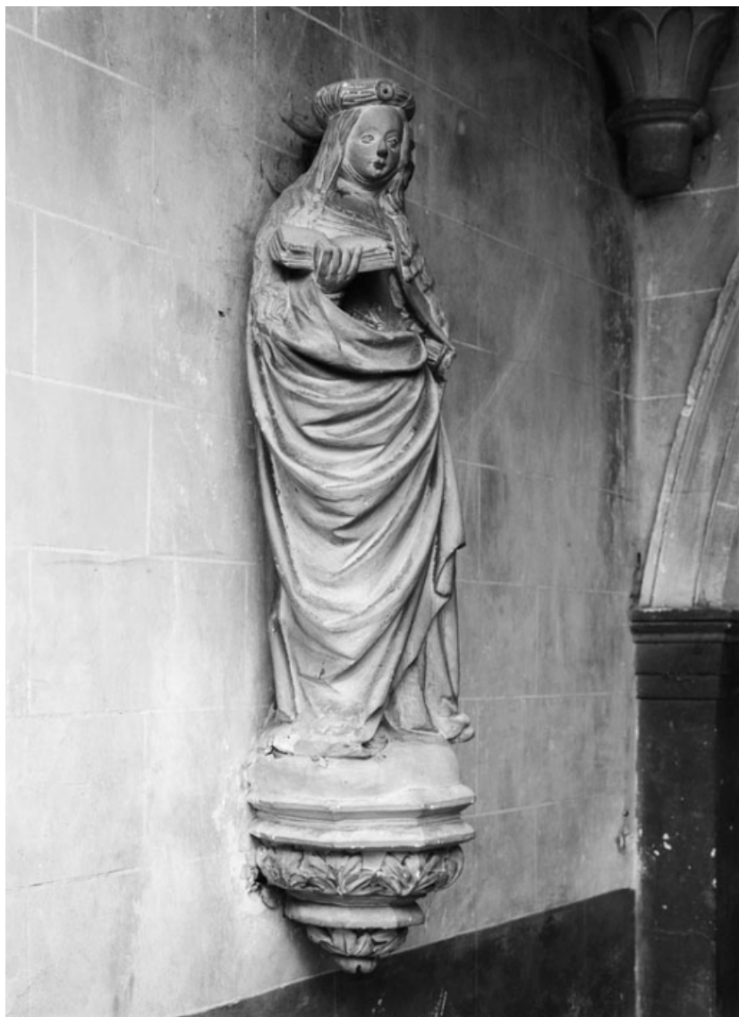
Vue de trois quarts droit.