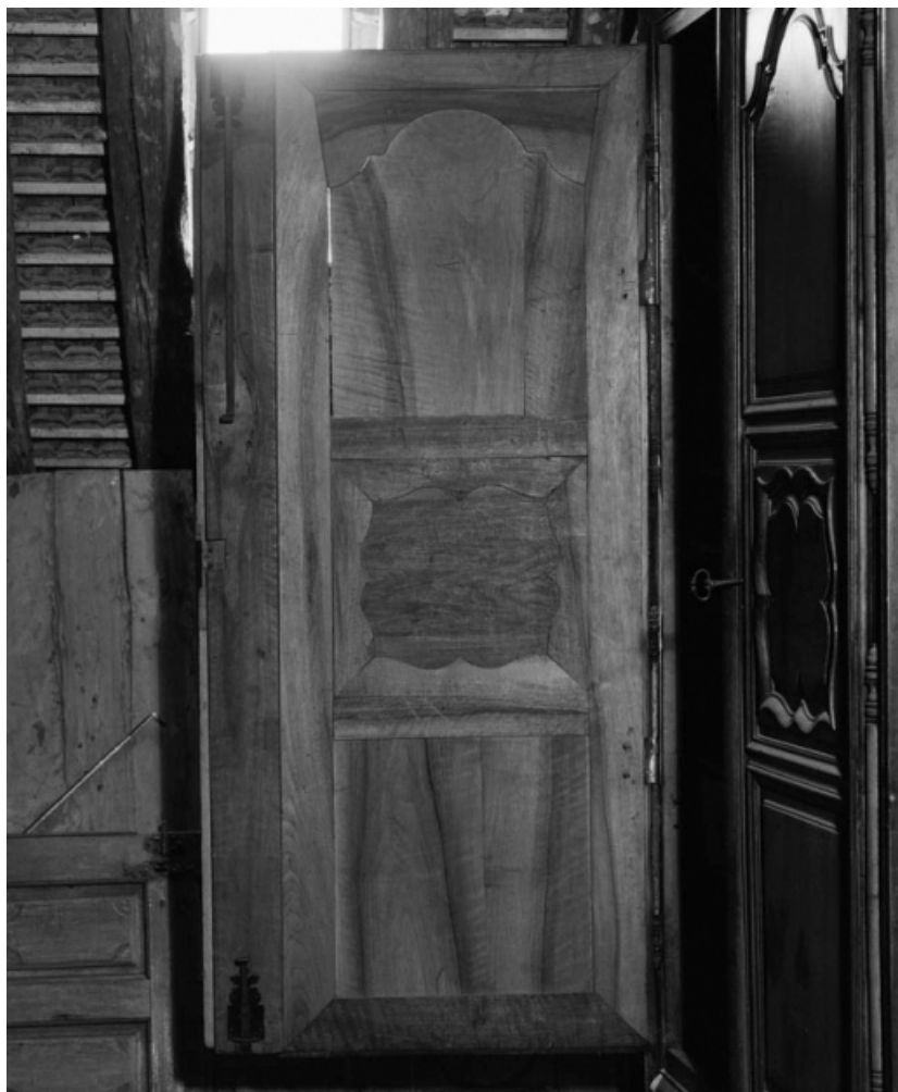
Revers d'un battant.