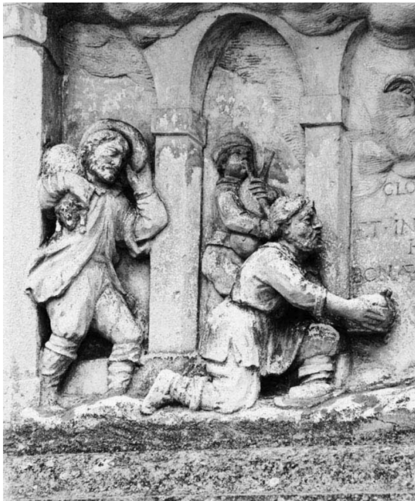
Détail : les bergers.