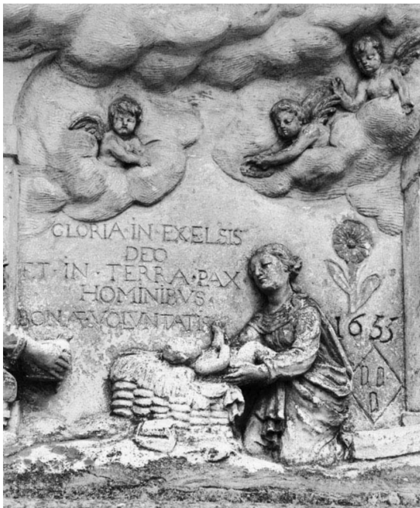
Détail : la Vierge et l'Enfant.