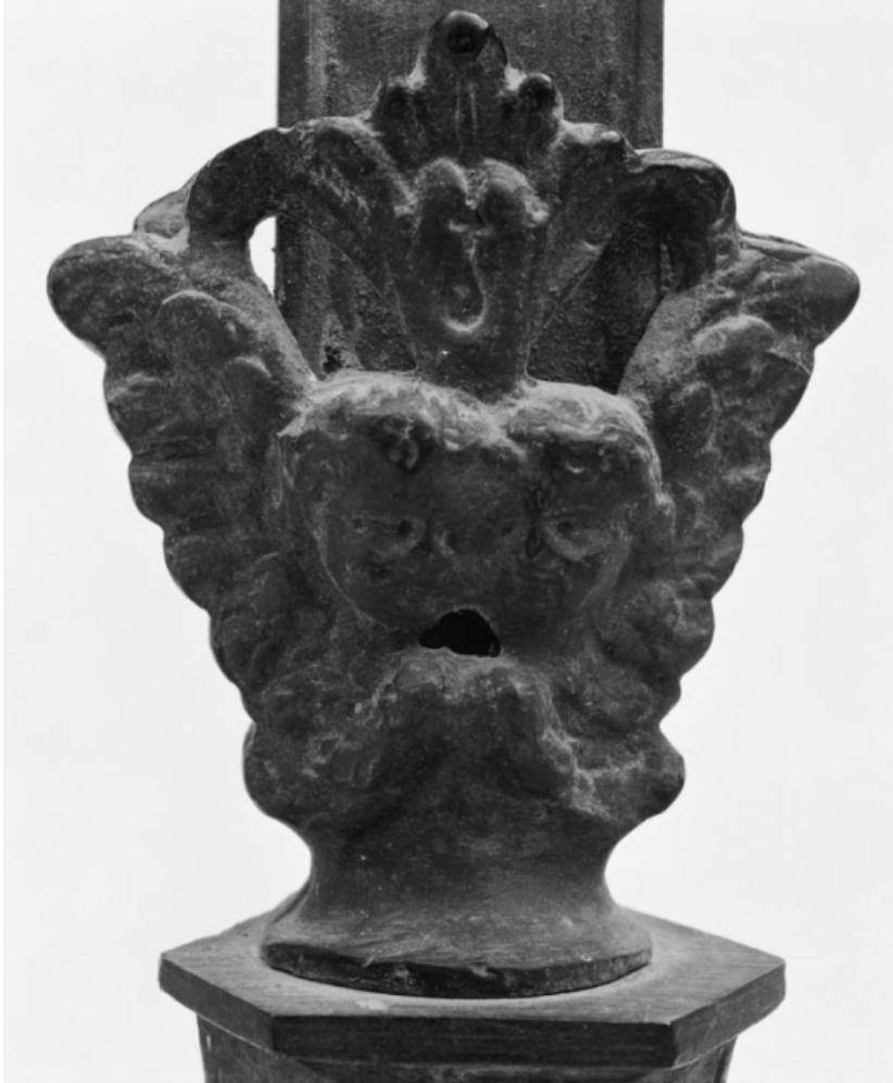
Détail. 21, Nolay