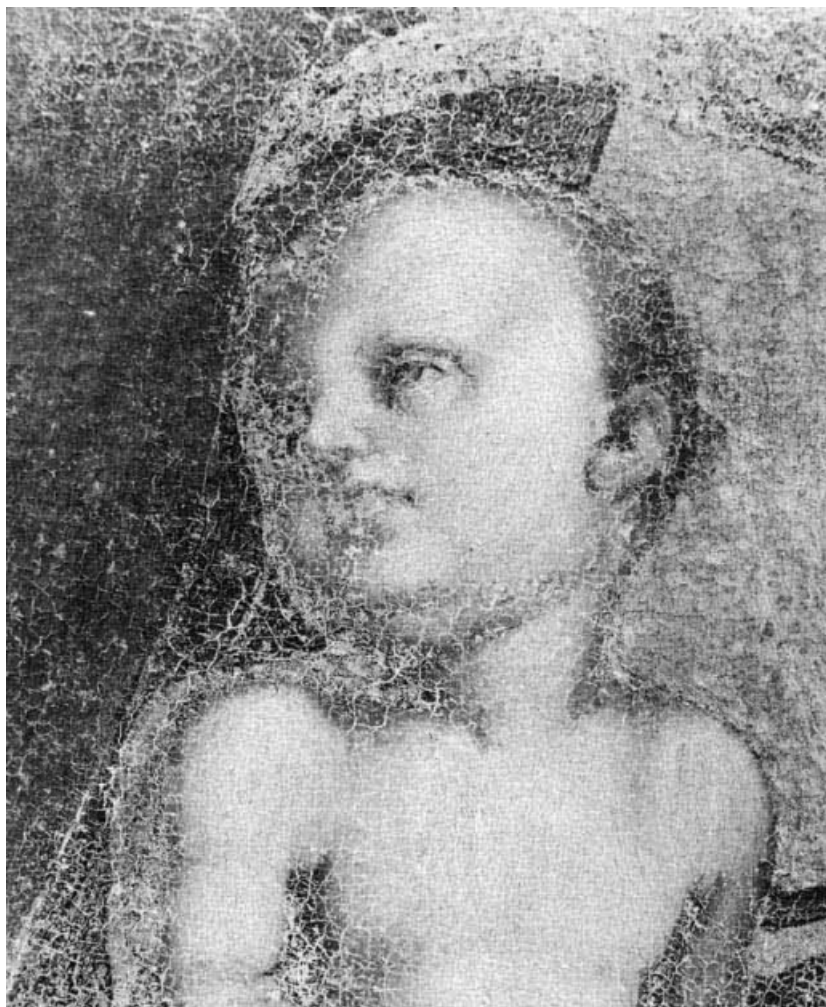
Détail : tête de l'Enfant.