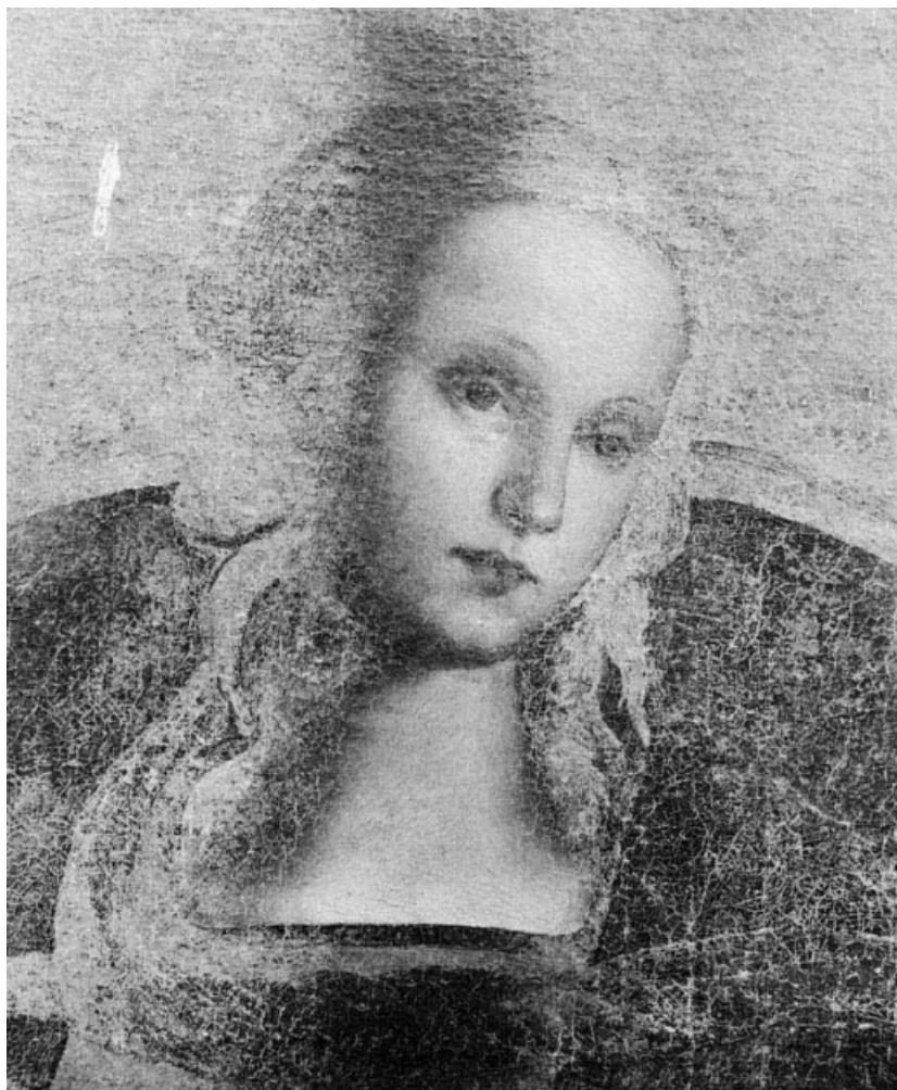
Détail : tête de la Vierge.