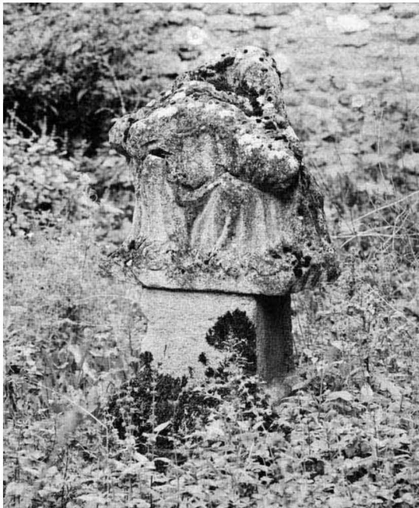
Vue de 3/4 gauche.