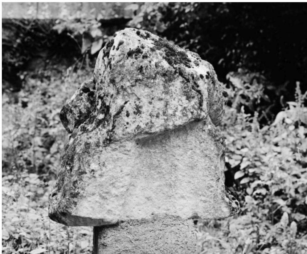
Vue de revers.