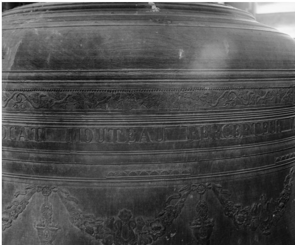
Détail d'une inscription.