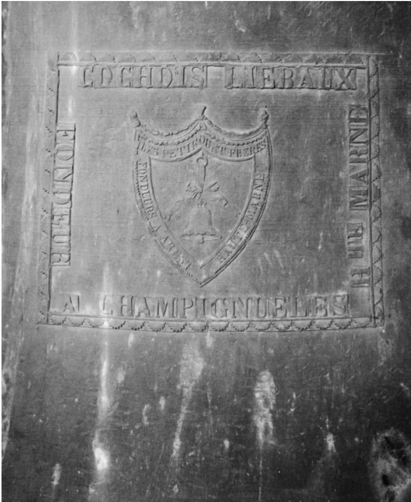
Détail de la marque du fondeur.