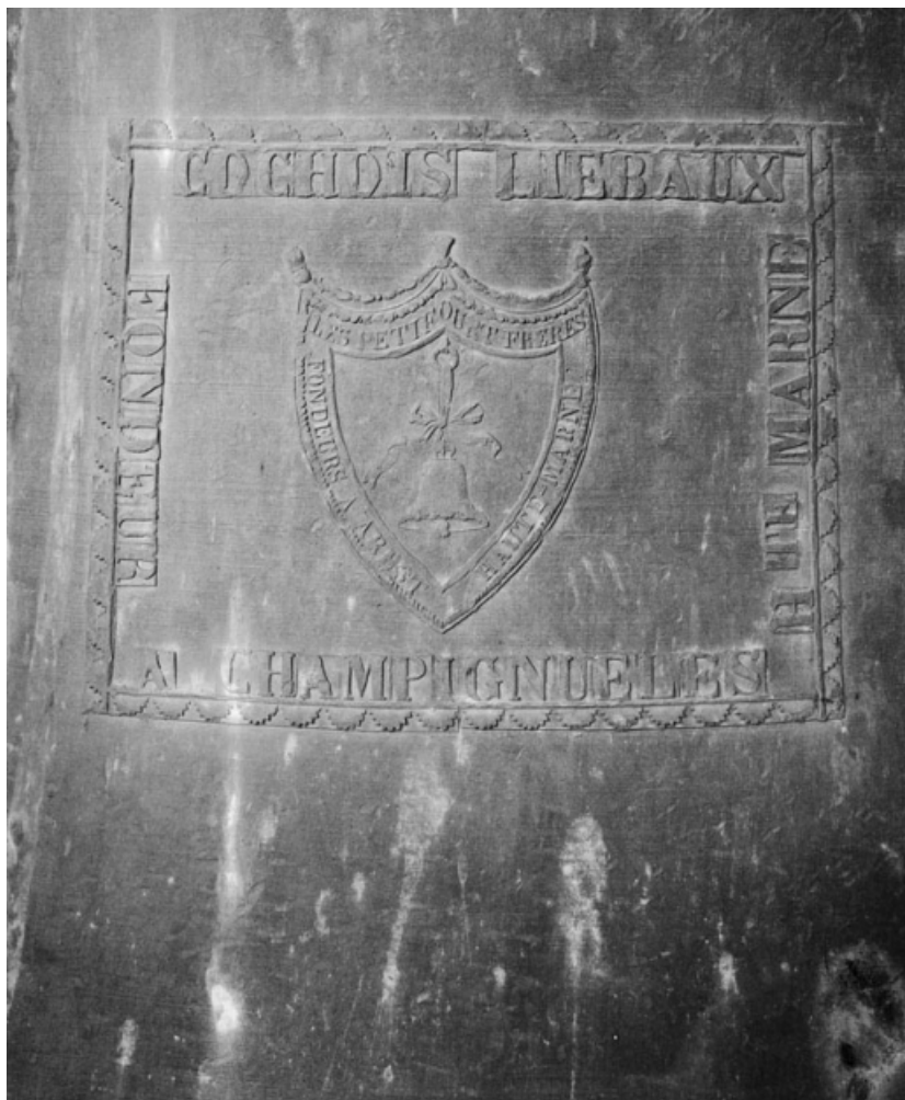
Détail de la marque du fondeur.