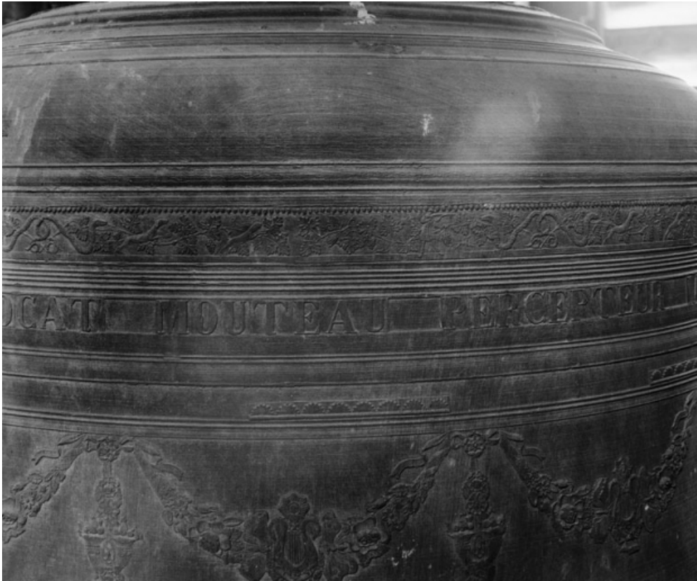
Détail d'une inscription.