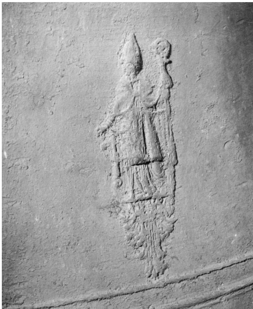
Détail d'un saint évêque.