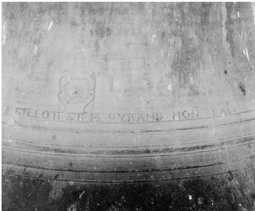
Détail de la marque du fondeur.