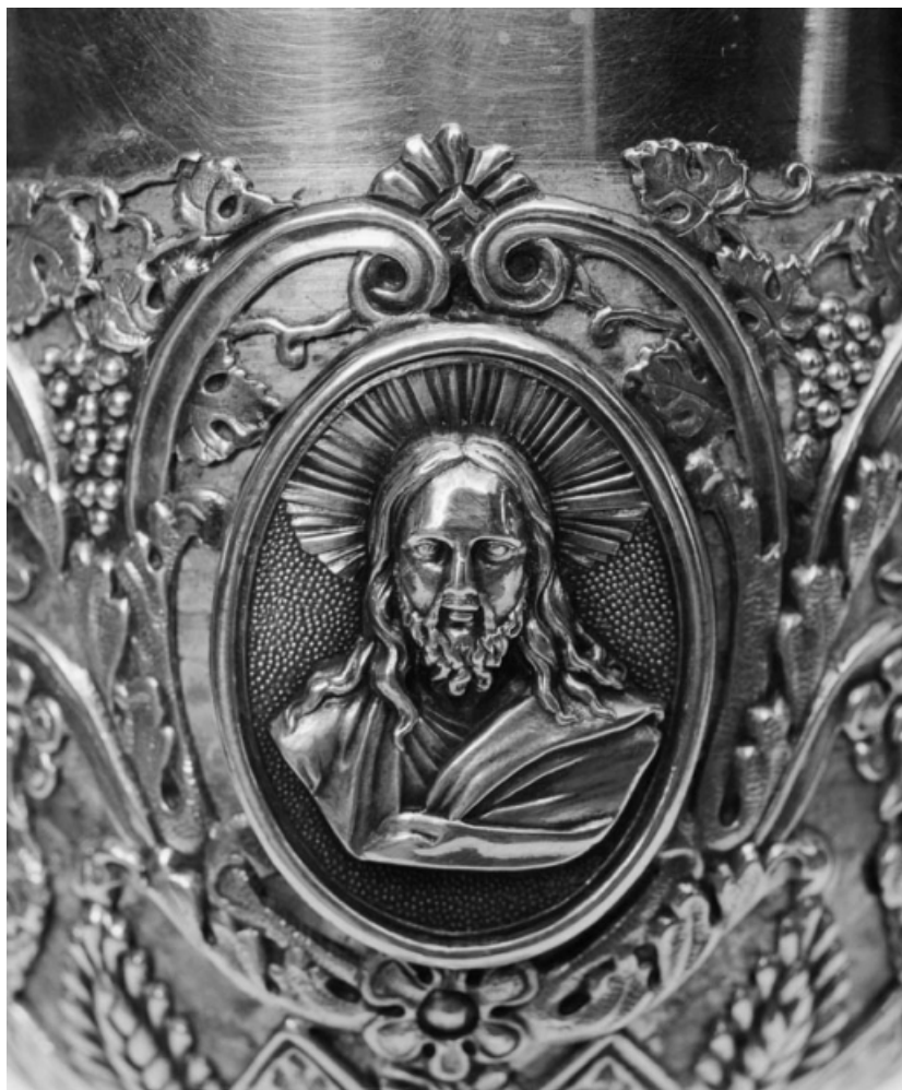
Détail d'un médaillon de la fausse-coupe.