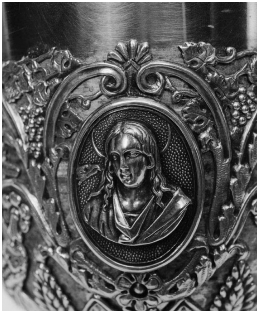
Détail d'un médaillon de la fausse-coupe.