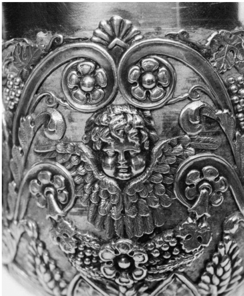
Détail de la fausse coupe.