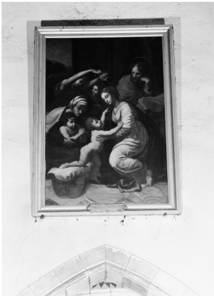
Vue d'ensemble (photo prise en 1979). 21, Nolay