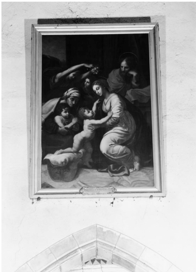
Vue d'ensemble (photo prise en 1979). 21, Nolay