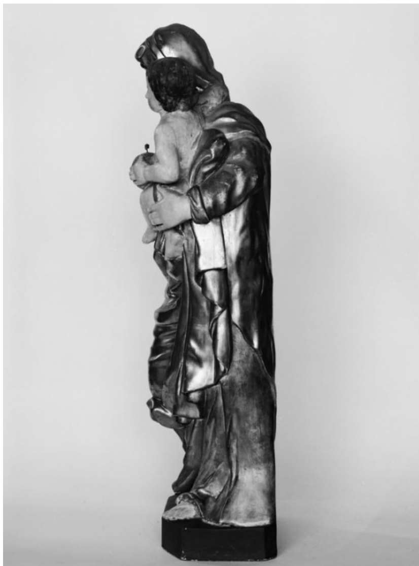
Vue de profil gauche.