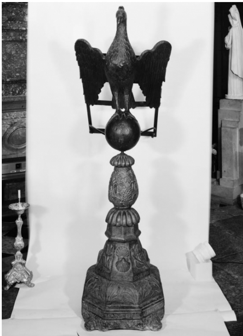
Face. 21, Nolay