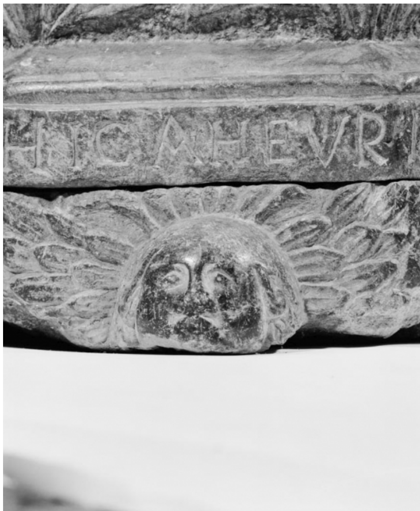
Détail de la base du pied.