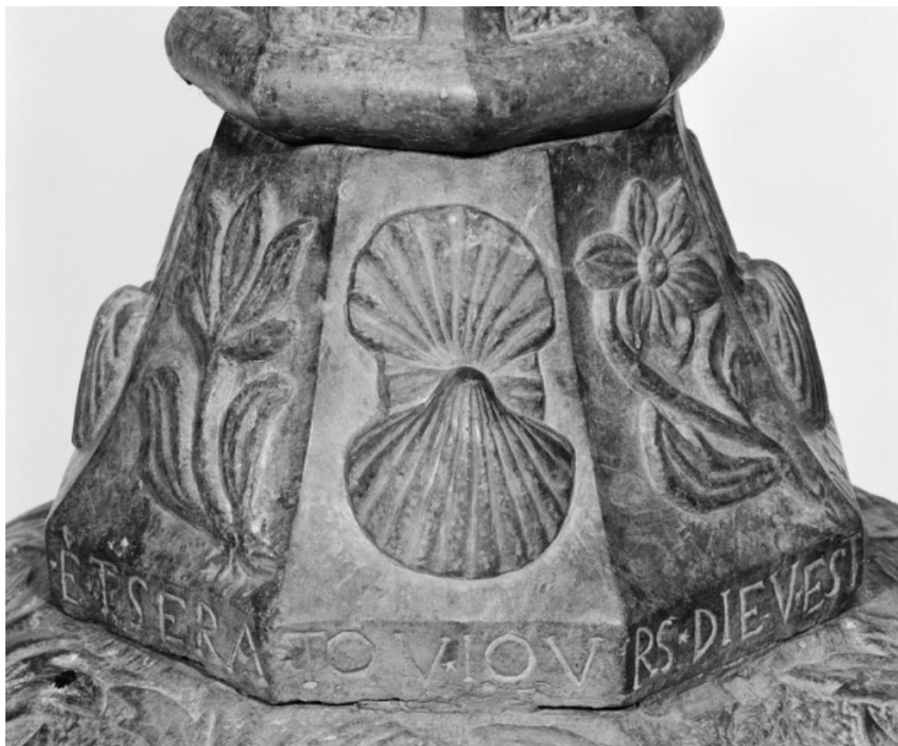
Détail de l'inscription sur le pied.