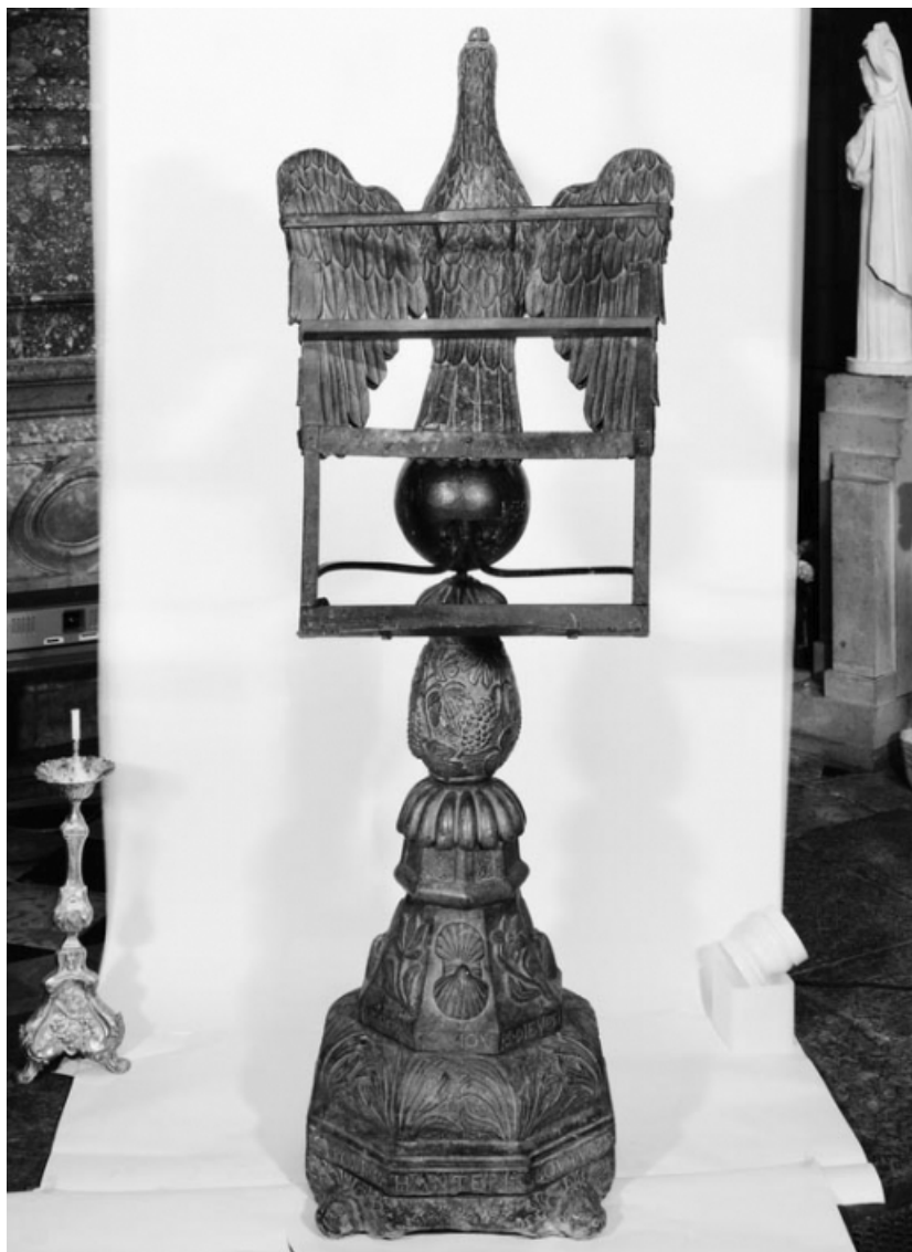
Revers. 21, Nolay