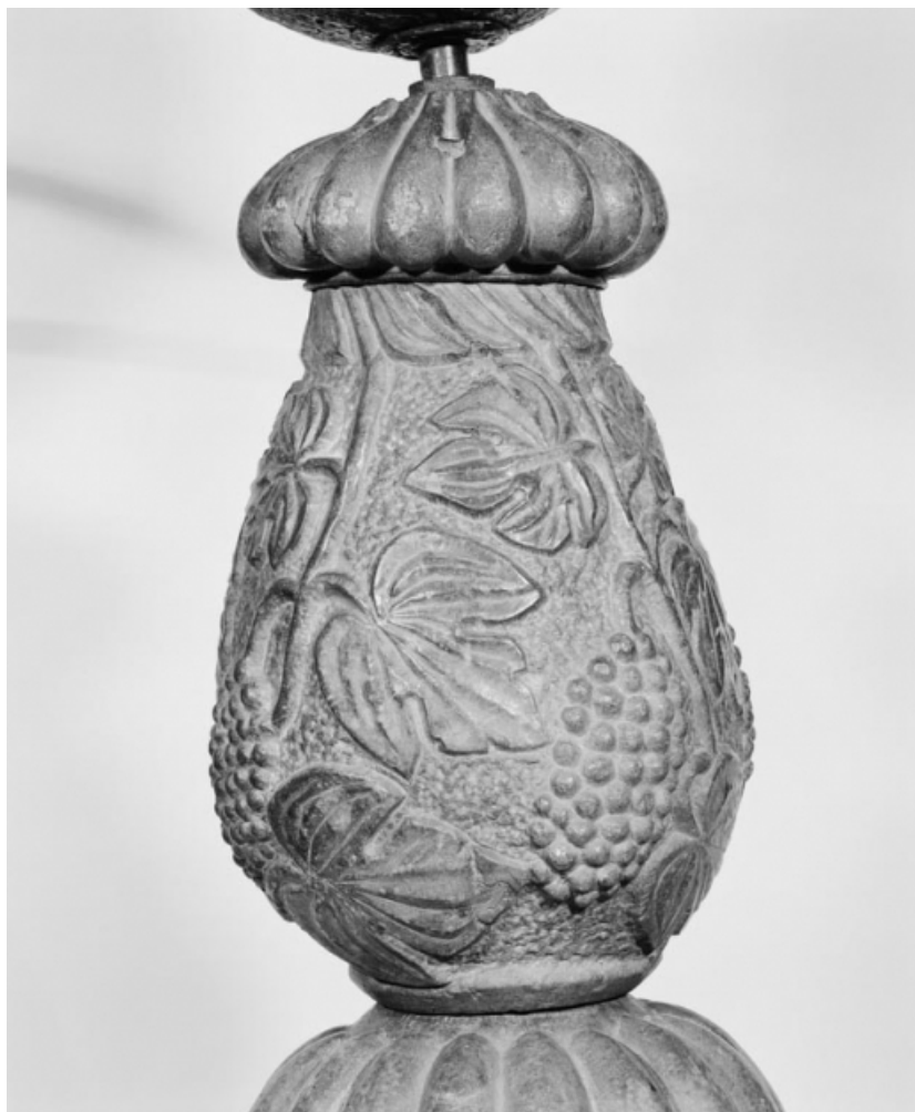
Détail du noeud sur le pied.