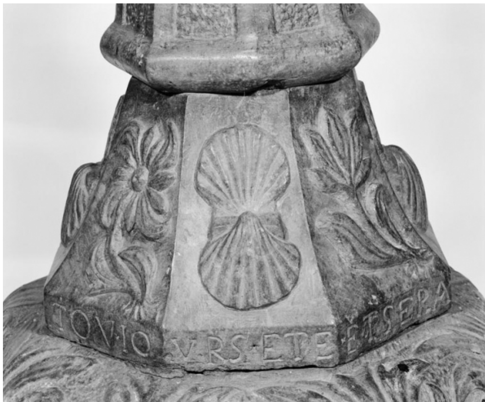
Détail de l'inscription sur le pied.