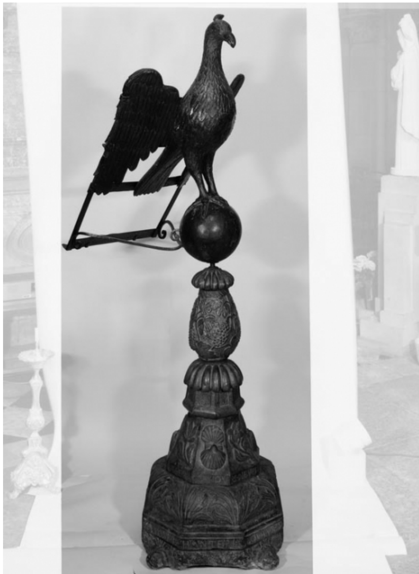
3/4 gauche. 21, Nolay