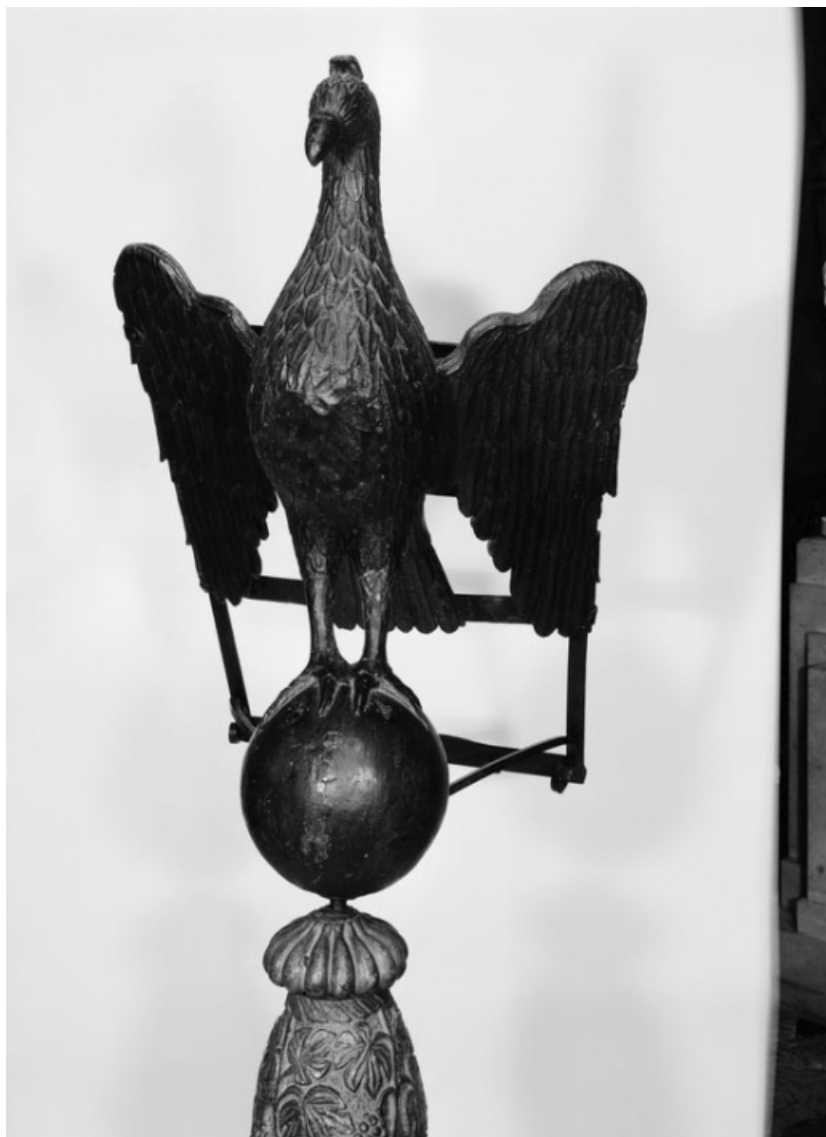
Détail de l'aigle.