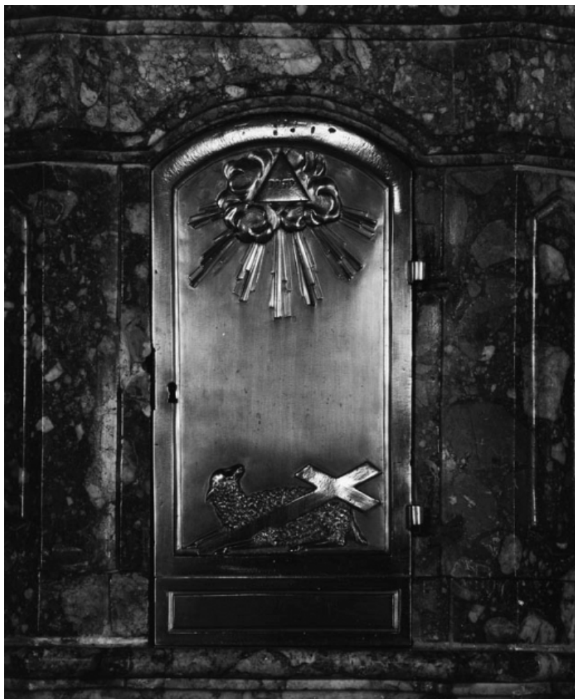
Porte du tabernacle.