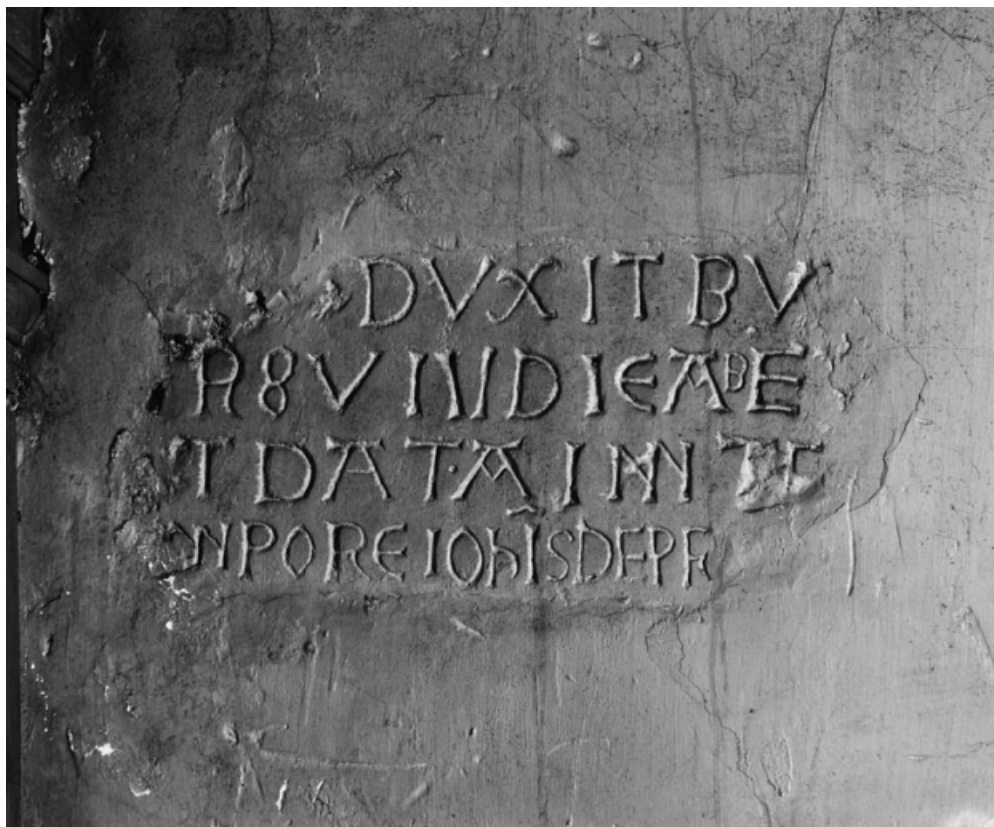
Détail de l'inscription.