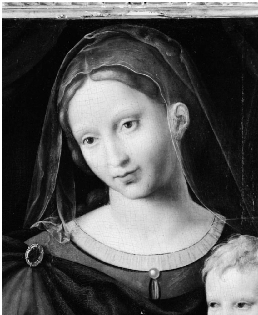
Détail de la tête de la Vierge.