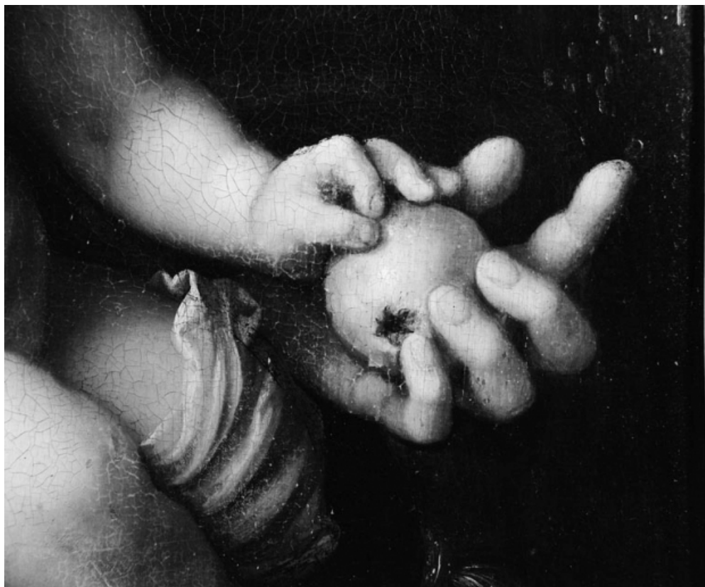
Détail des mains de la Vierge et de l'Enfant.