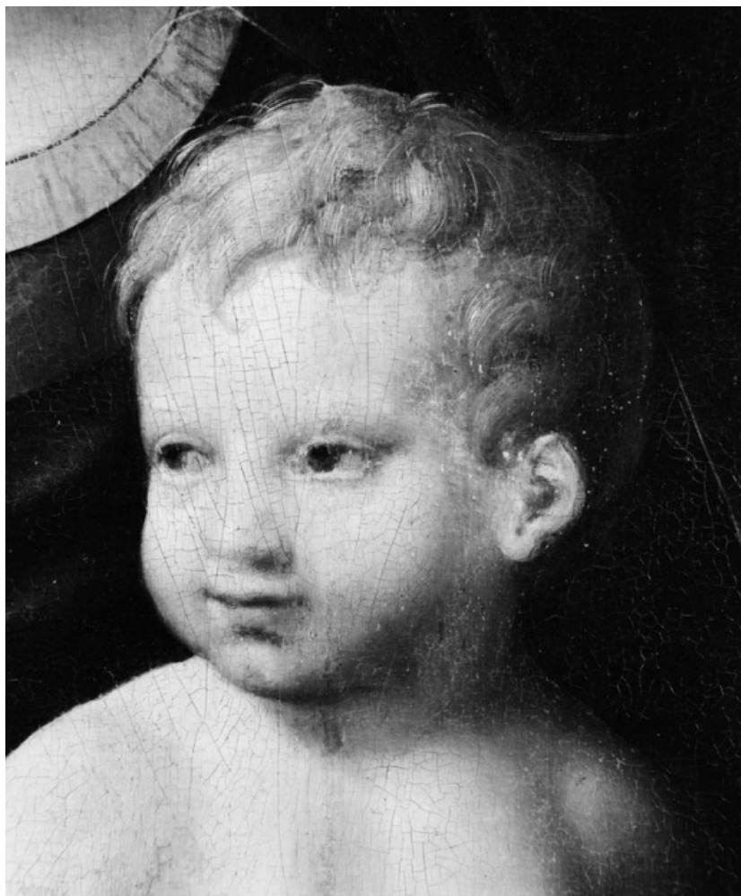
Détail de la tête de l'Enfant.