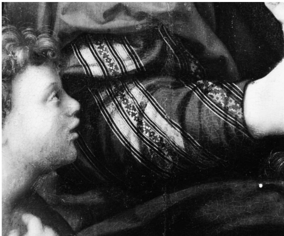
Détail du vêtement de la Vierge.