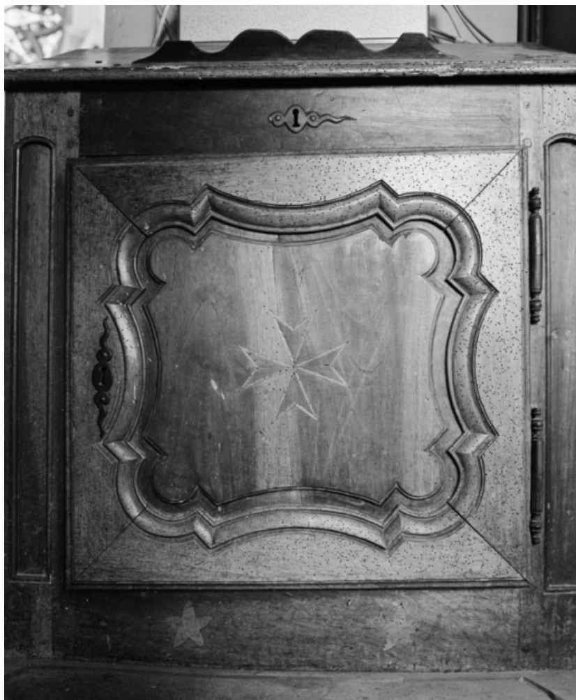
Détail de la porte.